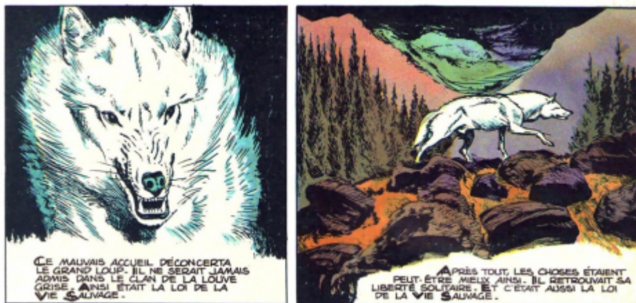
Illustration 2 : Eduardo Teixeira Coelho et Jean Ollivier, « Le Père loup », Pif Gadget , n° 788, 1 er mai 1984.

très vite des meutes, mais elles ne lui conviennent pas non plus. Il finit par retourner à son errance, car « Après tout, les choses étaient peut-être mieux ainsi. Il retrouvait sa liberté solitaire. Et c'était aussi la loi de la Vie Sauvage » (« Le Père loup », Pif Gadget n° 788, 1 er mai 1984). Ce discours en creux contre la domestication, même si le Loup conserve une relation particulière à la jeune fille qu'il vient retrouver après avoir été rejeté par un clan, est particulièrement rare dans la bande dessinée jeunesse, et témoigne d'une préoccupation sincère et informée pour ces sujets.