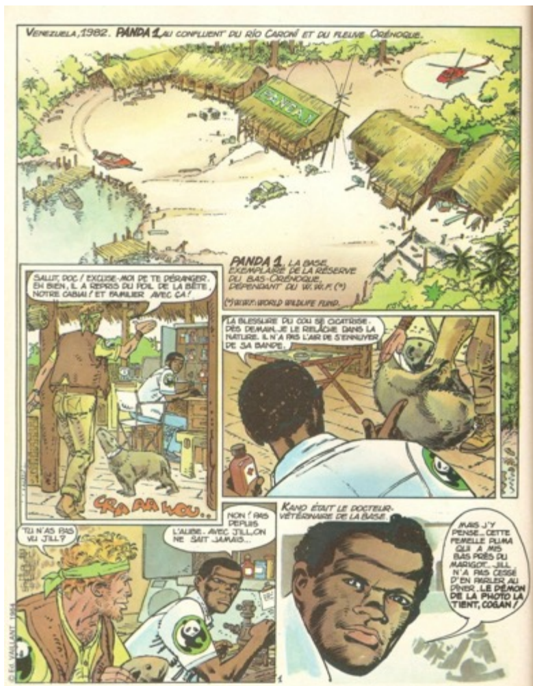
Illustration 4 : Christian Gaty et Jean Ollivier, « L'Homme des tropiques », Pif Gadget , n° 726, 22 février 1983, p. 28. Première page des aventures d'un des derniers grands héros du journal, on note les logos du WWF très visibles et le nom d'une base rendant clairement hommage à l'ONG.