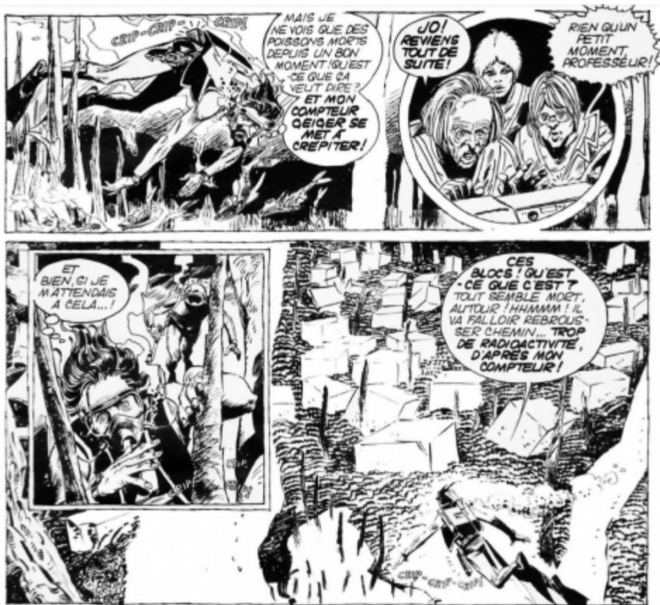
Illustration 5 : Adolfo Usero et Victor Mora, « Les Hippos d'Aquaria », Pif Gadget , n° 303, 16 décembre 1974, p. 41.