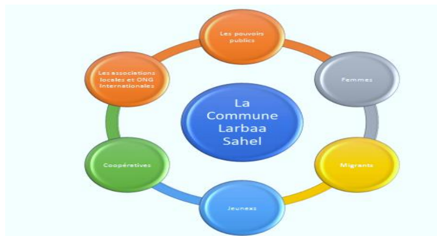
Figure 1 : Les parties prenantes du conseil communal Arbaa Sahel

La première étape de notre analyse des entretiens, nous a permis d'identifier en premier les acteurs ou les parties prenantes du conseil communal, qui sont présentés dans le schéma à côté :