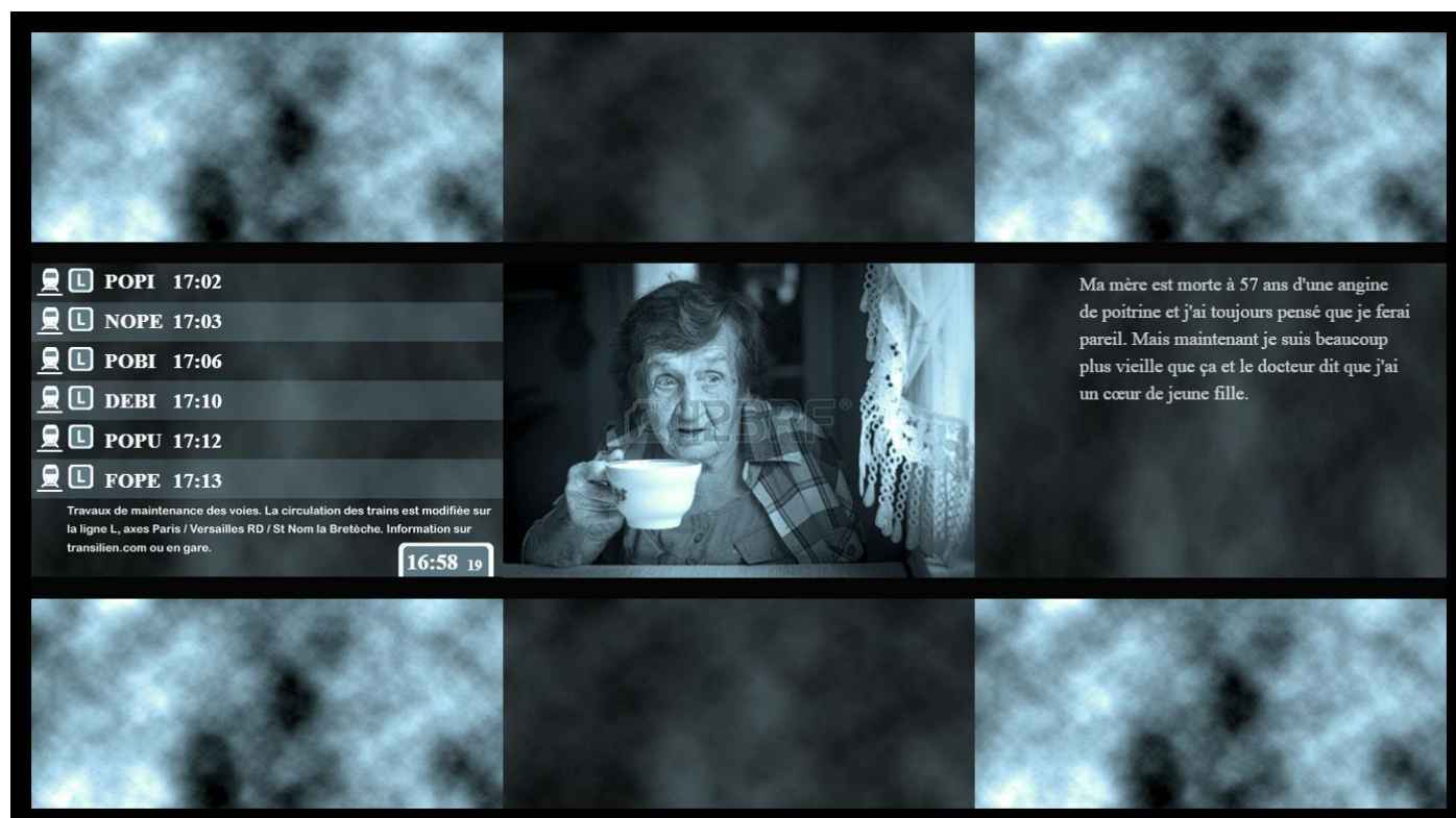
Figure 1 - Lucette, Gare de Clichy , œuvre développée pendant mon doctorat

Pendant ma thèse, j'ai travaillé sur les potentialités narratives des flux de données. J'avais constaté que les œuvres d'art numérique qui s'appuient sur des données intègrent rarement des récits. Pourtant il me semblait que le rapport au réel et le rapport au temps qui s'y jouaient était propice à la narration. J'ai créé un dispositif numérique qui s'appuie sur un flux de données en temps réel et j'ai montré que le récit de fiction pouvait s'appuyer sur un tel dispositif. Dans une œuvre comme celle-ci, le support est le web, le matériau avec lequel je crée, ce sont les données. La forme que j'utilise, c'est la fiction littéraire.