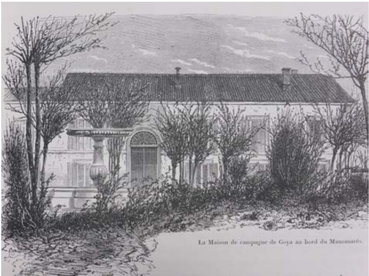
Palacete de los descendientes de Goya. Grabado de 1867, del libro de Yriarte.