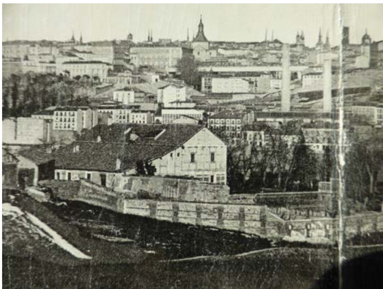
Palacete de los sucesores de Goya, desde atrás. Tarjeta postal hacia el año 1908. Colección C. Teixidor.