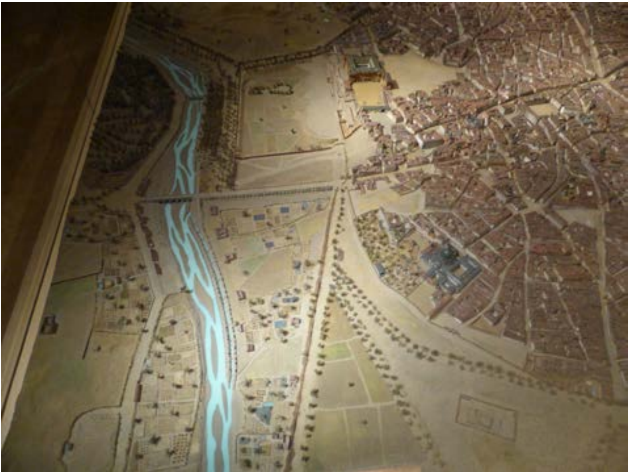
Otra vista más amplia de la maqueta de Madrid, con el río Manzanares. En el borde izquierdo, la casa de Goya.