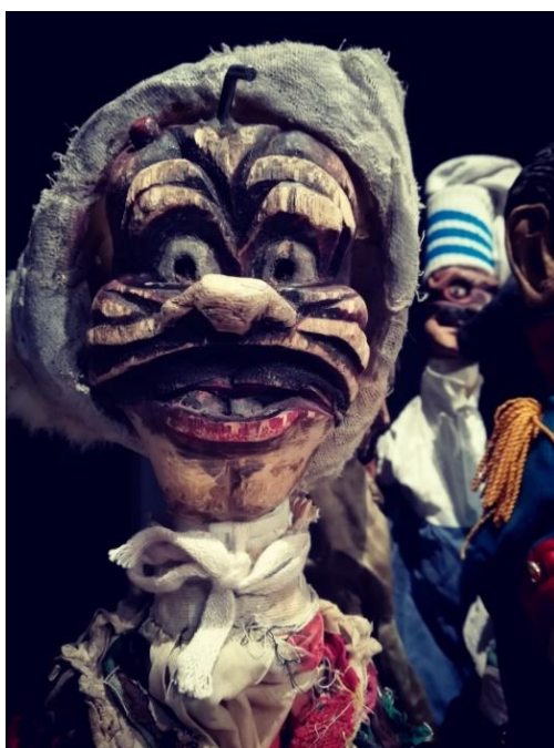
Arlecchino. Burattino in legno di Gigio Brunello.

Arlecchino – e non Macbeth – andrà incontro alla morte, ucciso perché ha dimenticato la sua identità e, soprattutto, i limiti che essa impone. Arlecchino sa che il burattinaio non vuole fargli avere la parte di Macbeth perché ritiene che lui sia buono solo a sbattere la testa contro il muro e ad agitare il batocchio sul boccascena. Ribellandosi al volere del burattinaio, Arlecchino rifiuta le gag dei burattini: questo è il limite che ha oltrepassato. Il teatro in baracca, o chi per esso, ancora non è pronto a vedere una testa di legno fare «una parte che si rispetti» e Arlecchino pagherà il suo affronto con la morte. Ostinatamente, dal lamento nel prologo all'interruzione della commedia, dall'assunzione del ruolo di Macbeth alla morte in scena per mano di Pantalone-Macduff, Arlecchino porta avanti la sua volontà fino a perdere sostanza corporea, fino a scomparire dalla scena per non essere più visto. Non succede qui, come altrove siamo abituati a vedere, che il burattino ricompaia irrealisticamente dopo un combattimento mortale a suon di bastonate. Arlecchino muore, e quando Colombina lo scopre lo spettacolo finisce, ogni livello di finzione si chiude con una struttura ad anello che riporta alla situazione iniziale, uguale ed opposta insieme.