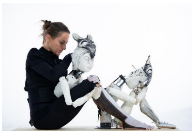
Il canto della caduta.

Per i corvi il ragionamento è stato totalmente opposto. Inizialmente avevamo ragionato sulla possibilità di costruire degli uccelli realistici, poi ci siamo rese conto che non era la scelta più adatta per quei personaggi. Le loro caratteristiche emergevano decisamente meglio da un taglio più astratto, che mettesse in risalto la meccanica che li muove. Lo stesso controller che uso per manovrarli, il joystick (nato nel campo dell'aviazione militare), ci sembrava perfettamente coerente con il mondo della guerra che i corvi evocano nello spettacolo.