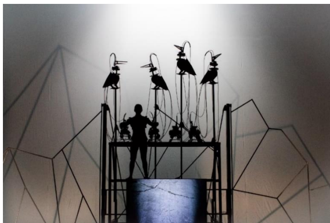
Il canto della caduta.