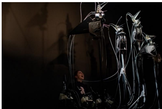
Il canto della caduta.

Trovo interessante quando il confine tra umano e non umano è più teso verso il concetto di protesi, mi piace quando le cose che costruisce Paola diventano pezzi che prolungano il mio corpo piuttosto che cose che si vanno a sostituire ad esso. Mi piace l'idea che attraverso la meccanica delle figure animate in forma manuale, il pubblico si stupisca riscoprendo le infinite possibilità dell'umano.