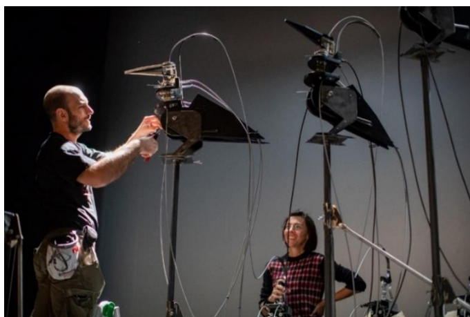
Il canto della caduta , backstage.

Un cambiamento importante nel nostro approccio è stato l'incontro con due aziende, Igus e Marta s.r.l., che hanno scelto di diventare nostri sponsor tecnici, fornendoci una componentistica industriale che ci permette di realizzare meccaniche più precise e più resistenti alle sollecitazioni della tournée. È stata una grande soddisfazione vedere come aziende che si occupano di tutt'altro, abbiano deciso di credere e investire nel nostro progetto artistico. Segno che ci ha convinte a portare avanti con ostinazione le nostre scelte.