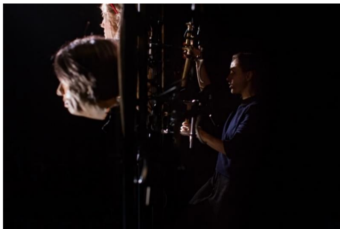
Sorry, boys .

Questo "buco" all'interno della dinamica del dialogo spezza la credibilità dell'interazione, portando lo spettatore a non credere più al gioco di animazione e a identificare i pupazzi come personaggi animati da una burattinaia "lenta". Di conseguenza è stato a volte necessario aggiungere delle battute che il testo non prevedeva, assegnandole a un personaggio collocato in un punto strategico tra gli altri due di cui dovevano susseguirsi le battute, in modo da liberare la mano giusta al momento giusto. In casi come questo è l'esigenza della manipolazione che costringe a trovare delle soluzioni a livello drammaturgico.