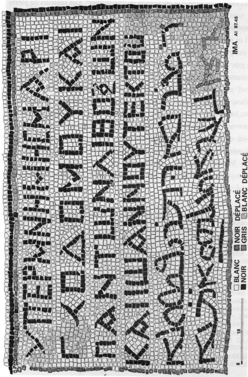
Fig. - 2. Facsimile de la double inscription.