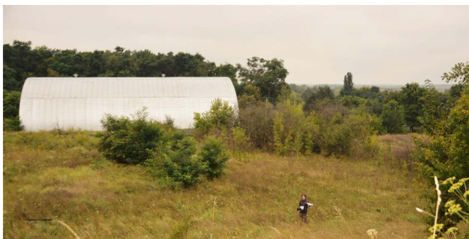
Fig. 1 : Vue générale du site de Gontsy en 2016.

un premier amas d'ossements (cabane n°1) qu'il décide de conserver en place protégé par un coffrage en bois qu'il enterre. La guerre interrompt les fouilles en 1916, puis la révolution oblige V.M. Scherbakivski à quitter le pays pour l'Allemagne, où il publiera une courte note sur "Hontsy" (Scherbakivski, 1919, 1926 ; Gorodtsov, 1926). En 1935, une équipe ukraino-russe, dirigée par I.F. Levitski et A.I. Brusov, fouille une surface importante de 380 m 2 depuis le niveau archéologique à accumulation d'ossements de mammoths situé dans les paléoravines jusqu'aux habitations du promontoire où quelques fosses de la cabane de 1915 sont fouillées. (Levitski, 1947 ; Brusov, 1940). Entre 1977 et 1981, V. I. Sergin, de l'Institut d'Archéologie de Moscou, reprend des fouilles limitées consacrées exclusivement à la recherche et au démontage de la cabane de 1915 et à sa proximité (Sergin, 1981, 1983).