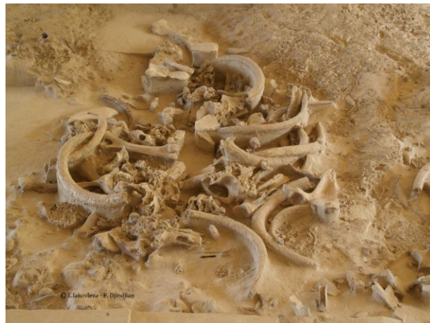
Fig. 10 : Structure n°5 (cabane 4).

LA STRUCTURE N°6 (CABANE N°5), décapée entre 2011 et 2013, est une grande cabane ovale de 8 mètres de diamètre. L'inventaire des ossements comprend : 46 crânes (plus 21 grands fragments), 7 mandibules, 62 défenses (plus 6 demi-défenses), 48 omoplates, 10 bassins, 34 os longs, 14 bois de rennes et dix pierres (galet de granit et dalles de schistes) (Fig. 11). Au Nord-est de la cabane, une fosse contient des ossements de mammoths (crâne, défenses, os longs).