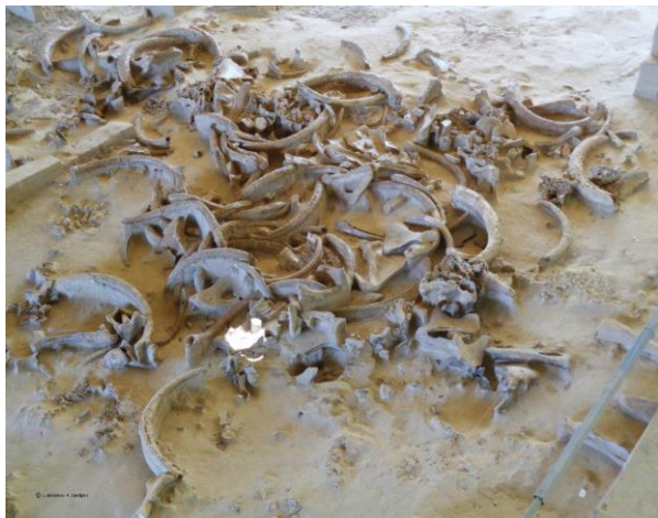
Fig. 9 : Structure n°4 (cabane n°3) (fouilles 2009-2014).

LA STRUCTURE N°5 (CABANE N°4), dégagée en 2011-2012, est une cabane de 4 x 2,6 m 2 . Elle est constituée d'un ovale de quinze crânes, de trois os longs dont un fémur qui présente la gravure d'un chevron emboîté féminin, de six bassins, de quatorze omoplates et de vingt-quatre défenses, dont l'une possède de courtes lignes transversales peintes de couleur rouge. La cabane s'est effondrée vers l'intérieur (Fig. 10).