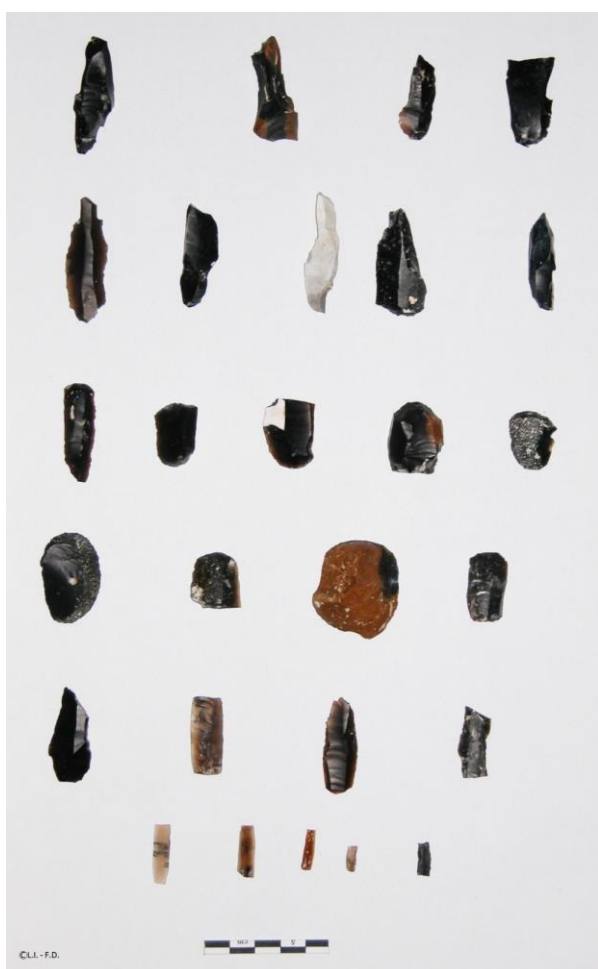
Fig. 17 : Outillage lithique (burins, grattoirs, lamelles à dos, pointes).

Les grattoirs en bout de lame, les burins, les pièces retouchées et les lamelles à dos sont les principaux types d'outils en silex. Les burins dominent l'outillage (45%), principalement représentés par des exemplaires sur cassure et sur troncature. Les grattoirs (27%) sont des grattoirs simples en bout de lame, presque unguiformes. Les lames et lamelles retouchées et troncatures (20%), les becs (2%), les pièces à dos (6%), et les pointes (moins de 1%)