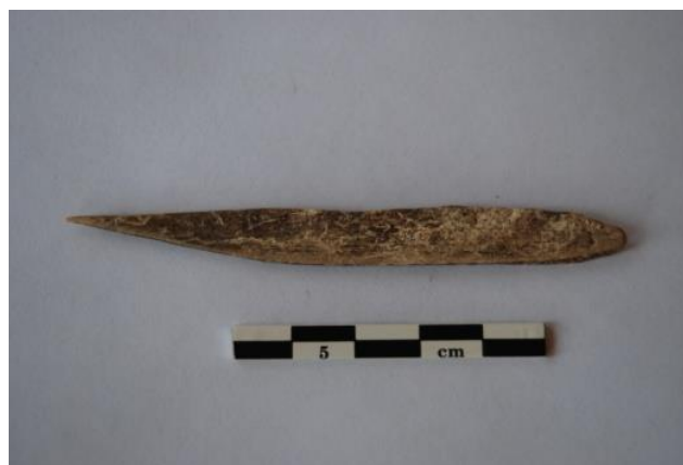
Fig. 15 : alène en os de lièvre ou de renard.

L'INDUSTRIE LITHIQUE dans le site de Gontsy provient de l'intérieur des cabanes, des fosses et de leur proximité immédiate, des zones d'activités de l'habitat (Fig. 16), des zones de vidanges de foyers et de dépotoirs, des accumulations d'ossements de mammouths de la paléoravine orientale.