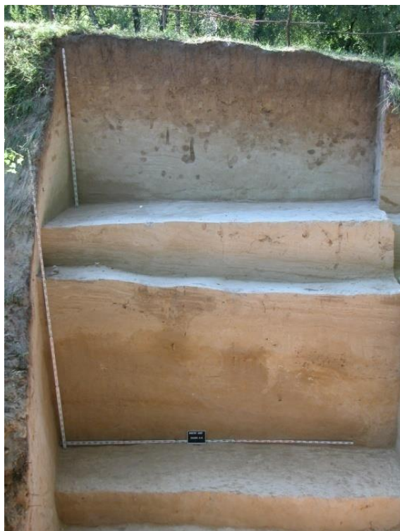
Fig. 4 : Coupe N/S au Sud du site (fouilles 2007).