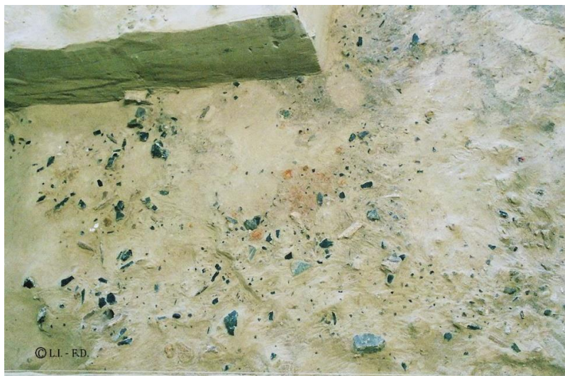
Fig. 16 : Vue de détail des zones d'activités