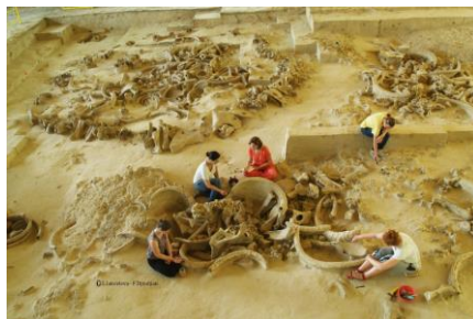
Fig. 12 : Structure n°7 (cabane n°6).