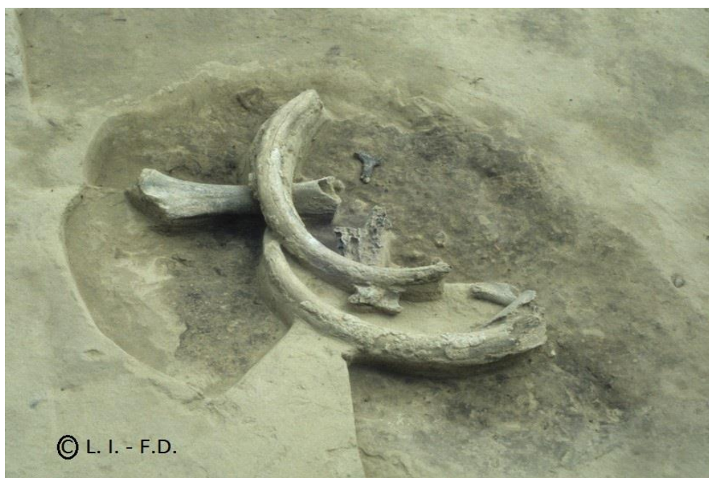
Fig. 8 : Structure n°2 (petite cabane n°2) (fouilles 1998).

LA STRUCTURE N°2 (CABANE N°2), située au nord-ouest de la précédente, a été découverte en 1998. Elle est exceptionnelle par sa petite taille et la lisibilité de sa structure. Il s'agit d'une petite cabane ovale en cuvette de dimensions 2,7 x 1,7 m 2 , avec ses matériaux de construction façonnés intacts en os de mammoths : un fragment de crâne en position centrale, un fémur, un humérus, deux défenses entières de mâles adultes d'une longueur de 1,70 mètre et des alvéoles de crânes. Un beau marteau en bois de renne, une défense de jeune mammoth gravée, un demi-bassin de jeune mammoth portant des traces d'ocre et deux outils sur côte de mammoth ont été découverts à l'intérieur de cette structure. C'est la première petite cabane de ce type découverte dans un site du bassin du Dniepr (Fig. 8).