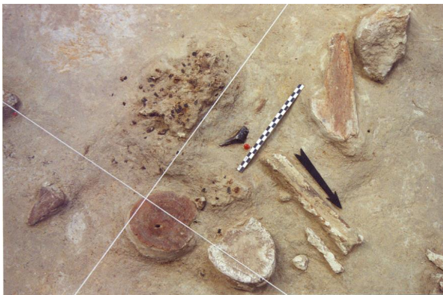
Fig. 7 : Exploitation de l'accumulation d'ossements de mammoths : foyer et outils en silex (hangar 2, fouilles 2005).

Dans la littérature publiée sur les habitats de la grande plaine d'Europe orientale, les cabanes en os de mammoths, très spectaculaires, révélées dans les années 1950-70, ont souvent été les seules étudiées et publiées et l'étude de la totalité du site a été négligée (Iakovleva, 2003b). A Gontsy, il est possible de reconstituer dans sa totalité, la structure du site autour des cabanes en os de mammoths, et de reconstituer pour la première fois une économie et une paléo-sociologie des campements de chasseurs de la grande plaine orientale.