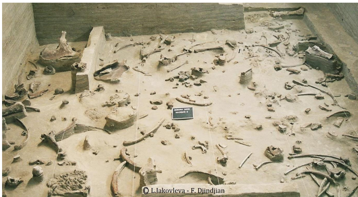
Fig. 6 : Accumulations d'ossements de mammoths dans la paléoravine (hangar 2, fouilles 2003-2006) :décapage du niveau inférieur terminé.

alternant des strates fines limoneuses et sableuses suivant la puissance du colluvionnement. La ravine était déjà comblée au moment du passage de la seconde occupation humaine, qui l'a utilisée comme dépotoir.