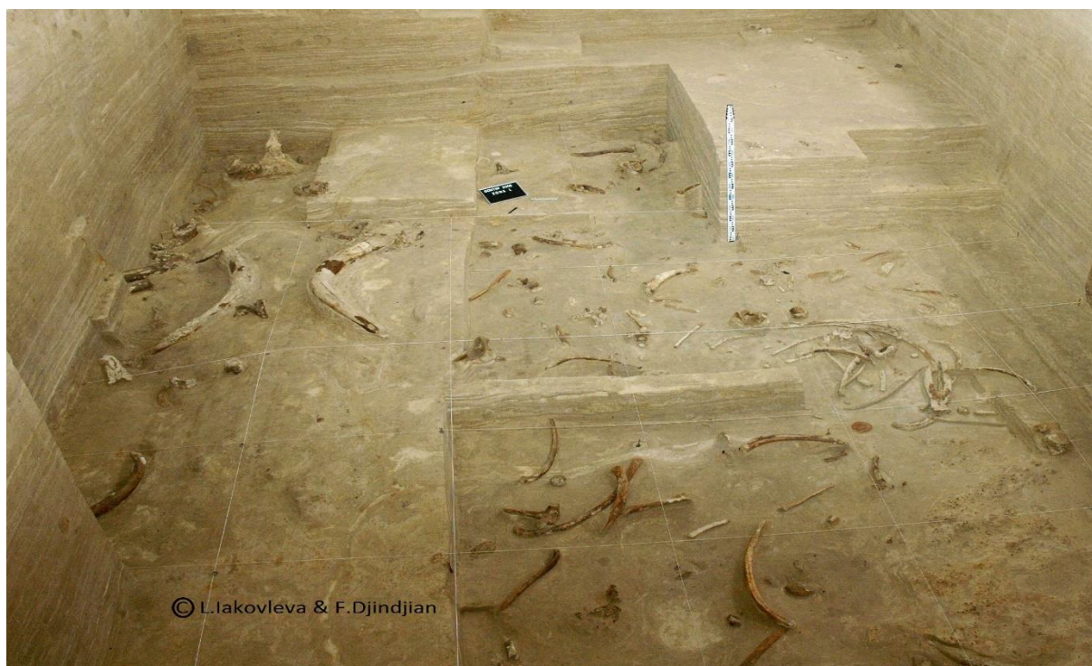
Fig. 5 : Accumulations d'ossements de mammoths dans la paléoravine (hangar 2, fouilles 2003-2006) :décapage en cours du niveau inférieur et niveau supérieur partiellement conservé.

LES ACCUMULATIONS D'OSSEMENTS DE MAMMOUTHS (« BONE BED ») DANS LES PALEORAVINES. Sur l'habitat de Gontsy, l'accumulation d'ossements de mammoths, fouillée dans la paléoravine orientale, est en relation directe, stratigraphique, taphonomique et fonctionnelle avec l'habitat à cabanes en os de mammoths.