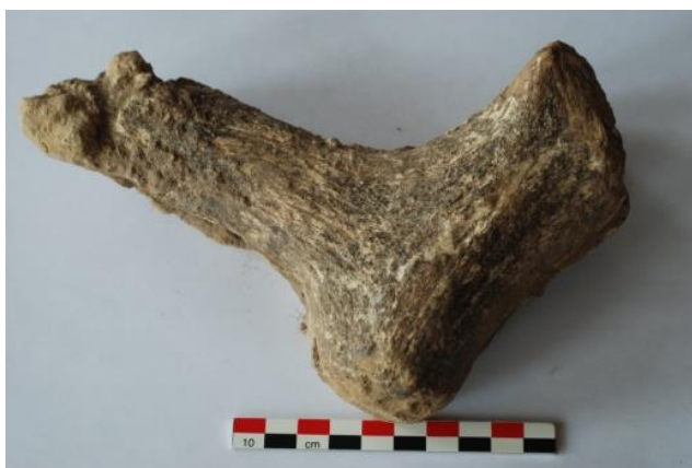
Fig. 14 : Marteau en bois de renne découvert sur le sol de la petite cabane (fouilles 1998).

L'INDUSTRIE EN MATIERE DURE ANIMALE est riche et variée, avec des sagaies en ivoire de défense de mammouth, des pics en extrémité de défense de jeune mammouth, des tranchets sur bassin de mammouth, des couteaux en côtes de mammouth, des marteaux en bois de renne, des alènes en os de lièvre ou de renard et des aiguilles à chas en ivoire (Figg. 14 et 15).