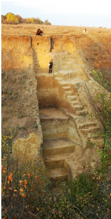
Fig. 3 : Grande coupe au sommet de la ravine : loëss et sols fossiles sur les derniers 200 000 ans.