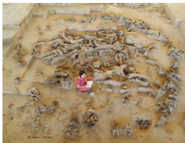
Fig.11 : Structure n°6 (grande cabane 5).

Les cabanes effondrées 3, 4, 5 et 6 ont été conservées intégralement en place sous le nouveau hangar, offrant la possibilité d'une muséographie du site (Fig.13).