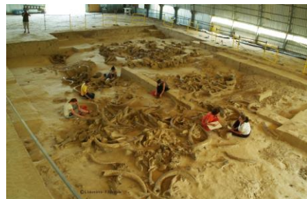
Fig. 13 : Vue générale des cabanes sous le grand hangar de protection.

Ces cabanes en os de mammoths sont la première manifestation incontestable dans l'histoire de l'Humanité d'une architecture standardisée. Les fondations de la cabane sont en