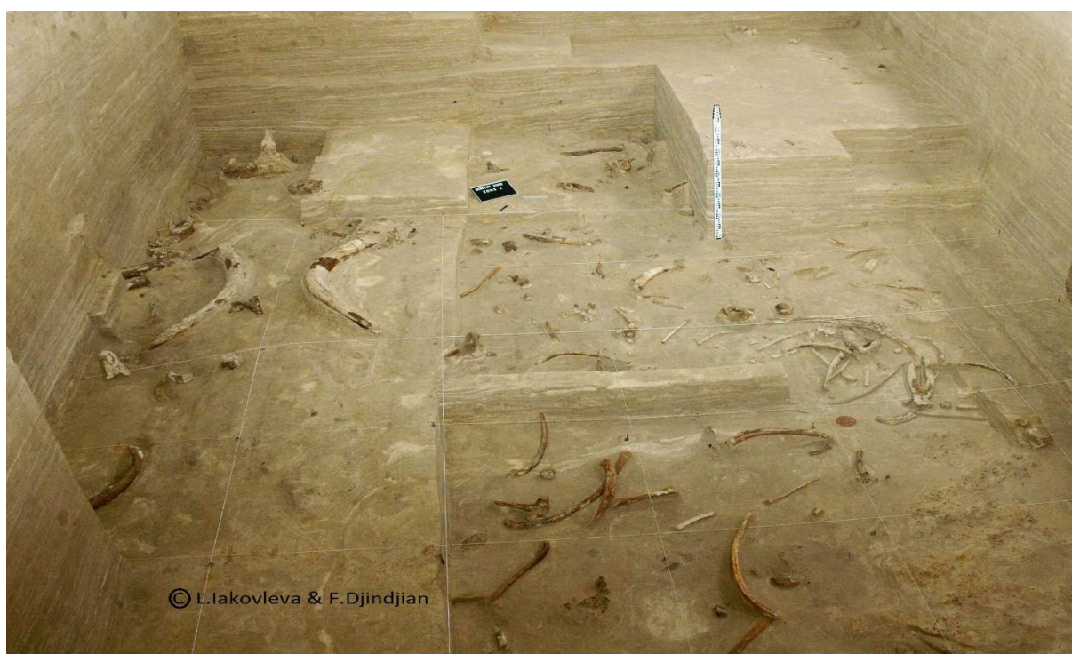
Fig. 5 : Accumulations d'ossements de mammoths dans la paléoravine (hangar 2, fouilles 2003-2006) :décapage en cours du niveau inférieur et niveau supérieur partiellement conservé.

LES ACCUMULATIONS D'OSSEMENTS DE MAMMOUTHS (« BONE BED ») DANS LES PALEORAVINES. Sur l'habitat de Gontsy, l'accumulation d'ossements de mammoths, fouillée dans la paléoravine orientale, est en relation directe, stratigraphique, taphonomique et fonctionnelle avec l'habitat à cabanes en os de mammoths.