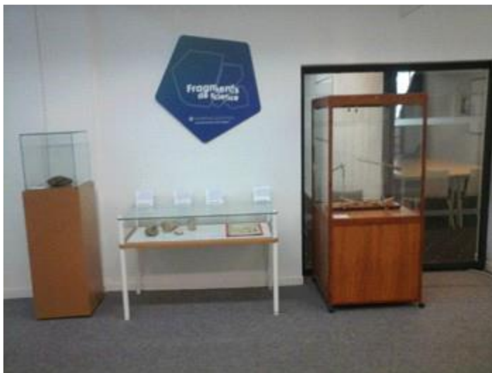
Exposition Fragments de science, BU sciences UPS

et de recherche qui ne sont que partiellement montrées à l'occasion d'expositions temporaires (Séjalon-Delmas et al., 2015).