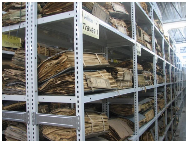
Réserve des herbiers