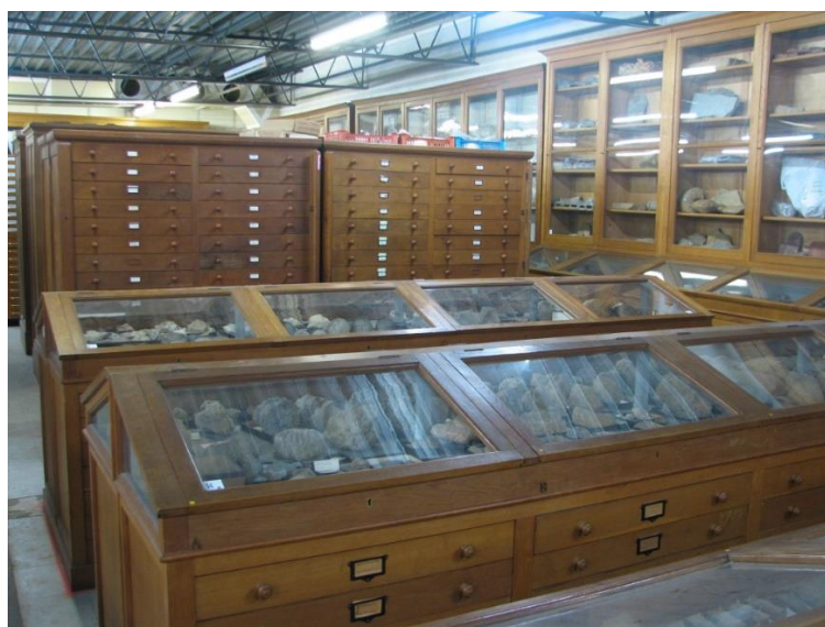
Réserve de minéralogie