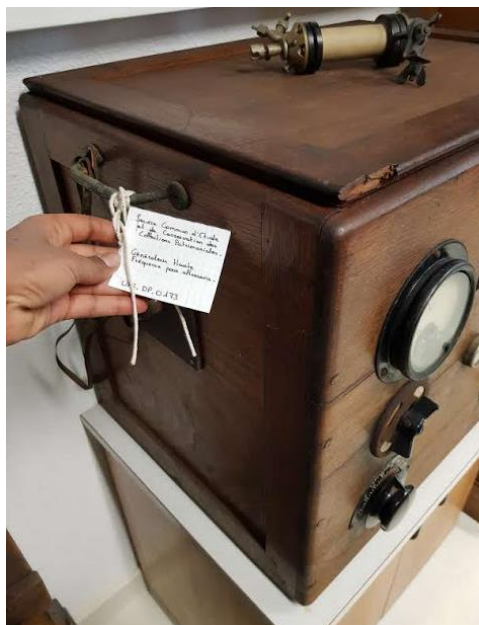
Cabinet de Physique

Ces collections sont conservées dans des locaux de stockage et ne bénéficient malheureusement pas de lieu d'exposition permanente de type musée ou centre d'interprétation. Réparties sur plusieurs sites, il est donc difficile de leur donner la visibilité qu'elles mériteraient.