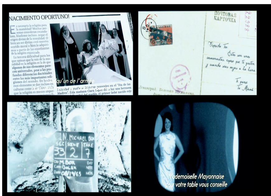
Fotograma 3: La zona de contacto entre el cine y varios medios

(2) la zona de contacto entre la banda-imagen y un trazo infantil que ilustra esa banda o se incorpora a ella para convertirse en imagen de animación fílmica. El trazado como técnica de cuño manuscrito acompaña el comentario oral de la banda-imagen sin que sepamos quién lo hace. Podría ser la niña como su primo Mario, por aparecer éste dibujando en al menos tres escenas. La película no resuelve por tanto ni la versátil identidad nominativa de la niña, ni el/la incógnito/a autor/a del trazo. (Fotograma 4).