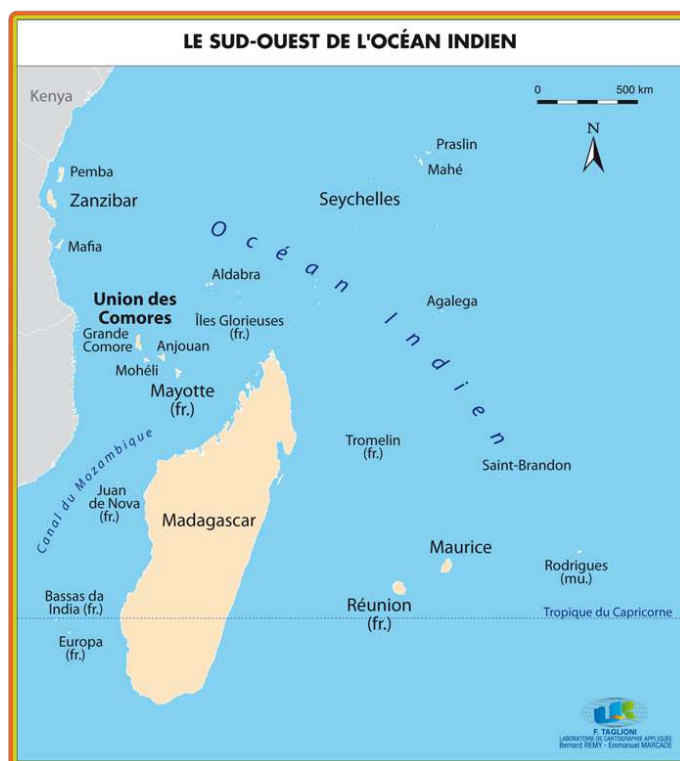
Figure 1 – Le Sud-Ouest de l'océan Indien