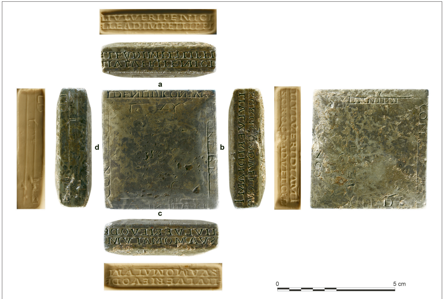
Fig. 2 – Reims, boulevard Jules-César : cachet à collyres découvert en 2018.