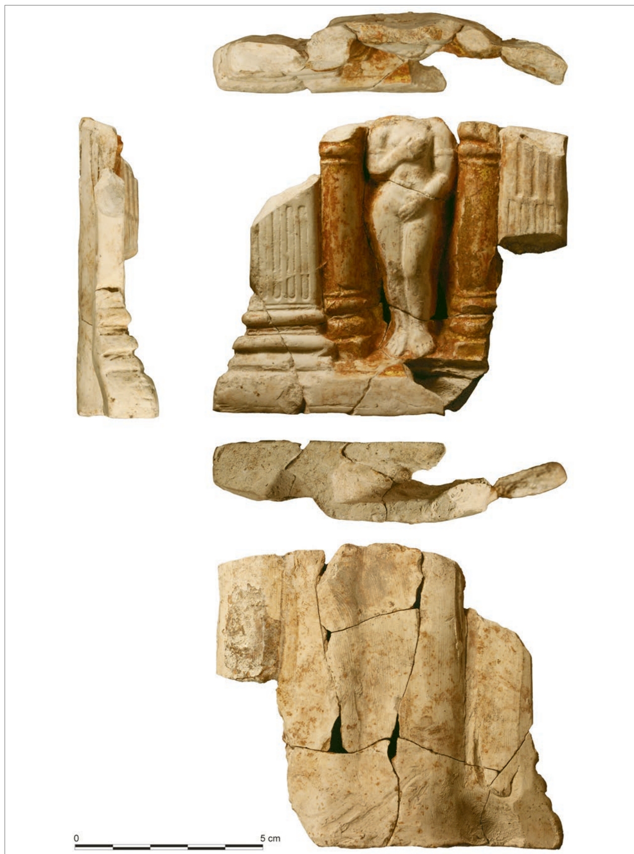
Fig. 1 – Reims, place de la République : figurine de la Vénus sous édicule.

extrémité. Selon l'iconographie connue, le haut de la niche devait être terminé par une conque radiée renversée. L'ensemble est encadré par des pilastres cannelés aux bases moulurées.