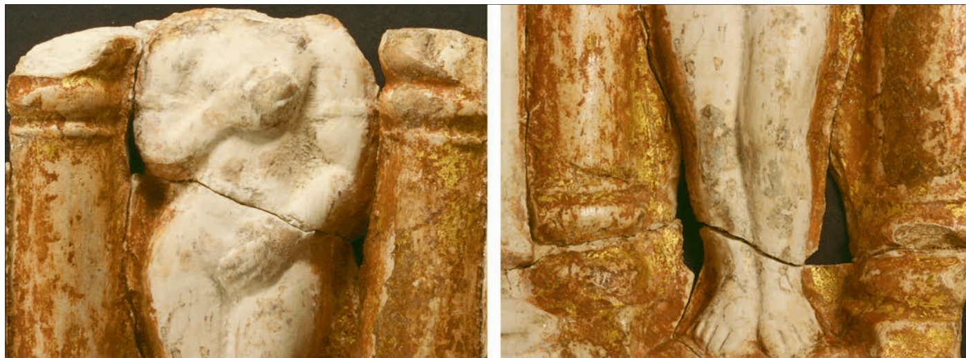
Fig. 3 – Reims, place de la République : détails des fragments de dorure conservés sur les colonnes de la niche.

Un engobe rouge recouvre le fond et les colonnes de la niche. Comme nous le verrons par la suite, ce dernier est une composante de la pratique de la dorure (assiette). Celle-ci n'est que partiellement conservée (fig. 3). Ainsi, il est possible de conclure que cette partie de la figurine a été complètement dorée. Bien que l'engobe appliqué dans le fond de la niche déborde sur le corps de la Vénus, la déesse n'a pas reçu de traitement additionnel, tout comme le reste de l'objet.