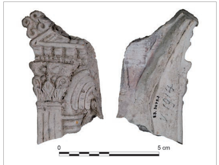
Fig. 6 – Fragment d'une figurine de Vénus sous édicule à fronton triangulaire découverte sur le site gallo-romain de Vertault/Vertillum (Côte-d'Or).

De nombreuses Vénus de cette iconographie ont été découvertes depuis le début du XIX e s. La découverte à Poitiers (Vienne), à Sanxay (Vienne) et à Minot (Côte-d'Or) d'exemplaires signés Pistillus (Rouvier-Jeanlin 1986, p. 51-52, n os 129, 133 et 134) permet d'attribuer cette production à ce coroplaste éduen, qui a exercé son travail à Augustodunum durant la première moitié du III e s. apr. J.-C. Plus récemment, une nouvelle découverte a permis de nourrir cette hypothèse : un moule a été mis au jour au sein d'un atelier d' Augustodunum attribué à Pistillus (fig. 7) (Androuin 2020). Tous ces éléments permettent d'affirmer que ces variantes iconographiques de la Vénus sous édicule sont issues de modèles créés par cet artisan. Toutefois, la figurine de Reims et les trois figurines de Vertault, Nuits-Saint-Georges et Spire apparaissent comme de nouvelles variantes. L'absence de signature rend difficile leurs attributions aux productions de l'atelier de Pistillus, mais les grandes similitudes iconographiques nous invitent à en formuler l'hypothèse (Schauerte 1985, p. 189 ; Rouvier-Jeanlin 2001, p. 210). Celle-ci pourrait être validée par des analyses chimiques de l'argile. Par ailleurs, ces deux nouvelles variantes présentent une plus grande finesse d'exécution avec un ajout supplémentaire de détails : ces éléments pourraient laisser envisager une évolution dans le travail de l'artisan.