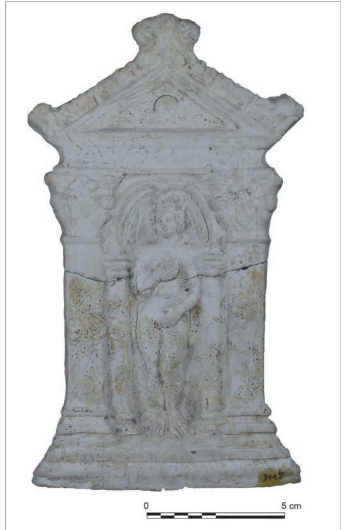
Fig. 5 – Figurine d'une Vénus sous édicule à fronton triangulaire découverte lors des travaux du chemin de fer à Autun en 1866.

sur les frontons, les chapiteaux corinthiens ou les volumes des pilastres et des colonnes permet de supposer une production issue du même atelier.