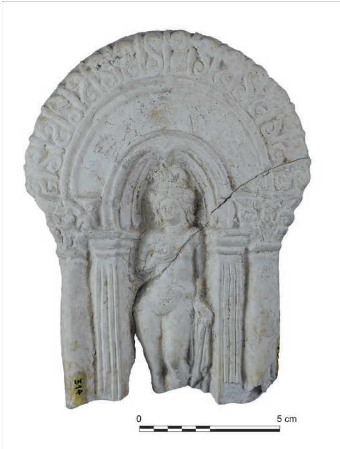
Fig. 4 – Figurine d'une Vénus sous édicule à fronton semi-circulaire découverte lors des travaux du chemin de fer à Autun (Saône-et-Loire) en 1866.