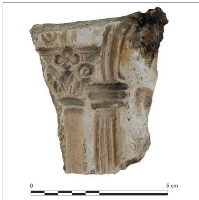
Fig. 7 – Fragment d'un moule de Vénus sous édicule découvert à Autun en 2019 à l'occasion de la fouille d'un atelier de potier/coroplaste.