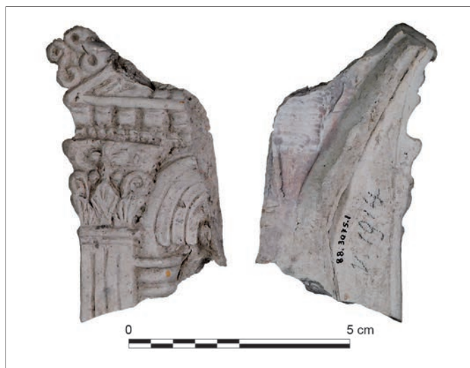
Fig. 6 – Fragment d'une figurine de Vénus sous édicule à fronton triangulaire découverte sur le site gallo-romain de Vertault/Vertillum (Côte-d'Or).