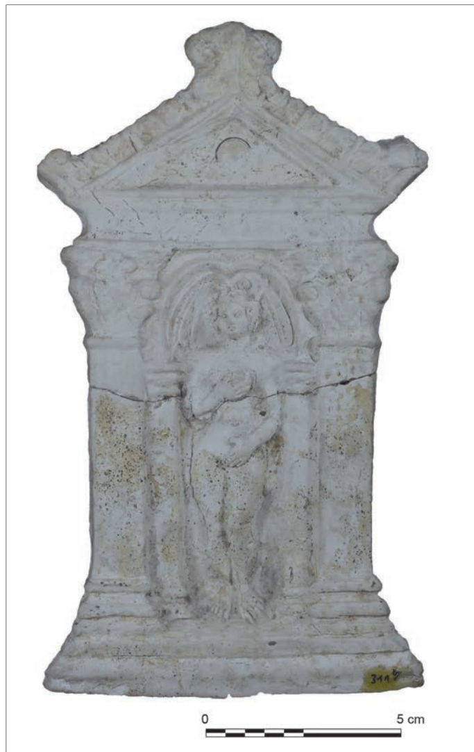
Fig. 5 – Figurine d'une Vénus sous édicule à fronton triangulaire découverte lors des travaux du chemin de fer à Autun en 1866 (cliché : L. Androuin).

De nombreuses Vénus de cette iconographie ont été découvertes depuis le début du XIX e s. La découverte à Poitiers (Vienne), à Sanxay (Vienne) et à Minot (Côte-d'Or) d'exemplaires signés Pistillus (Rouvier-Jeanlin 1986, p. 51-52, n os 129, 133 et 134) permet d'attribuer cette production à ce coroplaste éduen, qui a exercé son travail à Augustodunum durant la première moitié du III e s. apr. J.-C. Plus récemment, une nouvelle découverte a permis de nourrir cette hypothèse : un moule a été mis au jour au sein d'un atelier d' Augustodunum attribué à Pistillus (fig. 7) (Androuin 2020). Tous ces éléments permettent d'affirmer que ces variantes iconographiques de la Vénus sous édicule sont issues de modèles créés par cet artisan. Toutefois, la figurine de Reims et les trois figurines de Vertault, Nuits-Saint-Georges et Spire apparaissent comme de nouvelles variantes. L'absence de signature rend difficile leurs attributions aux productions de l'atelier de Pistillus, mais les grandes similitudes iconographiques nous invitent à en formuler l'hypothèse (Schauerte 1985, p. 189 ; Rouvier-Jeanlin 2001, p. 210). Celle-ci pourrait être validée par des analyses chimiques de l'argile. Par ailleurs, ces deux nouvelles variantes présentent une plus grande finesse d'exécution avec un ajout supplémentaire de détails : ces éléments pourraient laisser envisager une évolution dans le travail de l'artisan.