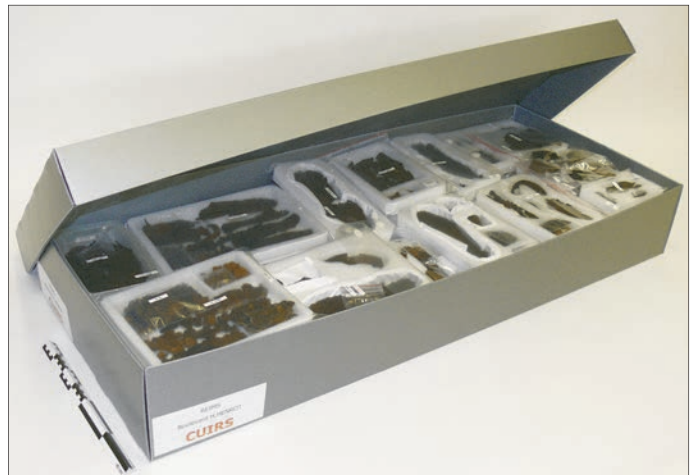
Fig. 4 – Reims, boulevard Dr Henri-Henrot : conditionnement des artefacts en cuir après traitement de stabilisation.

traitement, un soin tout particulier a été porté à ces objets peu lisibles, du fait de l'usure superficielle, et parfois fragiles, afin d'en conserver l'information et d'en faciliter la lecture.