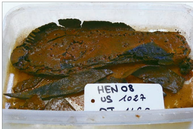
Fig. 2 – Reims, boulevard Dr Henri-Henrot : exemple de cuir recouvert d'oxydes métalliques après quelques mois de stockage.

Pour cela, la restauratrice/chargée d'étude s'est déplacée en juin 2010 à Reims, sur le lieu de stockage de la collection afin d'opérer une sélection. Pendant trois jours, avec l'assistance des archéologues, l'ensemble des 300 boîtes de stockage ont été ouvertes. Les cuirs ont été rincés sous eau courante en effectuant un nettoyage au pinceau et au doigt pour permettre une estimation des objets et déterminer l'urgence de traitement (fig. 1). Bien que stockés à température ambiante, aucune contamination microbienne n'a alors été décelée et aucun séchage ne s'était produit depuis la découverte, 18 mois auparavant. Cependant, le caractère très composite de la collection avait provoqué des dégradations durant le stockage. Dans leur grande majorité, les objets étaient constitués de cuir et de métal, essentiellement du fer. Les oxydes métalliques s'étaient donc largement répandus dans les boîtes et sur les objets eux-mêmes, les recouvrant de