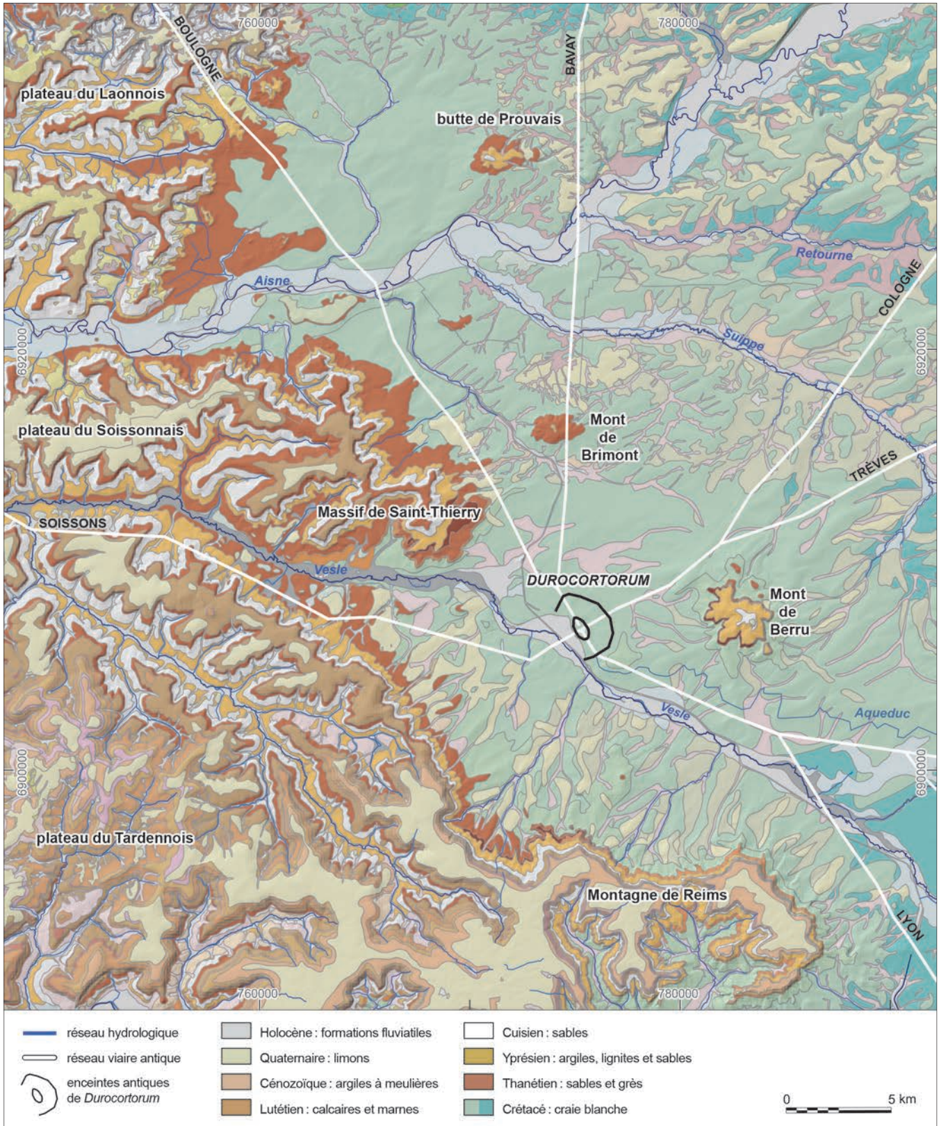
Fig. 1 – Carte géologique des environs de Reims (DAO : S. Laratte, Groupe d'étude sur les géomatériaux et environnements naturels, anthropiques et archéologiques [GEGENAA], d'après données BRGM, BD Charm, sur fond de carte géologique du BRGM, BD Alti de l'IGN et système de coordonnées RGF93).

abondants quand on se rapproche de la côte d'Île-de-France ou bien des buttes-témoins et des avant-buttes, là où les couches sont encore en place ou présentes, mais à l'état résiduel. La même chose s'observe dans la vallée de la Seine, où Leymerie (1846)