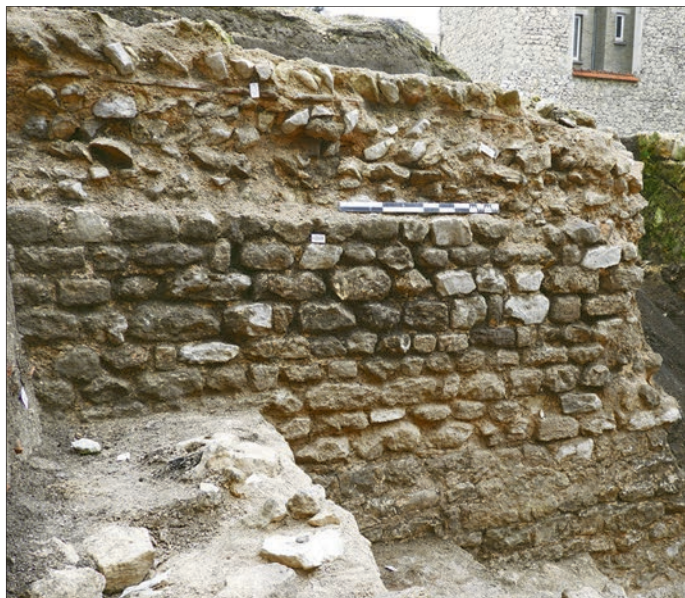
Fig. 7 – Reims, rues Marie-Stuart et Diderot (49) : mur en élévation d'un grand édifice public de la période augustéenne.

mais tous compatibles avec les formations calcaires locales (observations réalisées en mars-avril 2021, Laratte en cours) (fig. 6).