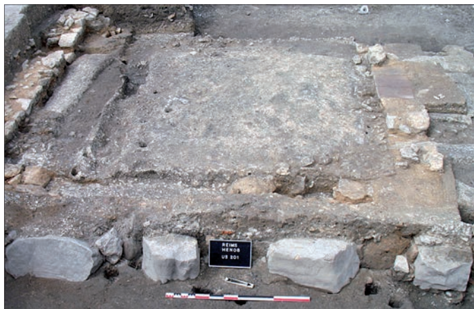
Fig. 3 – Reims, boulevard Dr Henri-Henrot (74) : construction en moellons et blocs de grès, meulières et calcaires.

Les principales ressources extraites des terrains cénozoïques locaux sont des argiles, des sables et des pierres à moellons ou à pavés. Les bancs calcaires locaux aptes à produire des pierres de taille sont en effet peu employés à l'époque antique, alors que leur usage sera plus important aux périodes médiévale et moderne (Fronteau et al. 2014).