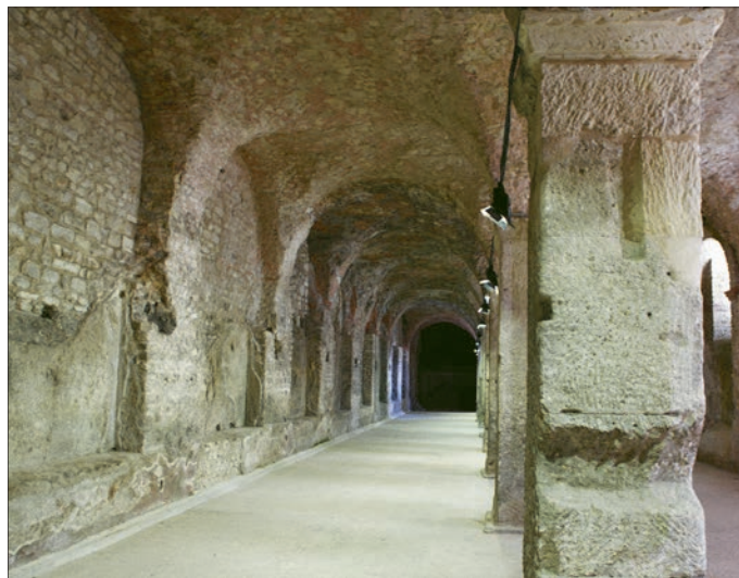
Fig. 6 – Reims, galerie de l'aile est du cryptoportique. Au premier plan, un pilier en pierres de grand appareil.

La construction de cet édifice encore très peu étudié remonterait au 1 er s. ou au début du 2 e s. apr. J.-C. d'après les dates obtenues par archéomagnétisme sur les briques 7 . Découvert en 1838 au cours de travaux d'aménagement, il n'a été partiellement dégagé et exploré qu'au lendemain de la première guerre mondiale, en 1930. Ce bâtiment forme les soubassements de ce qui était le forum antique dont les élévations consisteraient en une galerie à portique. Malgré l'impossibilité d'esquisser la totalité de son aspect initial, son ampleur est néanmoins attestée par la présence de son aile est et de l'angle qu'elle forme avec l'aile nord, d'un escalier d'accès conservé au bout de l'aile est, et par plusieurs observations ponctuelles. La galerie préservée (fig. 6) est remarquable autant par son architecture que par ses dimensions : elle mesure 57 m de long pour 9,50 m de large à l'intérieur (ce qui représente environ 11 m hors-œuvre) avec une hauteur maximale sous voûte de 5,70 m. Elle est composée