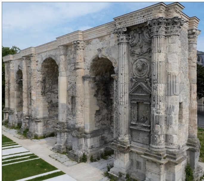
Fig. 4 – Porte de Mars. Au premier plan, une pile restaurée au XIX e s..