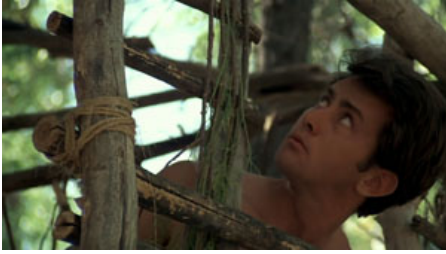
Fig. 10. T. Malick, La Balade sauvage , 1973