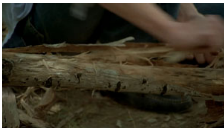
Fig. 9. T. Malick, La Balade sauvage , 1973