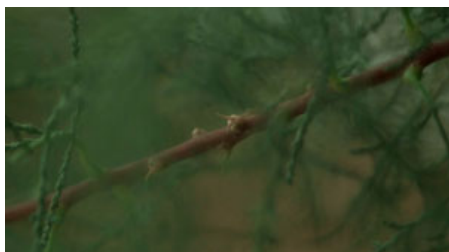
Fig. 5. T. Malick, La Balade sauvage , 1973