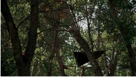
Fig. 11. T. Malick, La Balade sauvage , 1973