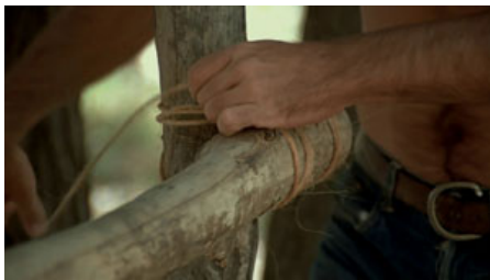
Fig. 8. T. Malick, La Balade sauvage , 1973