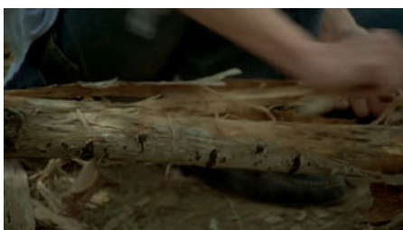
Fig. 9. T. Malick, La Balade sauvage , 1973