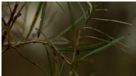
Fig. 2. T. Malick, La Balade sauvage , 1973