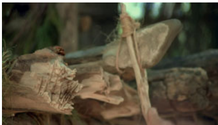
Fig. 7. T. Malick, La Balade sauvage , 1973