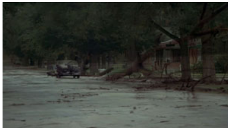
Fig. 1. T. Malick, La Balade sauvage , 1973