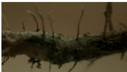
Fig. 3. T. Malick, La Balade sauvage , 1973