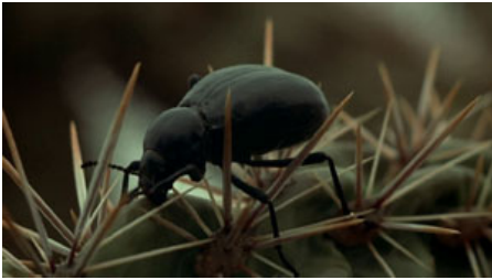
Fig. 4. T. Malick, La Balade sauvage , 1973