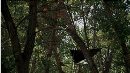
Fig. 11. T. Malick, La Balade sauvage , 1973