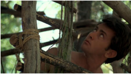
Fig. 10. T. Malick, La Balade sauvage , 1973