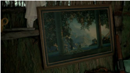
Fig. 12. T. Malick, La Balade sauvage , 1973