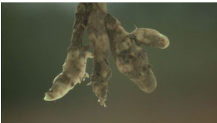
Fig. 6. T. Malick, La Balade sauvage , 1973

maintenant le ronronnement de l'action en suivant lentement le véhicule dans sa lancée le long d'une allée bordée de tilleuls, jusqu'à ce qu'en un long fondu enchaîné la voiture soit comme emportée par le borborygme des flots d'une rivière, amalgamée aux enchevêtrements d'arbres morts émergeant à sa surface (fig. 1). Durant la brève surimpression des plans, le tronc informe surnageant dans le torrent boueux dédouble en un avatar symétriquement défraîchi l'image de l'un des tilleuls érigés en bordure de la rue qu'empruntent Kit et Holly.