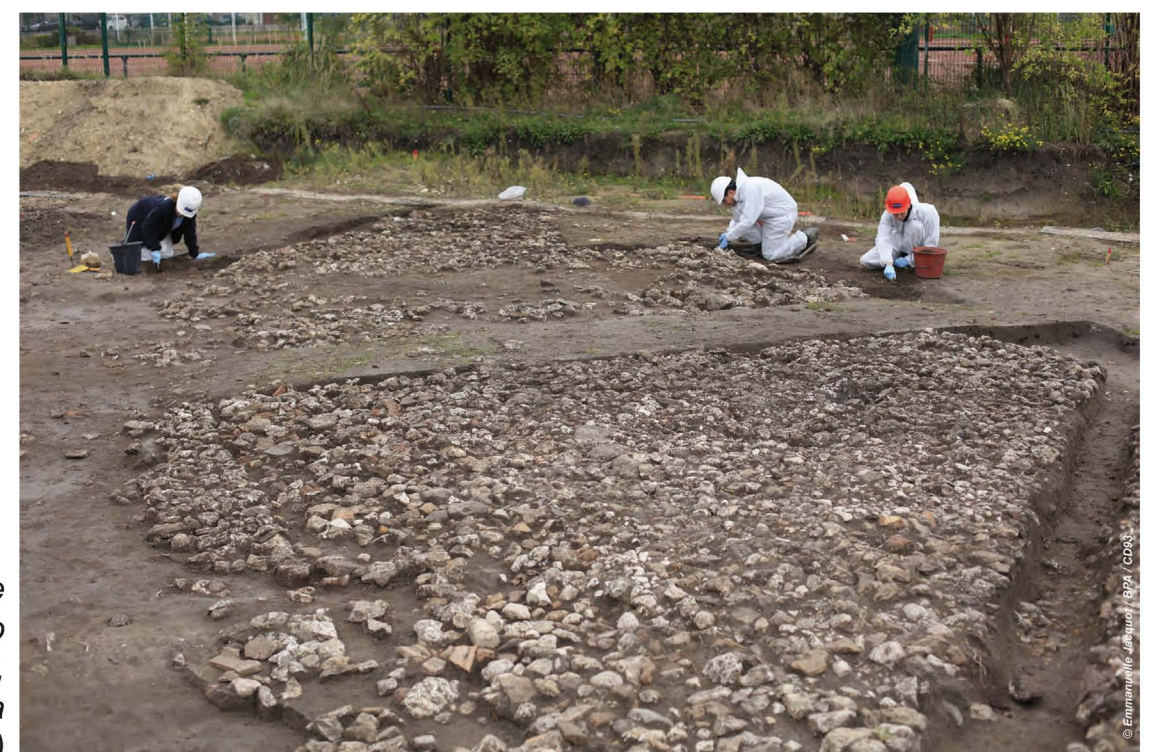
Voie en cours de nettoyage