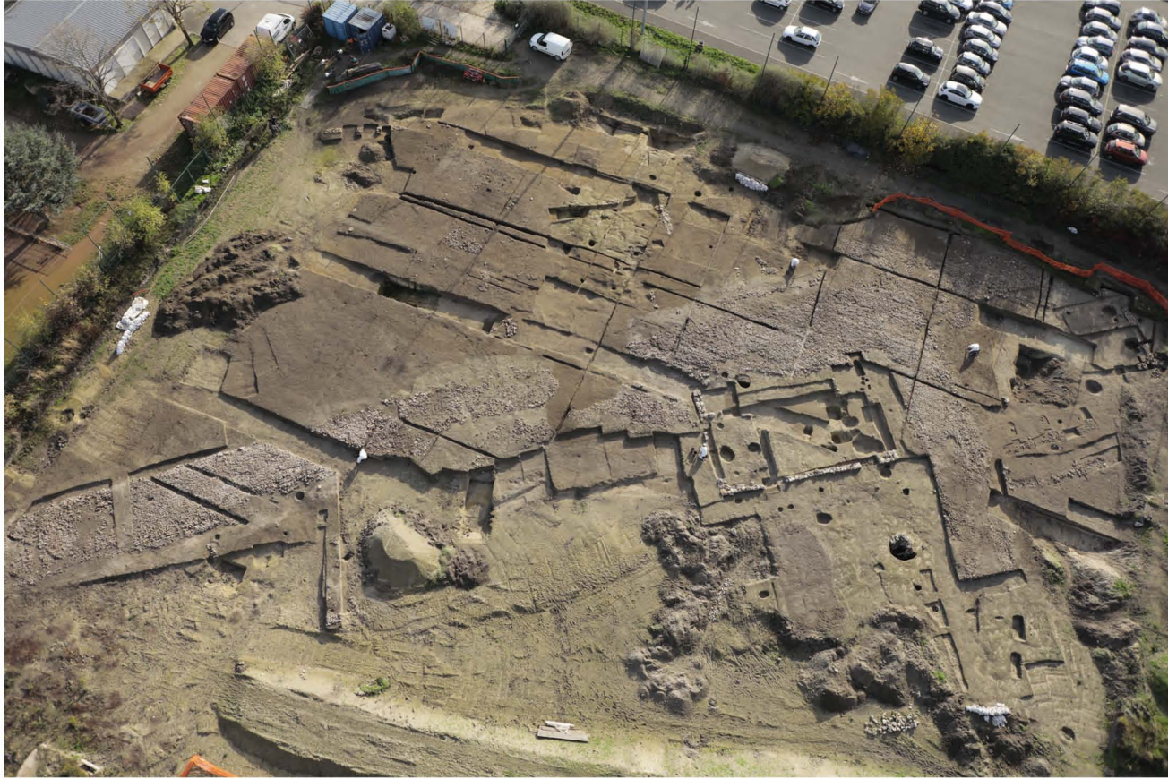
Vue générale de la fouille

La fouille archéologique des terrains 4 et 5 du parc départemental des sports de La Motte sur la commune de Bobigny (Seine-Saint-Denis) a été menée par l'équipe du Bureau du patrimoine archéologique du Département de la Seine-Saint-Denis sous la direction d'Alexandre Michel. Réalisée préalablement à l'aménagement du Prisme, un pôle dédié au handisport, la fouille s'est achevée au printemps 2021.