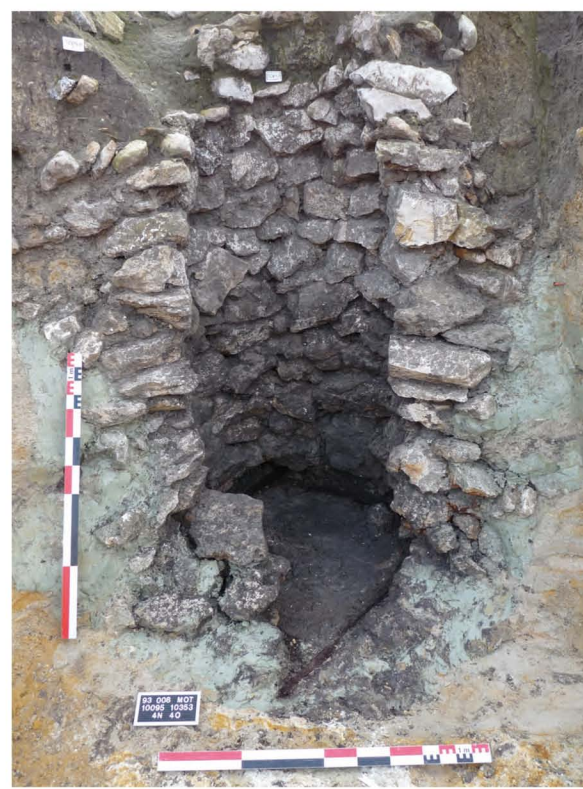
Puits D avec cadre en bois