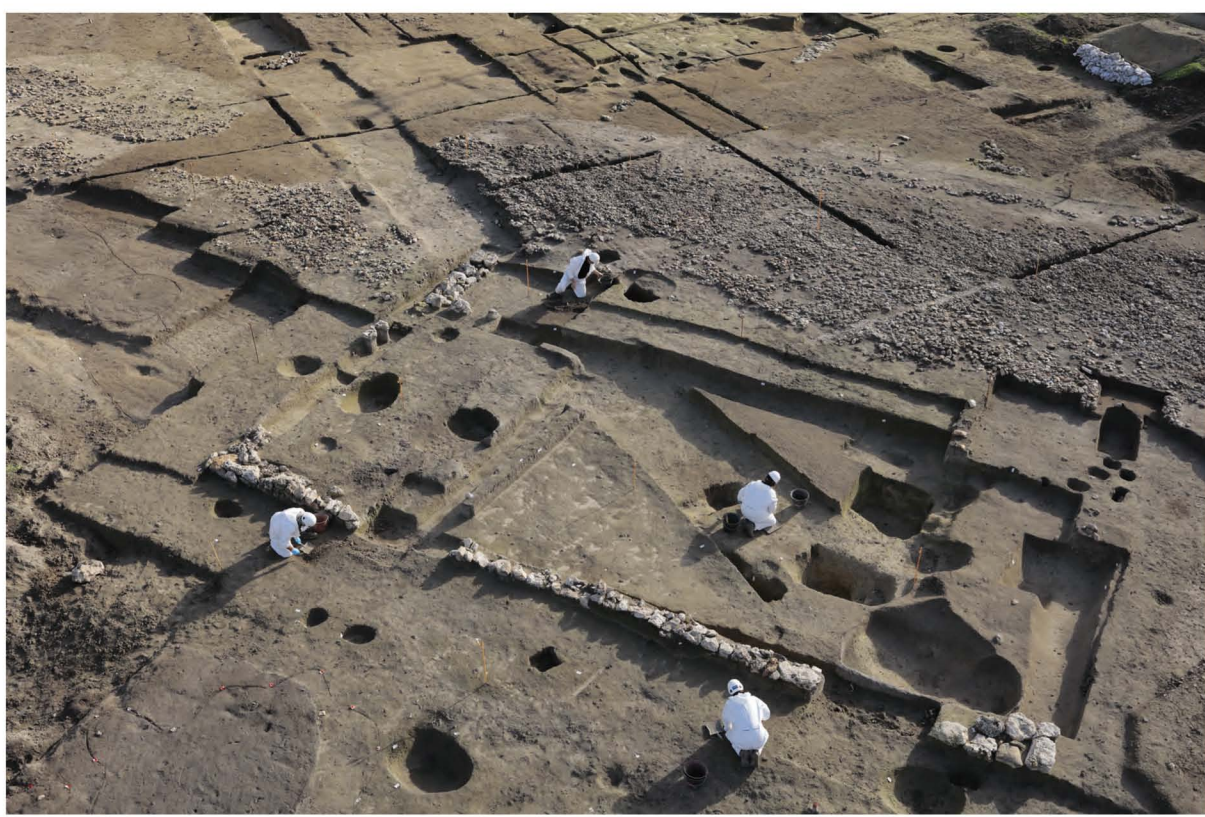
Bâtiment B