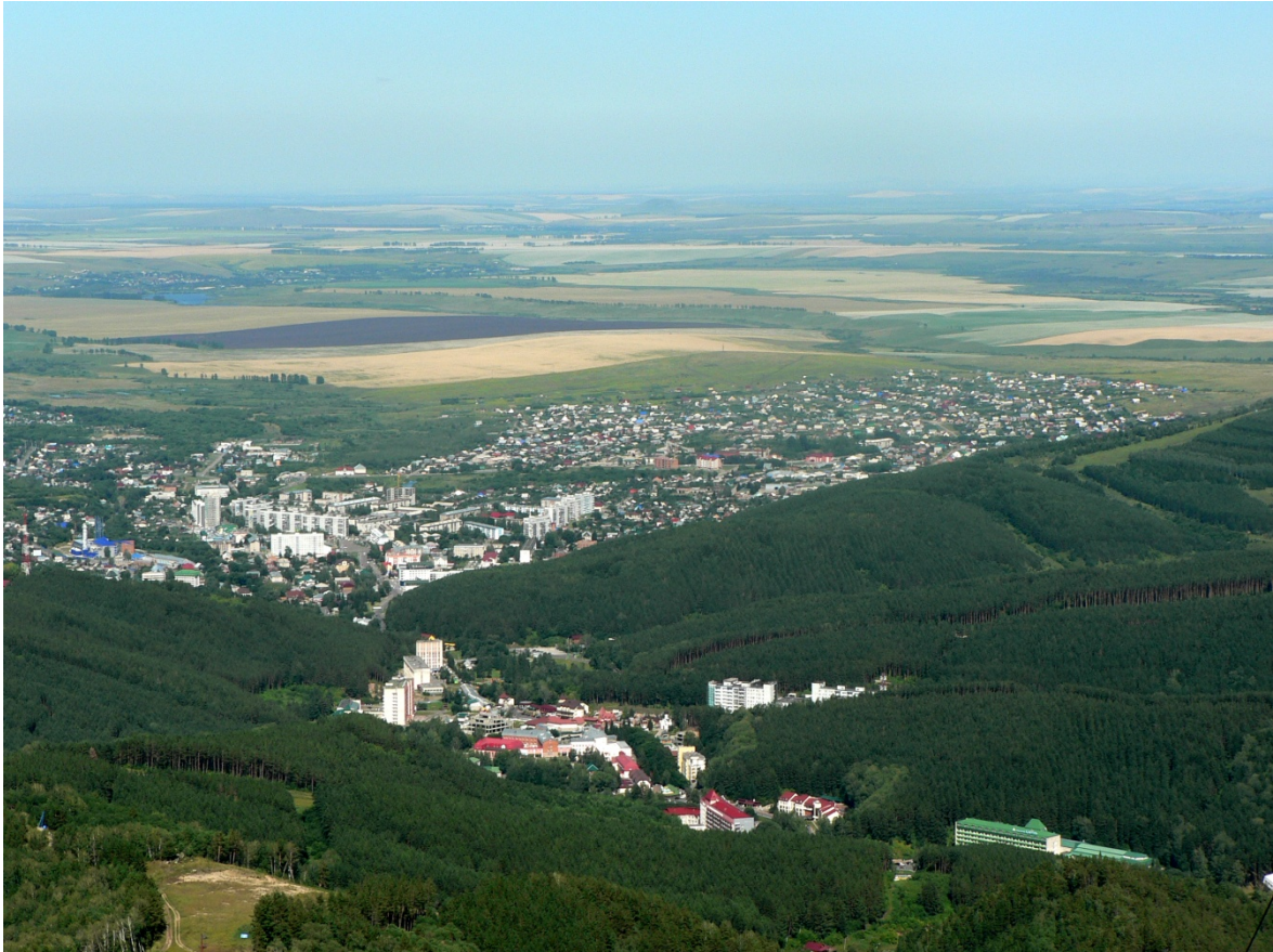
Photo 245 La grande station thermale de l'Altai : Belokurikha Cliché L. Touchart, août 2011

La ville est au contact de l'Altai et du grand plateau de l'Ob. On voit la séparation entre le quartier thermal du premier plan, qui allonge ses établissements de cure dans une étroite vallée de l'Altai, et le reste de la ville qui s'étale sur le plateau au second plan.