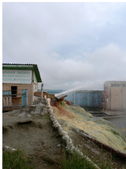
Photo 278 Jemtchoug, une station thermale bouriate à clientèle locale

La grande station thermale de Békourikhïa est devenue une porte d'entrée vers les stations touristiques altaïques de la Katoun Turquoise et du lac Aïa, qui proposent des activités nautiques et sportives, comme, ici, la tyrolienne au-dessus du lac Aïa.