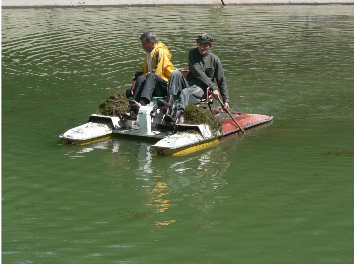
Photo 9 Le faucardage d'un étang urbain à Barnaoul Cliché L. Touchart, juillet 2011

Deux employés municipaux manient la faux à partir d'un pédalo pour faucarder l'étang urbain du parc de la culture et du repos « Octobre » de Barnaoul. Les plantes coupées et remontées sont visibles sur chacun des deux flotteurs.