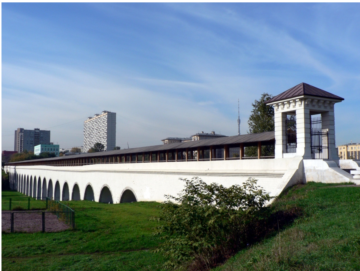
Photo 13 L'aqueduc de Rostokino franchissant la vallée de la Yaouza Cliché L. Touchart, septembre 2010

L'aqueduc de Rostokino fut construit au XVIII ème siècle, sous Catherine II, pour approvisionner Moscou en eau pure à partir de captages situés à l'extérieur de la ville.