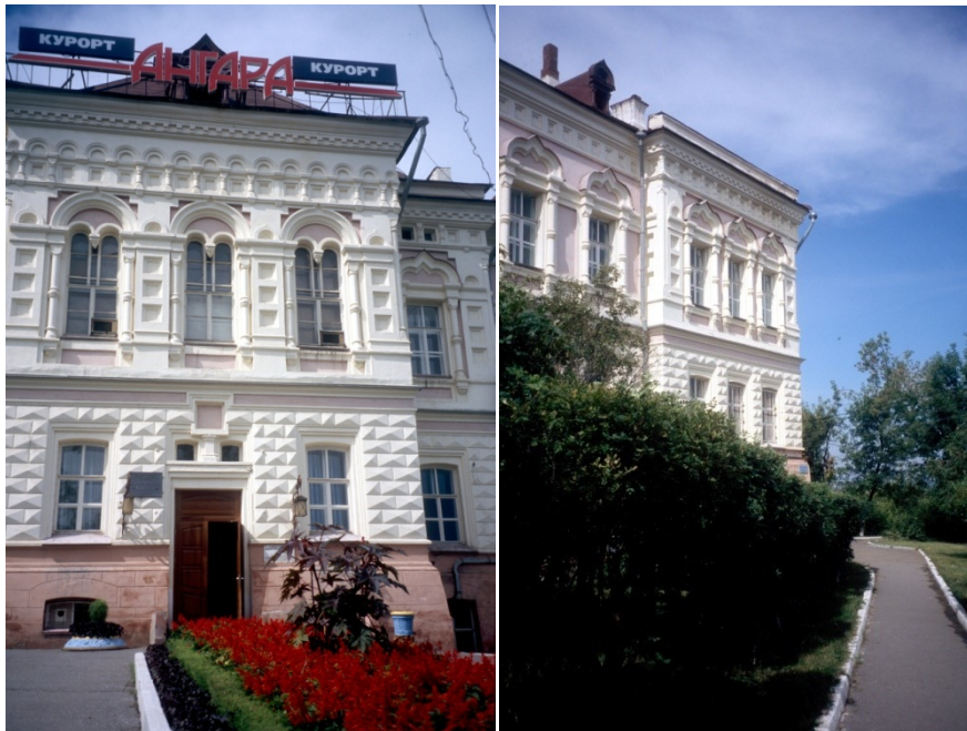
Photos 312 L'établissement thermal « Angara » de la ville d'Irkoutsk, août 2004

Dans la banlieue sud-ouest d'Irkoutsk, la ville de Chélekhov possède le sanatorium Metallurg, au cœur d'une grande pinède. Dans le périmètre de l'établissement de soin et de son parc, plusieurs forages puisent une eau très fortement minéralisée. Le forage numéro 3 retire une eau à 17,8 g/l et le numéro 5 une eau minérale chargée de 42 grammes de substances dissoutes par litre, qu'on n'utilise que dans certains cas très particuliers de traitements médicaux (Špejzer et al. , 2012).