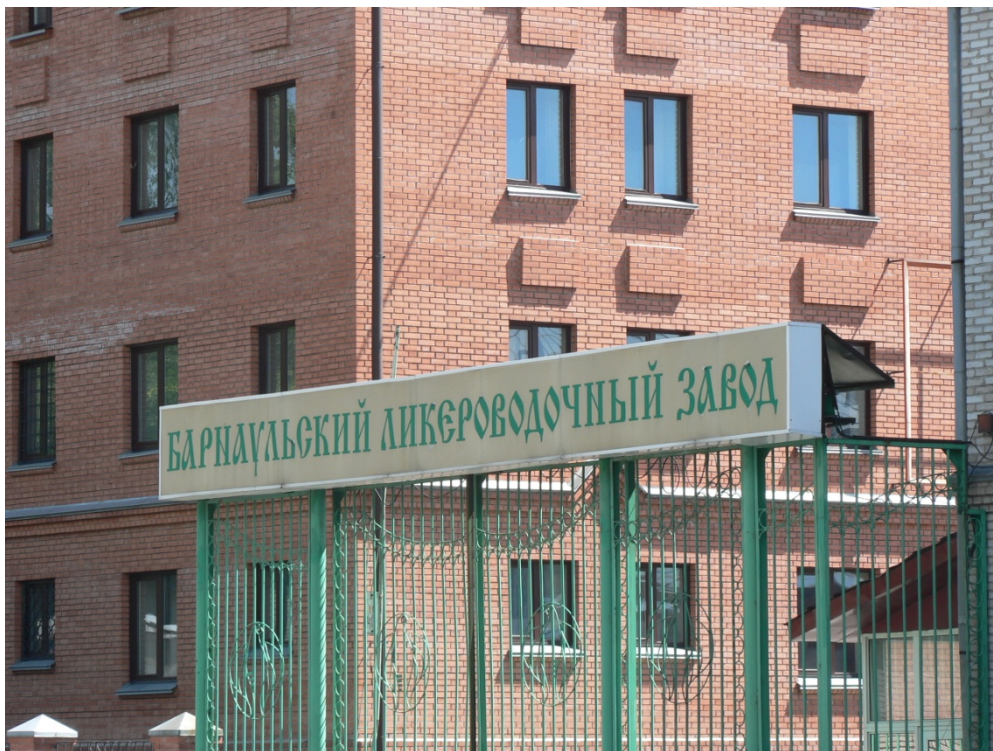
Photo 12 La fabrique de vodka et spiritueux de Barnaoul Cliché L. Touchart, juillet 2011

« Des Bolgars, de confession musulmane, arrivèrent [à Kiev...]. Vladimir [...] les écouta avec délice. Seulement, ce qu'il n'aimait pas, c'était la circoncision, l'abstinence de la viande de porc et surtout de boisson » (Nestor, 1113, p. 109). Cependant, pour des raisons médicales, la question mérite d'être posée. Khvatit choutit ! Il s'agit de présenter le problème de l'eau potable, d'une part celle qui est distribuée dans le réseau d'alimentation, d'autre part celle qui est achetée en bouteille d'eau minérale. Il conviendra d'aborder ce sujet de façon géographique, en privilégiant l'opposition entre ville et campagne pour le réseau de distribution de l'eau du robinet, et l'identité des différentes régions pour les stations thermales.