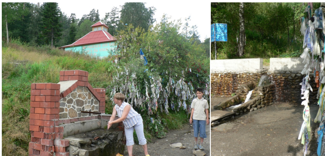
Photos 223 Deux sources sacrées chamanistes de Sibérie

Dans les montagnes du sud de la Sibérie centrale et sur les hauts plateaux de la Sibérie orientale, l'une des manifestations du syncrétisme religieux et culturel réalisé entre la Russie orthodoxe, les populations chamanistes et la Mongolie bouddhiste se trouve être sviatoï istotchnik , la source sacrée 71 . Le caractère sacré est lié aux propriétés thérapeutiques, ou, pour prendre un terme moins médical mais plus proche des soins empiriques mêlés de spiritualité, aux vertus de guérison. Le Russe qualifie alors plus volontiers la source de tsélebny 72 . En langue bouriate, une source sacrée curative s'exprime par un seul et simple mot 73 : archan . Il en existe une multitude de petite taille, ornées et honorées de rubans chamanistes ou d'une chapelle ; plus rares sont celles de grande taille, donnant lieu à l'exploitation par une station de cure et à la mise en bouteille d'eau minérale.