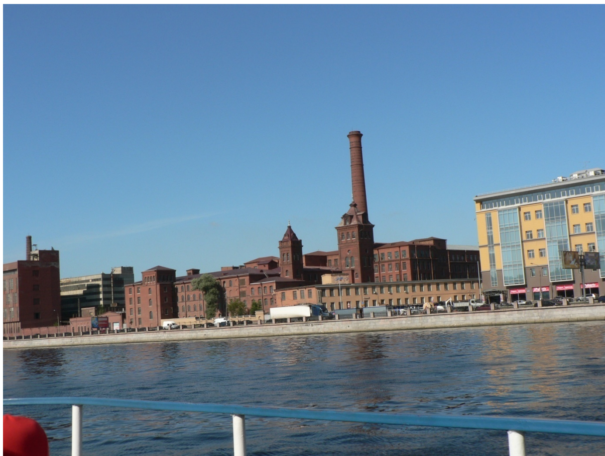
Photo 10 Saint-Petersbourg, le traditionnel point noir de l'épuration des eaux en Russie désormais entièrement équipé Cliché L. Touchart, août 2007

Saint-Petersbourg a longtemps été très en retard sur le reste du pays pour l'équipement en stations d'épuration. Ce n'est que dans les années 2000 que la dernière station moderne a relié 100 % de la population. La photo est prise depuis la Grande Nevka en direction des quartiers industriels de rive droite.