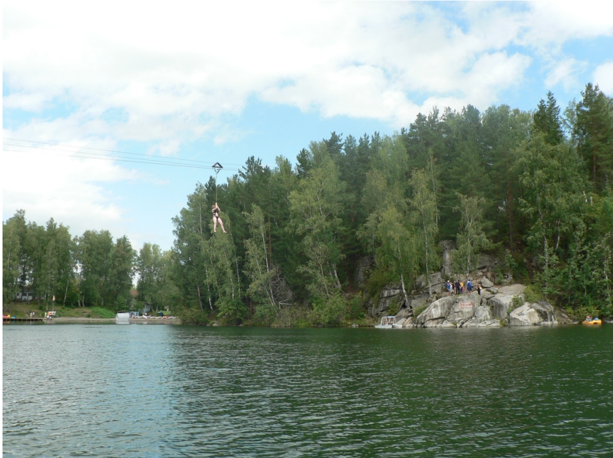
Photo 267 Les liens entre cure et tourisme de niveau national, l'exemple du lac Aïa