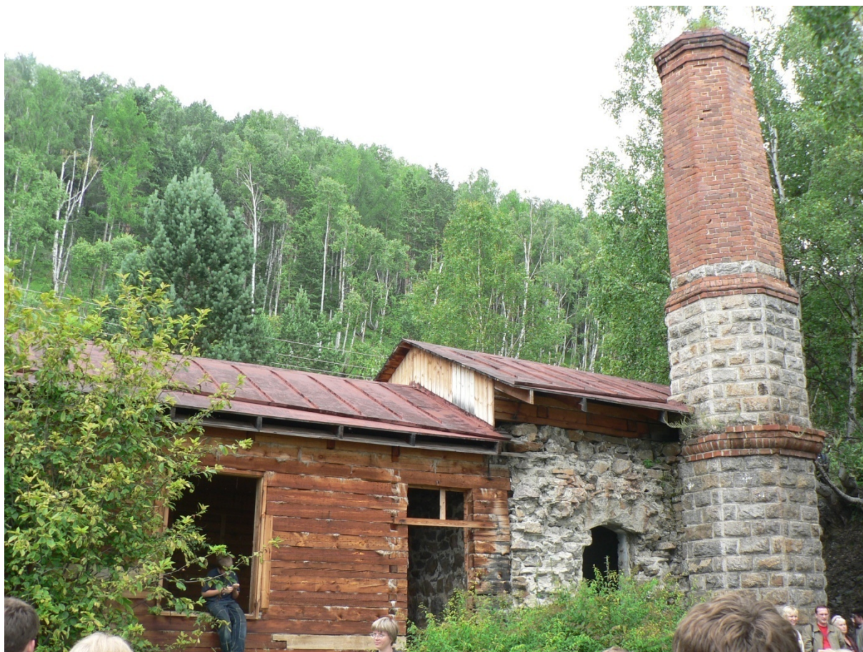
Photo 167 L'ancien réservoir d'eau du Transsibérien dans le village d'Oulanovo

A Moscou comme dans les autres villes, un réseau de conduites et de stations de pompage, les nassosnyé stantsi , transfère ensuite l'eau potable jusque dans des réservoirs, les baki . Certains d'entre eux sont enterrés ou superficiels, d'autres sont perchés et ils forment alors des châteaux d'eau, les vodonapornyé bachni . Comme son nom l'indique clairement en russe 53 , le réservoir surélevé situé au sommet de la tour permet d'alimenter à pression constante les habitats situés en contrebas, selon le principe des vases communicants. Des milliers d'entre eux sont fonctionnels, tandis que d'autres, désaffectés mais préservés en raison de leur beauté ou de leur originalité architecturale, ont été transformés en monuments historiques ou en curiosités touristiques. C'est le cas du musée de l'eau de Saint-Petersbourg, installé dans un ancien château d'eau, comme celui de Kiev.