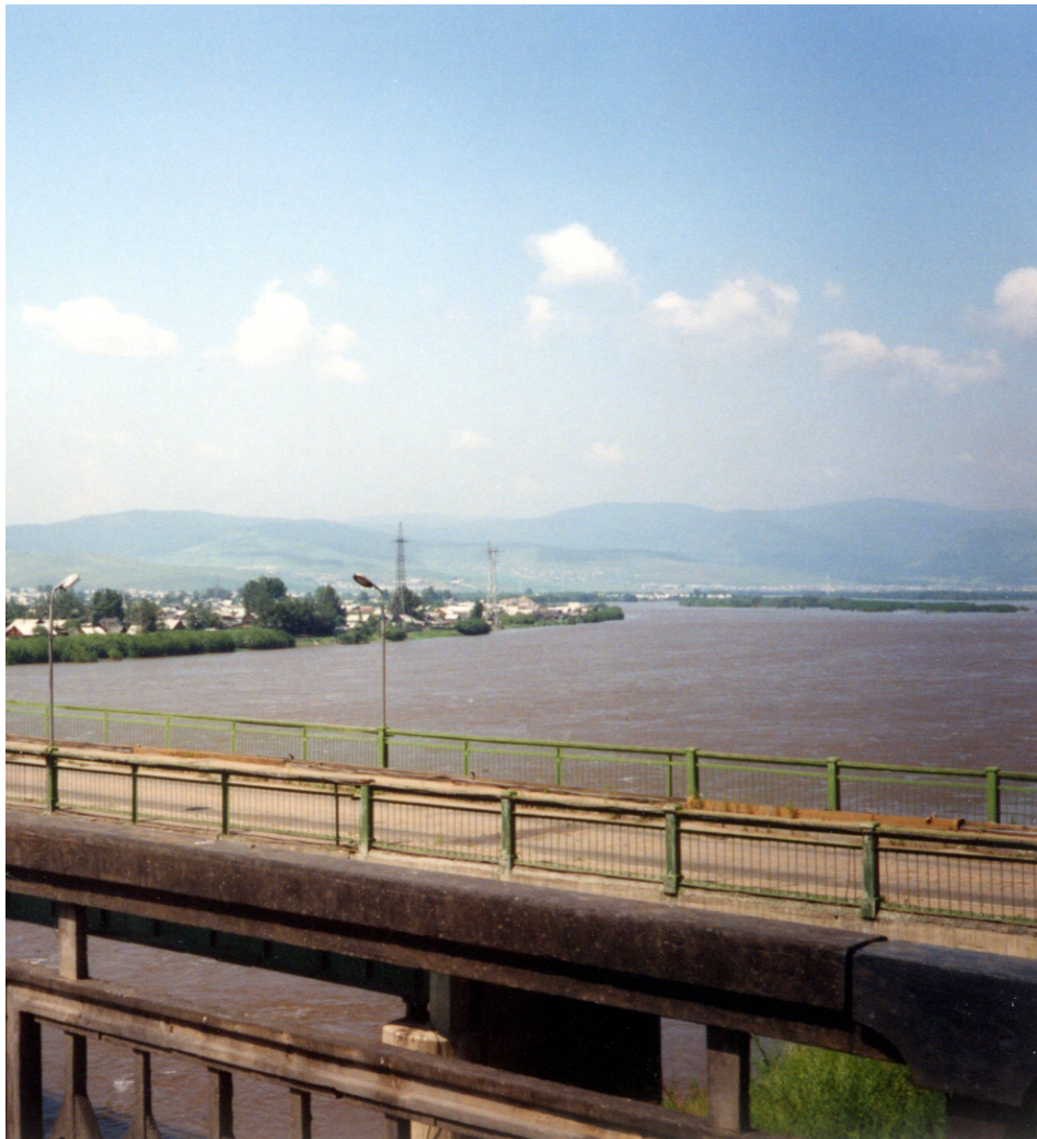
Photo 6 La pollution chimique au nickel, l'exemple de la rivière Sélega Cliché L. Touchart, juillet 1991

Du fait, notamment, de la concentration très ancienne des industries métallurgiques, « l'Oural est le leader incontestable des territoires russes en termes de pollution de l'environnement » (Rakovskaja et Davydova, 2003, p. 64, en russe). Les cours d'eau concernés sont les affluents de rive gauche du Tobol et le fleuve Oural lui-même. En Sibérie, les points noirs sont plus localisés, mais les réseaux hydrographiques sont tous concernés en aval des grandes villes industrielles. A titre d'exemple, au milieu des années 1990, les concentrations en nickel de la Sélega passaient de 5,6 micro-grammes par litre en amont d'Oulan-Oudé à 9,4 en aval (Kašin et Ivanov, 1997).