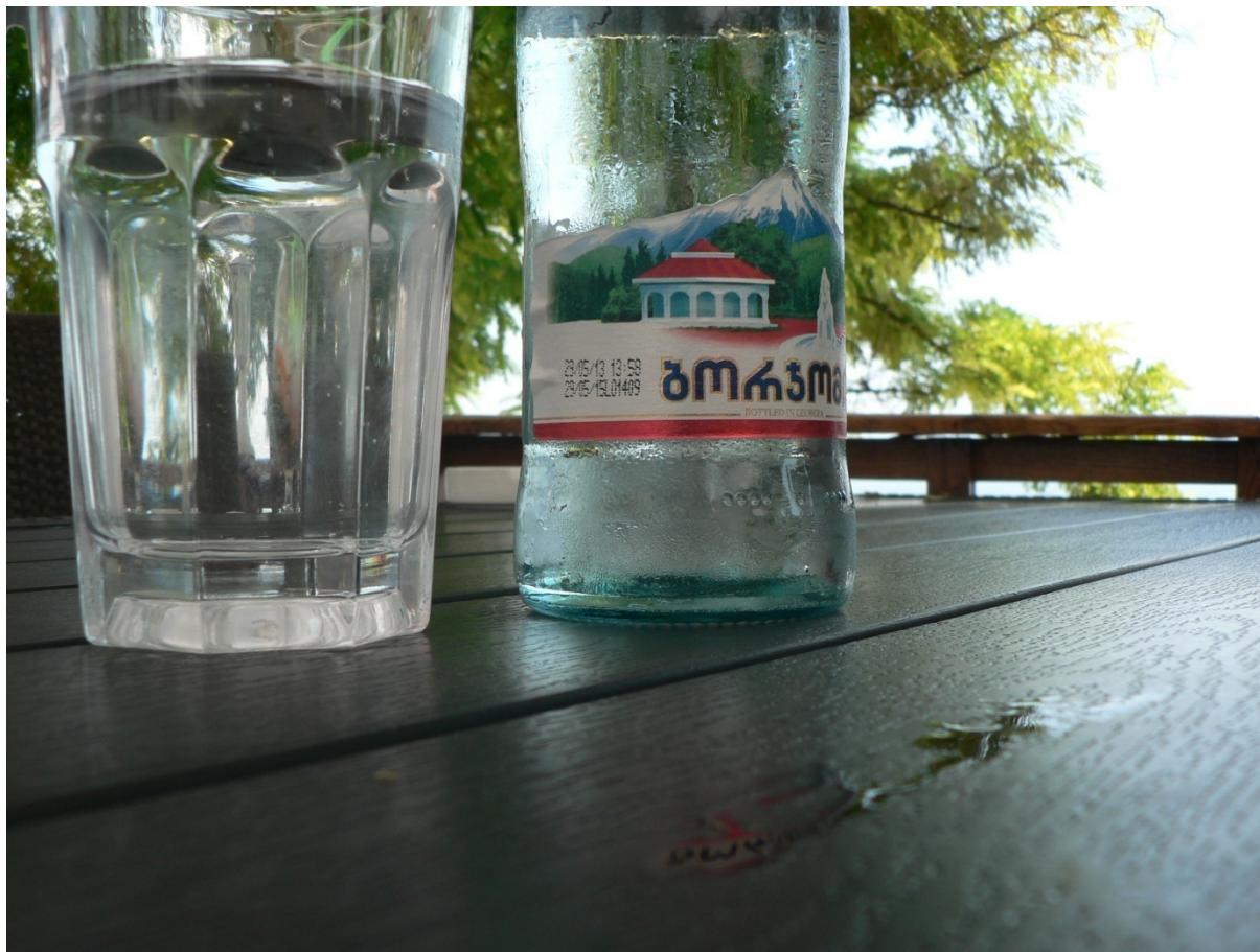
Photo 190 L'eau la plus fameuse du Caucase, la Borjomi Cliché L. Touchart, juillet 2013

chimique des différentes sources permet de préconiser leur utilisation dans une large gamme thérapeutique (Smirnov-Kamenskij et Pavlov, 1987), en fonction de leur plus ou moins grande teneur en fer, soufre, sodium, magnésium, brome, iode, sulfate, etc. 61 (François, 1876). Sur le plan physique, différentes températures existent et certaines d'entre elles sont naturellement fortement gazeuses, comme la Narzan 62 (Dru, 1884), sans doute la plus célèbre des eaux minérales russes depuis que, en 1991, la Borjomi est devenue géorgienne.