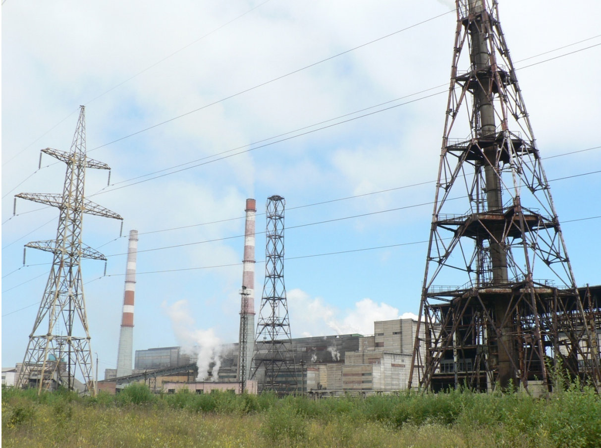
Photo 5 Le secteur de la cellulose et pâte à papier et la pollution organique des eaux russes Cliché L. Touchart, août 2006

Le troisième type de pollution organique, celle due aux résidus organiques de synthèse, est la plus préoccupante en Russie. Dans la moitié sud, elle est due aux résidus des produits phytosanitaires des grandes régions de culture. Dans la moitié nord du pays, ce type de pollution est plutôt dû aux fabriques de pâte à papier et cellulose. A l'échelle de l'ensemble de la Russie, S.G. Tchijov (2008) note que le domaine de la pâte à papier et cellulose reste encore celui qui déverse, en nombre de mètres cubes, les plus gros volumes d'eaux polluées de tous les secteurs industriels. A moyenne échelle, en Sibirie orientale, ce secteur représentait 39,8 % des eaux usées rejetées dans l'Angara en 1988, devant le secteur des industries pétrochimiques et chimiques, celui de la métallurgie et les autres (Bezrukov et Smarga 1990). A grande échelle cartographique, les lecteurs qui souhaiteraient approfondir un exemple plus précis en langue française peuvent se reporter à notre étude détaillée des rejets du Combinat de papier et cellulose de Baïkalsk (Touchart, 1998, pp. 95 et sq.).