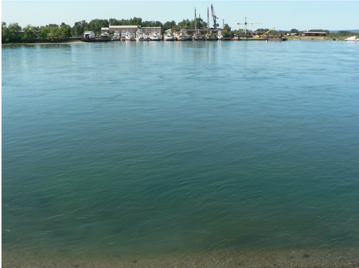
Photo 7 L'Angara et les menaces de pollution à l'arsenic Cliché L. Touchart, août 2010

Le site de Svirsk, dans la banlieue nord d'Irkoutsk, menaçait l'Angara de pollution à l'arsenic. Il a été liquidé en 2012 et 2013. La photo est prise quelques kilomètres en amont, au niveau des installations portuaires.