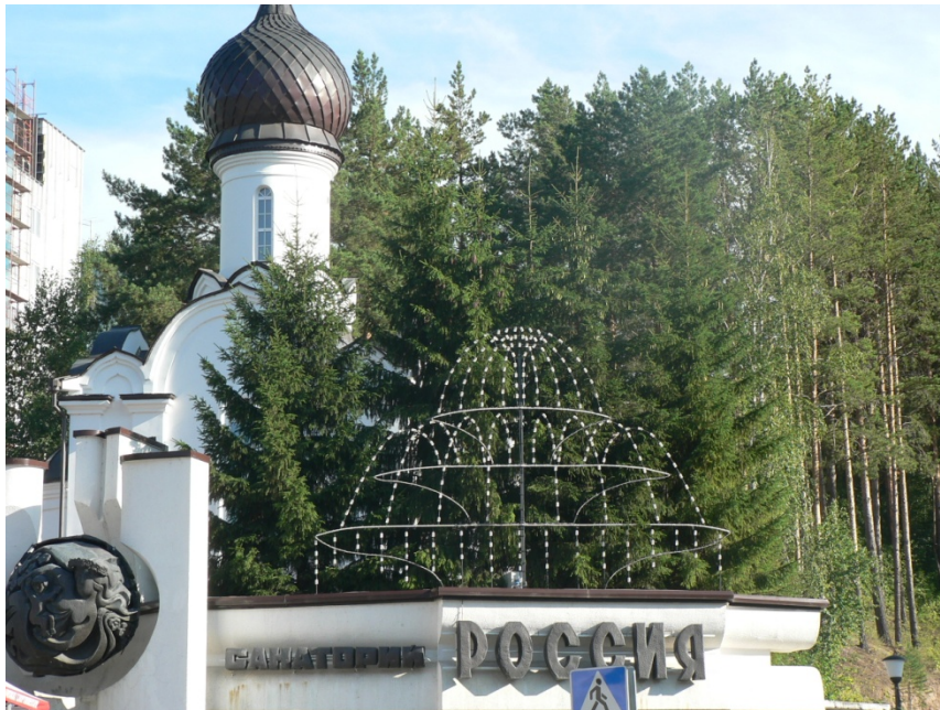
Photo 256 Le sanatorium « Russie » dans la station thermale de Belokurikha Cliché L. Touchart, août 2011

La ville est au contact de l'Altai et du grand plateau de l'Ob. On voit la séparation entre le quartier thermal du premier plan, qui allonge ses établissements de cure dans une étroite vallée de l'Altai, et le reste de la ville qui s'étale sur le plateau au second plan.