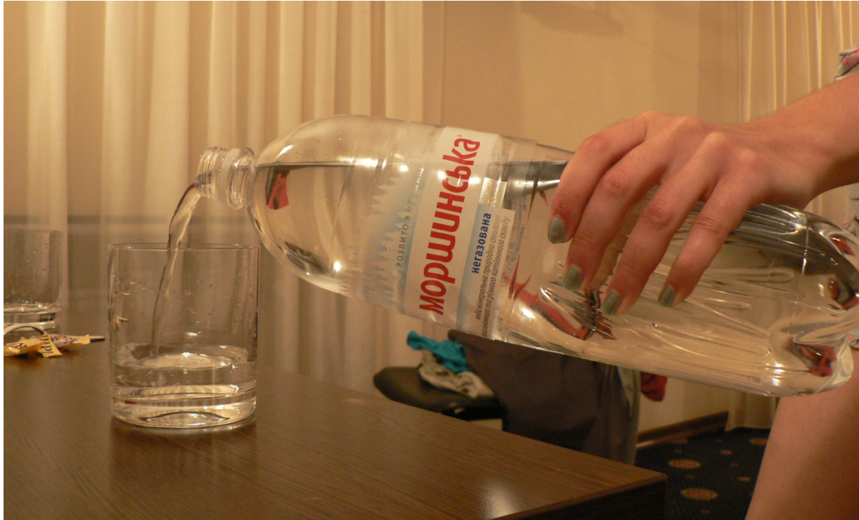
Photo 189 La géographie des eaux minérales russes, un maillage hérité Cliché L. Touchart, juillet 2013

l'aménagement du territoire, leur fréquentation touristique. L'importance sociale et économique du réseau de stations de cure 57 et d'établissements thermaux 58 à l'époque soviétique (Poltoranov et Sluckij, 1986, Kozlov, 1987) était proportionnellement beaucoup plus grande qu'en Occident, si bien que, malgré un déclin notable depuis vingt ans, il subsiste dans les esprits et dans la réalité du maillage régional un fort intérêt pour la question.