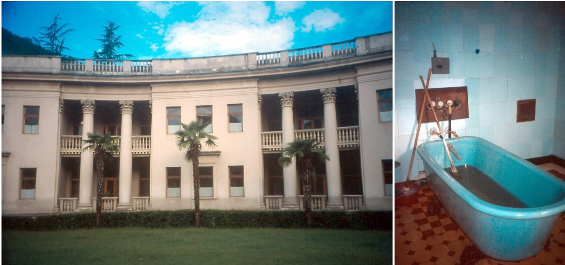
Photos 212 L'établissement thermal de Matsesta et les difficultés de la période de transition

source profonde 67 (Martel, 1911). Mais, en fait, malgré les missions préliminaires et la construction de trois baraquements sommaires en 1902, puis d'un petit hôtel en 1912, le gouvernement tsariste n'eut pas le temps de mettre le site en valeur, se concentrant sur les KMV.