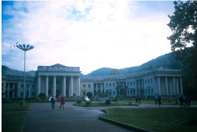
Photo 201 L'eau de Matsesta et le rôle du géographe-géologue français Edouard Martel Cliché L. Touchart, octobre 2003

A l'intérieur de la conurbation, Kislovodsk, autour de la fameuse « source du Géant » (Dru, 1884, p. 90), la Narzan, reste la destination la plus courue et celle aux capacités d'accueil les plus développées 65 (Radvanyi et Thorez, 1976). Cependant, comme ses voisines, Kislovodsk a connu une forte baisse de la clientèle à la chute de l'URSS, qui n'est pas compensée par l'appel aux étrangers 66 (Thorez, 2007).