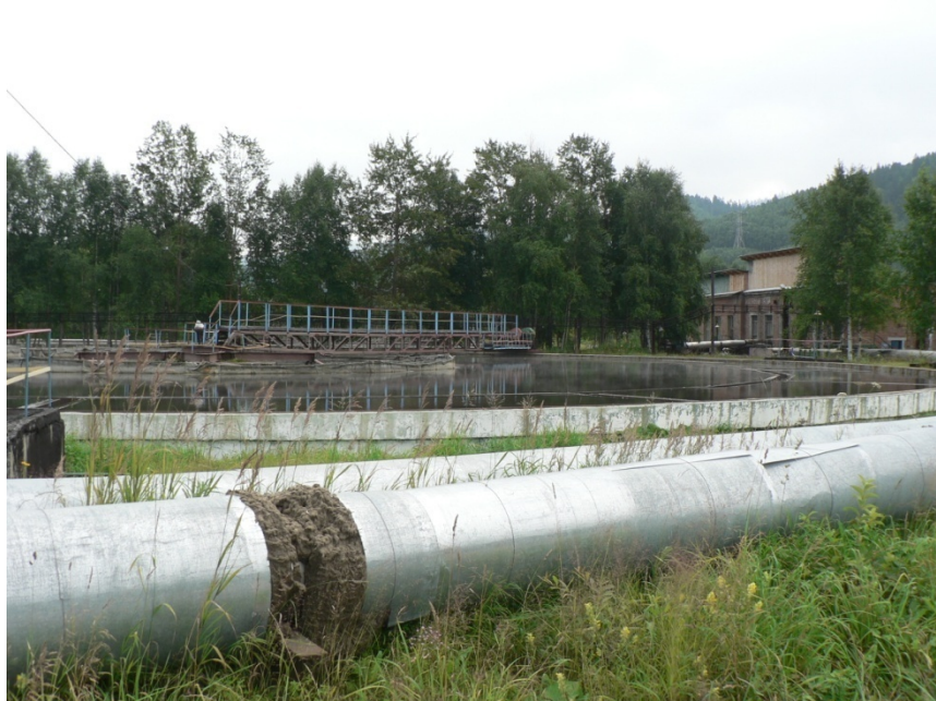
Photo 11 Un secteur industriel traditionnellement mieux équipé en stations d'épuration que le secteur domestique, l'exemple du combinat de Baïkalsk

C'est dans le secteur industriel que la Russie a la plus longue expérience de systèmes performants d'épuration des eaux. Il est vrai que ce domaine était privilégié à l'époque soviétique, aux dépens du secteur domestique (Radvanyi, 2007) 43 . La systématisation des stations épurant les eaux des entreprises industrielles s'accompagna dans les années 1970 et 1980 de la construction de nombreux circuits d'eau fermés, la zamknoutaïa sistema vodosnabžénia , permettant aux usines grosses consommatrices de réutiliser les eaux usées.