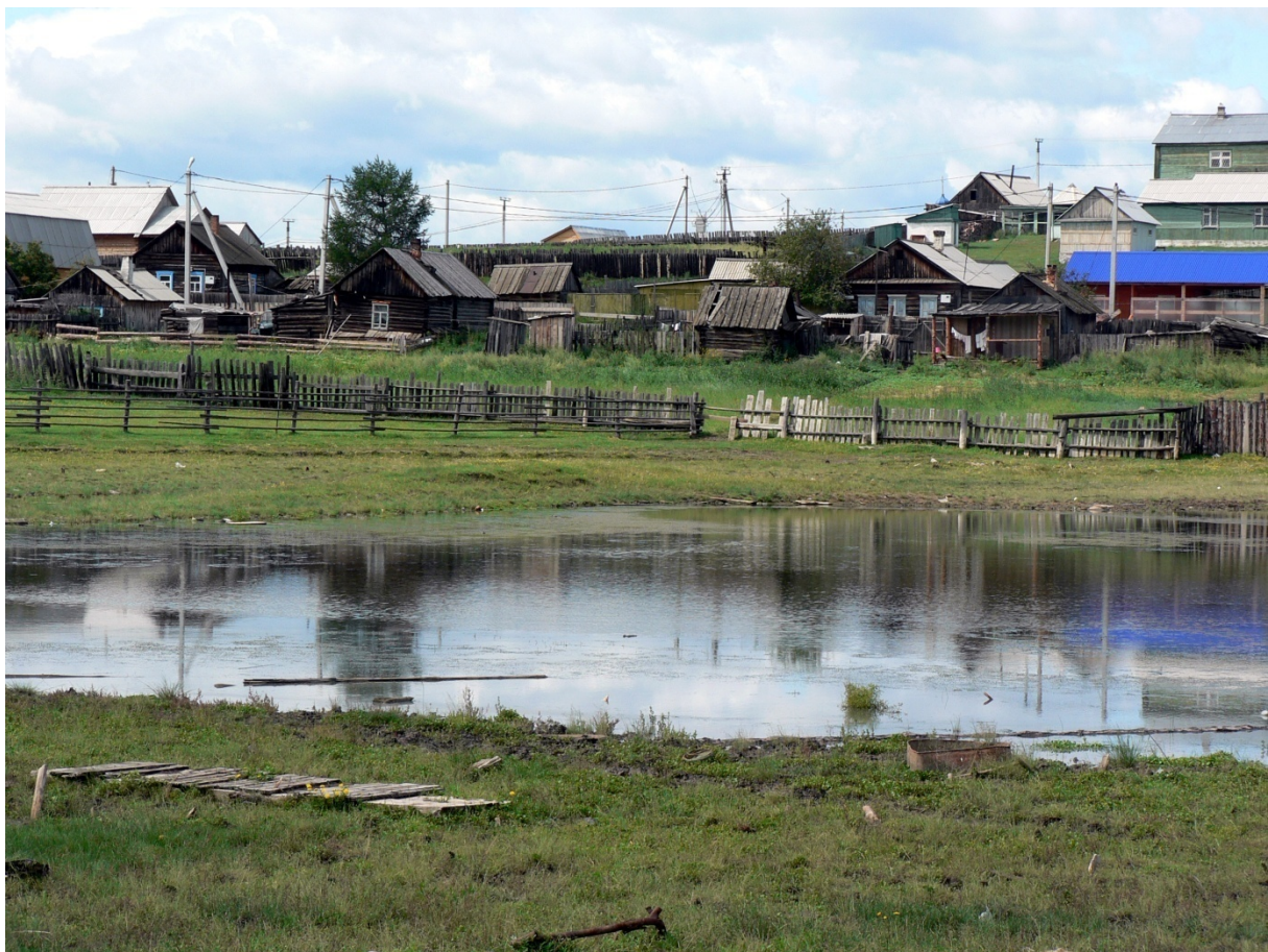
Photo 3 Les rejets domestiques et la pollution organique

La dégradation des eaux la plus répandue du territoire russe est la pollution organique ( organitcheskoïé zagriaznénié ), qui rassemble toutes les souillures dues aux déversements de substances issues de tissus vivants, anciens ou actuels, c'est-à-dire de composés du carbone. Sa répartition géographique épouse en grande partie la distinction entre les effluents chargés de matières fermentescibles 7 , ceux d'hydrocarbures et ceux souillés de résidus organiques de synthèse.