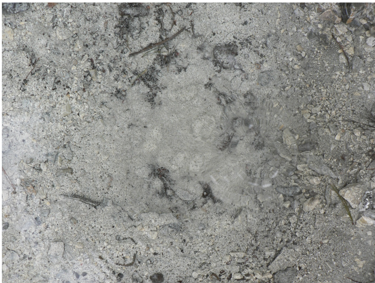
Photo 289 Une source affleurante non captée à Archan Cliché L. Touchart, août 2005

Il en va tout autrement d'Archan 74 (Bulgatov, 1959, Botoroev et Minkoev, 1980, Botoroev, 2002), où les sources sacrées de guérison sont si importantes que le nom commun est devenu le toponyme. A la suite de l'expédition scientifique de 1894, la revue de l'Université de Tomsk publia en 1896 un tout premier article décrivant les sources et estimant leur débit. Deux d'entre elles étaient captées par des cylindres de bois rudimentaires, pour la consommation locale. La composition de l'eau fut précisée en 1909 par les travaux du géologue Alexandre Lvov, financés par la Société de Géographie. On sait que les eaux d'Archan sont froides pour certaines d'entre elles et thermales pour d'autres, la gamme des températures allant de 11° à 45°C. Il s'agit d'eaux fortement gazeuses, dont la minéralisation varie entre 2,4 à 5,5 g/l.