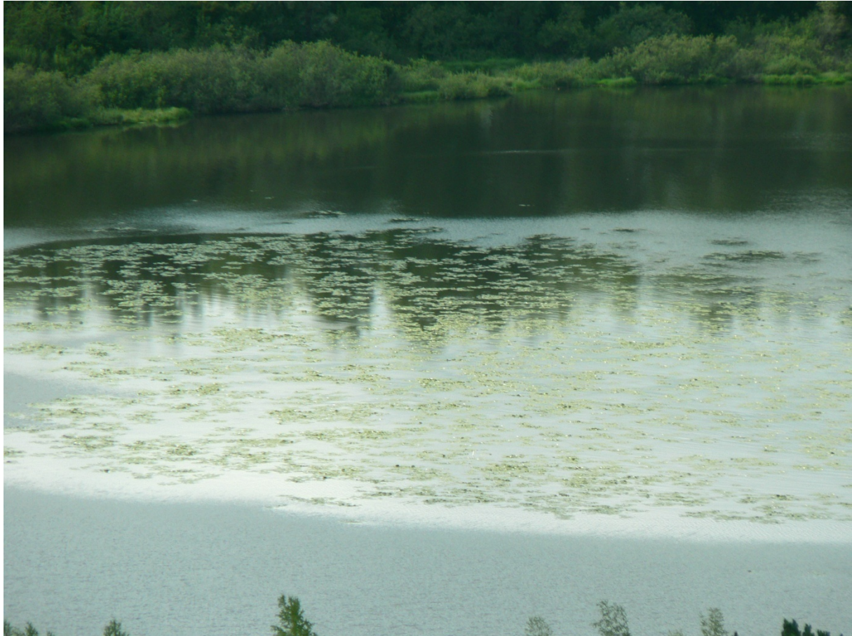
Photo 8 L'eutrophisation du lac Manjérok

cette fleur d'eau ( tsvéténié vody ), qui représente un stade avancé de l'eutrophisation, a même touché, avant la prise de mesures adéquates, certains grands lacs comme le Ladoga. L'autre manifestation visuelle de l'eutrophisation se trouve être zarastanié , c'est-à-dire l'invasion macrophytique. De nombreux lacs naturels peu profonds de Russie d'Europe sont en effet envahis par les plantes. Les Russes appellent ce type de lac ilmen .