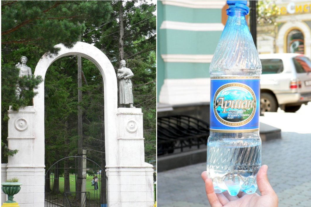
Photos 290 Archan, la station de cure des années 1920 de la Sibérie orientale Clichés L. Touchart, août 2005

À gauche, l'entrée de l'un des deux établissements d'Archan, dont l'architecture forme un patrimoine caractéristique ; à droite une bouteille actuelle de l'eau minérale d'Archan, issue de l'usine ouverte en 1951.