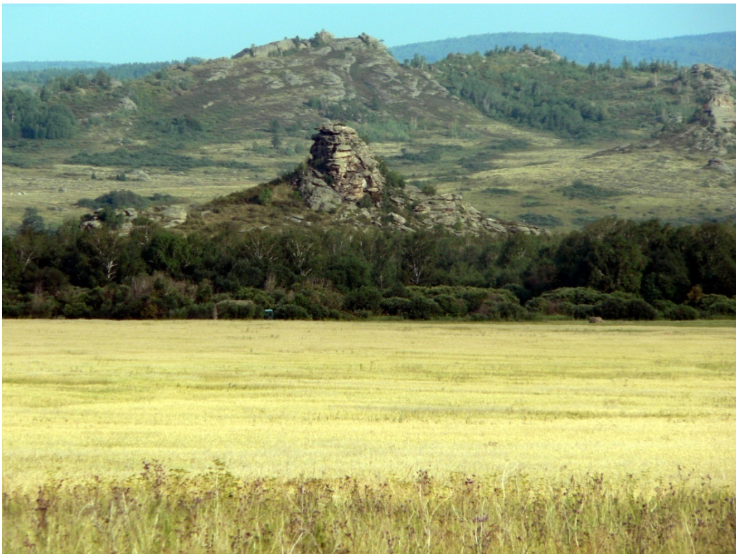
Photo 4 Les grandes cultures en zone de steppe et la pollution en produits phytosanitaires

Le deuxième type de pollution organique est celle due aux hydrocarbures. C'est l'une des plus ubiquistes et, du fait de la mécanisation de l'agriculture, elle touche même les cours d'eau des régions rurales, comme cela a été étudié, près de la frontière ukrainienne, dans la Desna (Pirogov, 2005). Une hiérarchie géographique des territoires peut cependant être tentée. Elle concerne d'une part toutes les grandes agglomérations urbaines, à cause de la circulation automobile, d'autre part les régions d'extraction des hydrocarbures. En Europe, la Volga et son grand affluent, la Kama, sont fortement touchées. En termes de concentrations, les valeurs parmi les plus mauvaises du pays sont traditionnellement mesurées dans le grand affluent de rive gauche de la Kama, la Bélaïa, en aval d'Oufa (Ratkovič, 2003). En Sibérie, où la dégradation des hydrocarbures par auto-épuration se fait mal, car l'eau est trop froide (Mote, 1983), c'est l'Ob qui souffre le plus de la pollution. « Les quantités maximales de produits pétroliers se retrouvant dans l'Ob s'observent dans son cours moyen, là où le fleuve reçoit les eaux polluées de ses affluents traversant les régions pétrolifères » (Brusnina, 1989, p. 29, en russe).