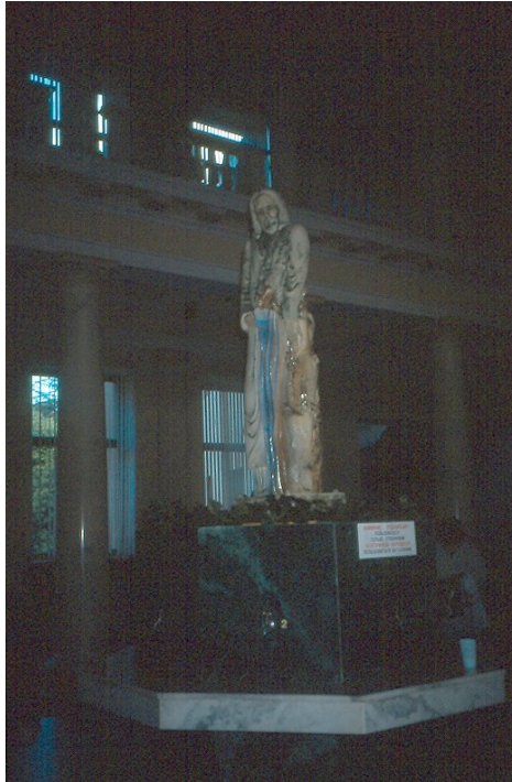
Photo 178 La valeur thérapeutique des eaux minérales russes et Saint-Pantaléon le Guérisseur Cliché L. Touchart, octobre 2003

La définition russe de l'eau minérale est proche de celle donnée en France. Le maître mot se trouve être sa valeur « letchebnaïa », thérapeutique 54 (Kurašov et al. , 1951, Poltoranov et Mazur, 1969, Zaripova et al. , 1996, Skurihina, 2004, Bartanjan, 2007, Špejzer et al. 2012, Nikolaeva, 2012).