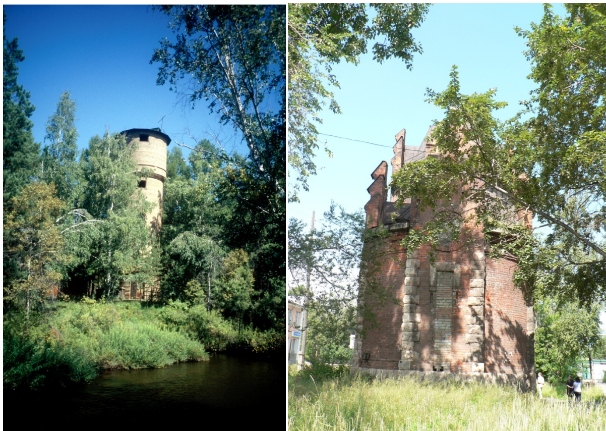
Photos 14 Les châteaux d'eau de petites villes sibériennes Clichés L. Touchart, août 2004, août 2006

A gauche, le château d'eau de la localité d'Olkha, dans la banlieue sud-ouest d'Irkoutsk, fonctionnel, montre sa forme de vodoprovodnaïa bachnia ; à droite celui de la rue Soviétique de la ville de Slioudianka, sur la rive sud du Baïkal, est désaffecté, mais gardé comme monument architectural.