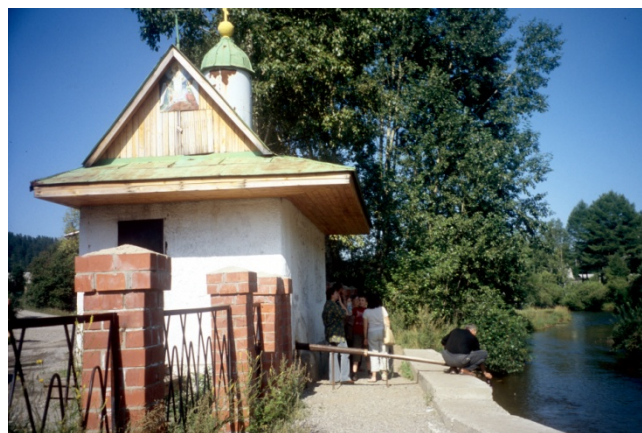
Photo 301 La source sacrée orthodoxe d'Olkha Cliché L. Touchart, août 2004

A l'est et au nord de la Bouriatie, l'oblast d'Irkoutsk compte à elle seule 39 établissements de cure (Špejzer et al. , 2012). Les plus importants se trouvent dans la conurbation elle-même de Chélekhov-Irkoutsk-Angarsk-Oussolié-Sibirskoé. Le point majeur se trouve être, au sud-sud-ouest de Chélekhov, la source d'Olkha. Le forage actuel date de 1968, qui puise l'eau à 352 m de profondeur, dans la série Oussolko-belskaïa du Cambrien inférieur. Ce sont des eaux dont la minéralisation est comprise entre 2,2 et 2,8 g/l et le pH entre 7,3 et 7,6. Leur composition hydrocarbonatée sulfatée chlorée leur donne une valeur thérapeutique garantie par l'Institut scientifique des cures et de la physiothérapie de Tomsk (Špejzer et al. , 2012). Il s'agit d'une source sacrée, sviatoï istotchnik , bénie chaque année à Pâques. Sur place, une tchassovnia , une chapelle, matérialise la fontaine, à l'endroit où l'on peut se servir librement. Mais l'usine d'embouteillage se trouve dans la ville d'Irkoutsk.