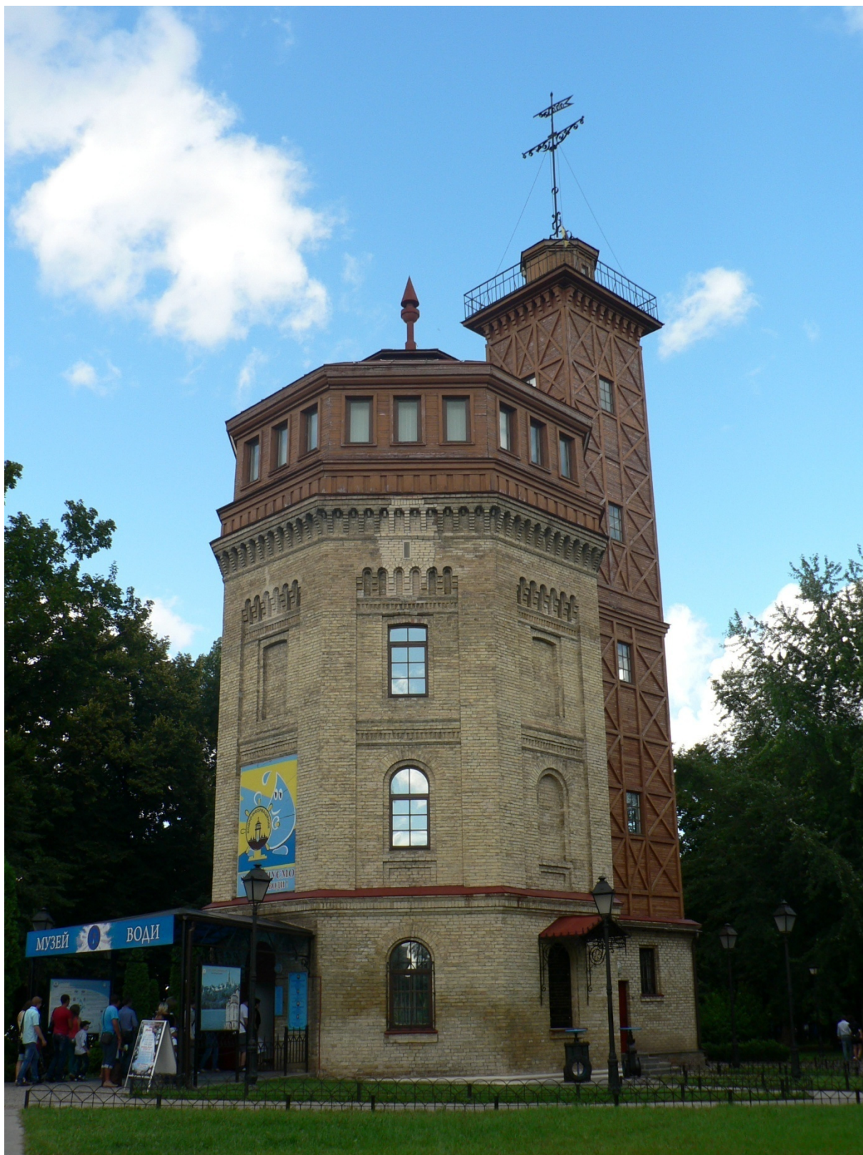
Photo 156 L'ancien château d'eau de Kjev, transformé en musée de l'eau Cliché L. Touchart, juillet 2013

Datant des années 1870, l'ancien château de Kjev se trouve de façon caractéristique en situation haute, dominant le centre-ville pour alimenter les habitations à pression constante. Il est aujourd'hui transformé en musée de l'eau.