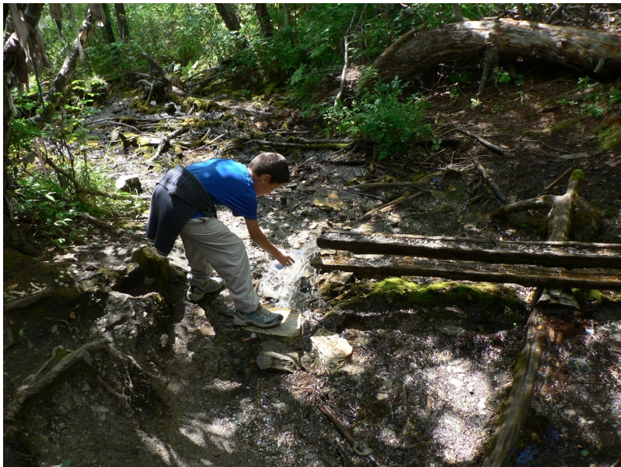
Photo 234 Une source sacrée argentifère des monts Primorskj Cliché L. Touchart, août 2005

bains furent installées en 1867, puis des marchands de la grande ville de Biïsk, située à seulement 70 km de là, y construisirent un hôtel dans les années 1892. Les premiers sanatoriums et polycliniques furent installés à partir des années 1920, mais le premier grand forage profond date de 1952 (Prošunin et Benin, 1977, Ostanov A.D., 1978, Kaznačeev et Černjavskij, 2011). Depuis les années 2000, Béloukourikha est l'un des points d'entrée vers les nouvelles bases touristiques situées plus à l'intérieur de l'Altai, comme la Katoun Turquoise, promues au rang d'importance fédérale par Vladimir Poutine (comm. or. Irina Rotanova, Académie des Sciences de Barnaoul, août 2011).