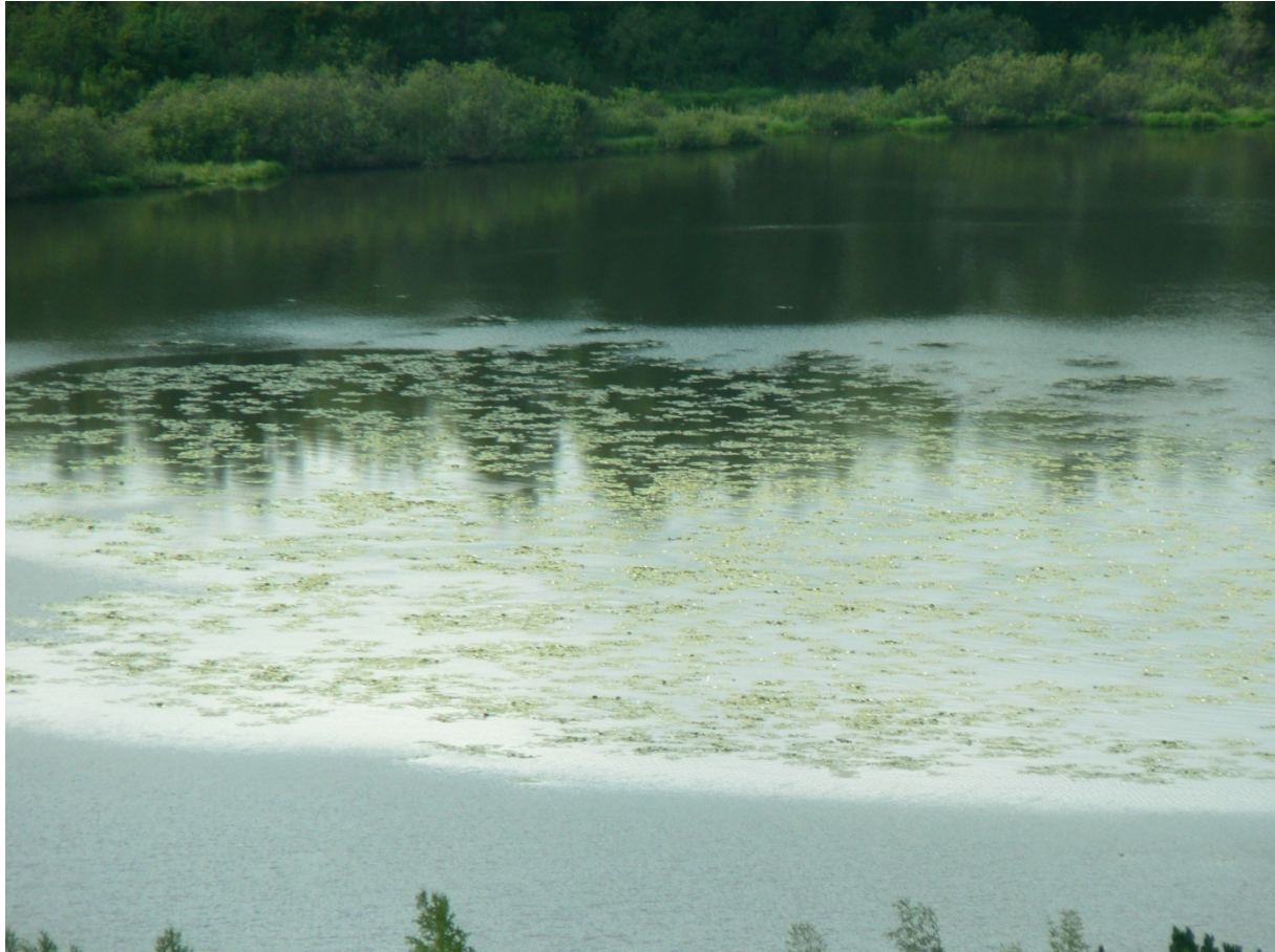
Photo 8 L'eutrophisation du lac Manjéroĸ

cette fleur d'eau ( tsvéténié vody ), qui représente un stade avancé de l'eutrophisation, a même touché, avant la prise de mesures adéquates, certains grands lacs comme le Ladoga. L'autre manifestation visuelle de l'eutrophisation se trouve être zarastanié , c'est-à-dire l'invasion macrophytique. De nombreux lacs naturels peu profonds de Russie d'Europe sont en effet envahis par les plantes. Les Russes appellent ce type de lac ilmen .