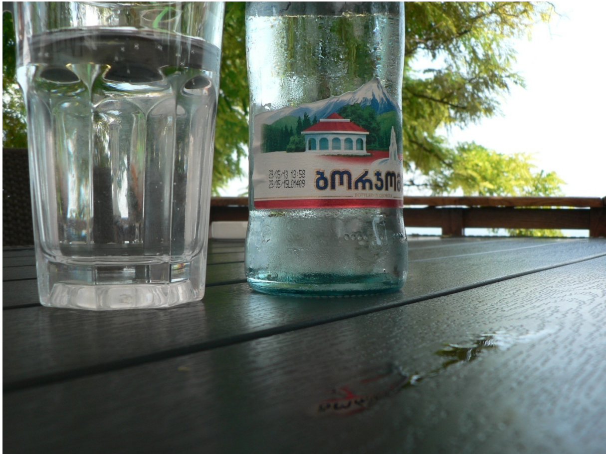
Photo 190 L'eau la plus fameuse du Caucase, la Borjomi Cliché L. Touchart, juillet 2013

chimique des différentes sources permet de préconiser leur utilisation dans une large gamme thérapeutique (Smirnov-Kamenskij et Pavlov, 1987), en fonction de leur plus ou moins grande teneur en fer, soufre, sodium, magnésium, brome, iode, sulfate, etc. 61 (François, 1876). Sur le plan physique, différentes températures existent et certaines d'entre elles sont naturellement fortement gazeuses, comme la Narzan 62 (Dru, 1884), sans doute la plus célèbre des eaux minérales russes depuis que, en 1991, la Borjomi est devenue géorgienne.