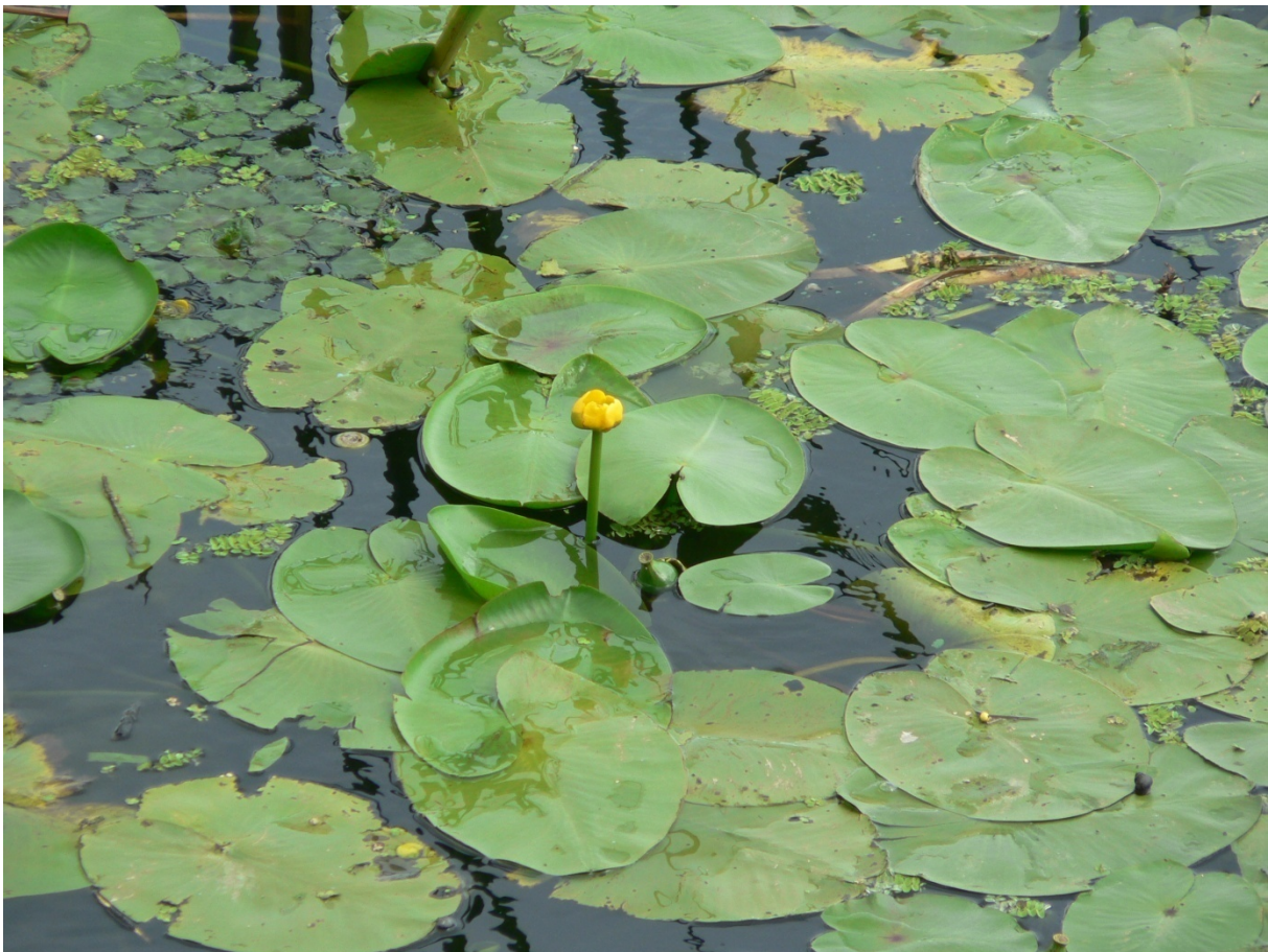
Photo 2 L'eutrophisation du Dniepr

Comme tous les pays industriels, la Russie souffre d'une dégradation de la qualité de ses eaux de surface, que ce soit par zagriaznéié , une pollution stricto sensu due au déversement d'éléments toxiques, ou par èvtrofikatsia , une eutrophisation provoquée par un surenrichissement en éléments nutritifs. Il convient de garder ici une démarche géographique, qui s'appuie sur au moins deux échelles cartographiques, d'une part le caractère ponctuel ou diffus de ces souillures sur l'ensemble du territoire, d'autre part la mise en avant des principales régions touchées. Une troisième échelle d'étude est-elle envisageable, en prenant en compte l'évolution d'un même réseau hydrographique ? Celle-ci est-elle due à la localisation des rejets d'eaux usées à l'intérieur du bassin et le long du tronc principal ou bien au fait même d'un cumul d'amont en aval ? Cela dépend-il des éléments ou est-ce seulement visible pour les indicateurs synthétiques de qualité d'eau ?