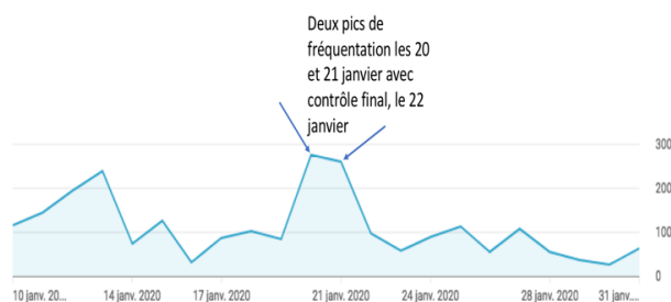
fig. 3 : pics de fréquentation deux jours avant l'examen final du 22 janvier, 277 vues le 20 janvier et 261 vues le 21 janvier.

La figure 3 illustre les pics de fréquentation la veille des contrôles qui trahissent le fait que les étudiants sont restés dans un mode de bachotage peu propice aux apprentissages durables. On peut améliorer la mesure si les capsules sont déposées dans un espace privé. Ajoutons que l'utilisation de la plate-forme YouTube peut être considérée comme étant problématique. Elle ne respecte pas nécessairement l'esprit de la RGPD, les étudiants peuvent être distraits par de l'information parasite (vidéos récréatives suggérée en panneau accessoire), les contenus étant ouverts, on ne mesure pas de façon séparée le comportement d'un établissement en particulier. En revanche, l'outil Analytics est performant et la plate-forme est très stable et disponible. Il n'entre pas dans le cadre de cette étude de comparer une plate-forme généraliste comme YouTube avec l'encapsulation de vidéos dans un CLMS comme Moodle.