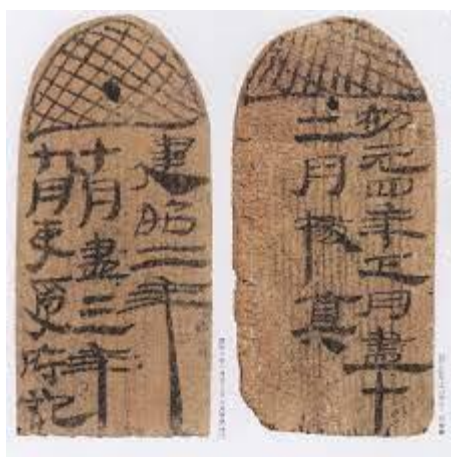
1. Planchettes de bambou des Han trouvées à Juyan

la Falaise rouge de Su Dongpo (1035-1001), la calligraphie dans son entier, par la présence même de lavis d'encre pâle, suggère la graphie du caractère hui 回, « revenir » ou « retourner » ; il en est de même pour la calligraphie du poème de Zhang Ruoxu (660-720 ?), Nuit de lune et de fleurs sur le fleuve printemps , p. 45. De plus, les longs traits verticaux et obliques dans ces deux œuvres font clairement référence à la graphie antique de l'époque où l'écriture a commencé à devenir un art, au tournant de notre ère, et aux caractères en écriture cléricale des Han, comme on peut en voir par exemple sur les lamelles de bambou trouvées à Juyan (ill.1). Mais ce style antique se perçoit également p. 46, dans la phrase d'un poème de Li Shangyin (813-853), « Mer d'émeraude, ciel d'azur, nuit après nuit, de cœur qui brûle », en particulier dans les traits obliques vers la droite très appuyés des caractères tian 天 (ciel) et ye 夜 (nuit).