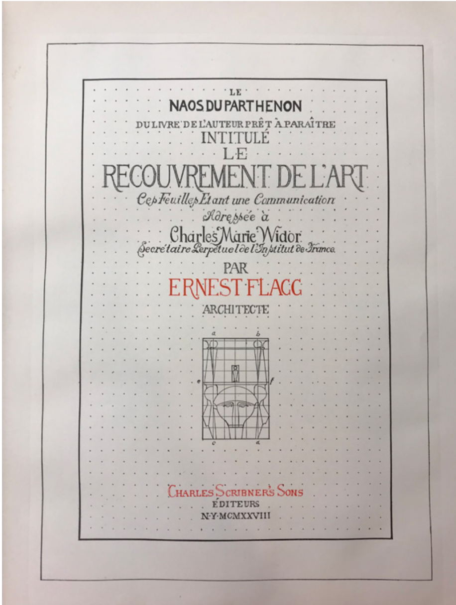
Fig. 5. Couverture de la pré-édition de l'ouvrage Le Naos du Parthénon , communiquée en 1928 à Charles Marie Windsor.