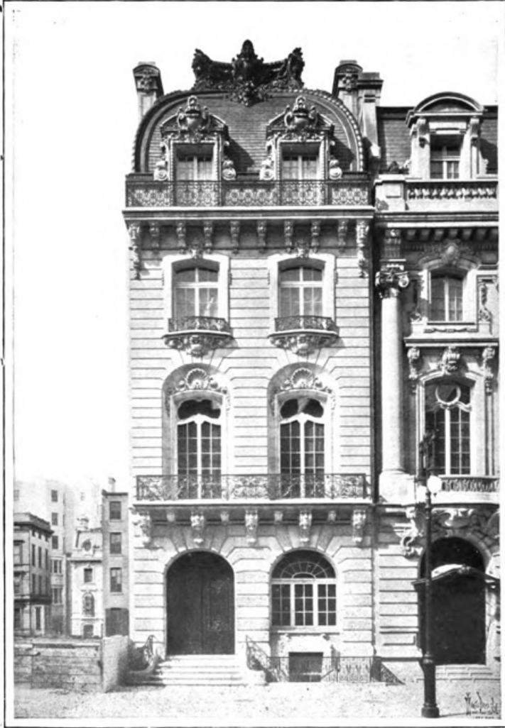
FIG. 51. RESIDENCE OF O. G. JENNINGS, ESQ., NO. 7 EAST 72D STREET, NEW YORK CITY.

Ernest Flagg and W. B. Chambers, Architects.