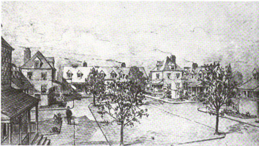
HOUSING PROJECT FOR NORTH CHESTER REALTY CO., CHESTER, PA.

(Pennsylvanie) pour des ouvriers travaillant dans l'industrie navale de guerre 14 . Ce programme présente deux caractéristiques intéressantes. D'une part, s'il est bien constitué de maisons, il est à noter que certaines d'entre elles sont conçues pour abriter jusqu'à quatre familles ( fig. 4 ). Ainsi, malgré la présence de plusieurs foyers au sein d'une même habitation, le modèle de la maison individuelle reste mis en avant par le gouvernement américain : le « Sun Village » constitue en ce sens un exemple frappant de l'importance de l'idéal du petit domaine pour les classes populaires. D'autre part, il s'agit là de la seule opération de logement financée par le gouvernement que réalise Ernest Flagg. Compte tenu des opinions particulièrement libérales de ce dernier – farouchement opposé à l'interventionnisme gouvernemental – sa décision peut apparaître comme surprenante. Selon Mardges Bacon, monographe de l'architecte, ce choix était motivé tant par le sentiment patriotique que par l'intérêt personnel de Flagg 15 . Il envisageait en effet ce projet comme un laboratoire lui permettant d'expérimenter ses nouvelles techniques et théories dans le domaine des petites maisons, qu'il considérait comme un terrain de recherche primordial.