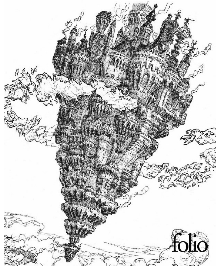
Figure 5.1 : Couverture de La Passe-miroir (Gapaillard, 2016).

À la Citacielle, les constructions ont entièrement dévoré l'île, qui est représentée dans cette couverture comme un gigantesque château volant au caractère médiéval, caractère que l'on perçoit déjà dans les tours des Chroniques du bout du monde et qui semble évoquer une nostalgie du passé tout en rappelant les codes de la fantasy et en plongeant les lecteurs et lectrices dans une atmosphère merveilleuse. Cette adaptation de la Citacielle à l'environnement est avant tout une domination de l'espace qui place l'humain en créateur absolu, voire divin. En considérant l'œkoumène non plus uniquement comme un « espace habitable de la surface terrestre » (Œkoumène, s.d.), mais comme l'en-