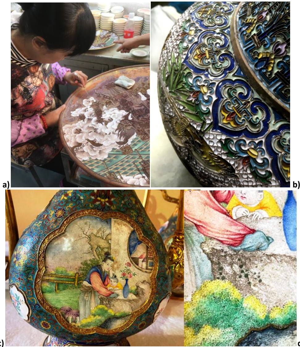
Figure 4. Réalisation d'un décor d'émaux cloisonnés : a) la poudre de verre coloré remplit le volume entre les cloisons collées/soudées sur le support ; b) après une première cuisson le verre ayant réduit de volume, un nouveau remplissage est effectué ; ces opérations sont faites plusieurs fois ; noter que la couleur avant cuisson est différente de celle de l'émail final ; c) aiguière en or (Musée chinois, Château de Fontainebleau)[12] offerte par Napoléon III à son épouse l'Impératrice Eugénie associant un décor en émaux cloisonnés et en émaux peints (diamètre ~20 cm) ; d) noter la technique de peinture par points de couleurs ; l'analyse Raman montre que dans un point, à l'échelle micronique la teinte est obtenue par l'association de plusieurs pigments.

ou des essences fortement chargées en colle. Le mélange de poudres chargées en différents agents colorants, à la manière du peintre de chevalet mélangent la matière de différents tubes permet une grande palette de teintes mais au 17 e siècle les émailleurs de montres 'copient' la technique des miniaturistes : au 17 e et surtout au 18 e s. des peintres comme J.-. Massé, C.-N. Cochin, H. Drouais, etc. réalisaient à la loupe en utilisant la plume (dessin) ou des pinceaux très fins (quelques poils) des images sophistiquées à partir de 'points' colorés. Comme montré sur les figures 3 et 4 cette technique est utilisée par les peintres d'émail sur porcelaine ou sur métal. La dimension limitée des objets et leur forme impose une restructuration de la mise en page.