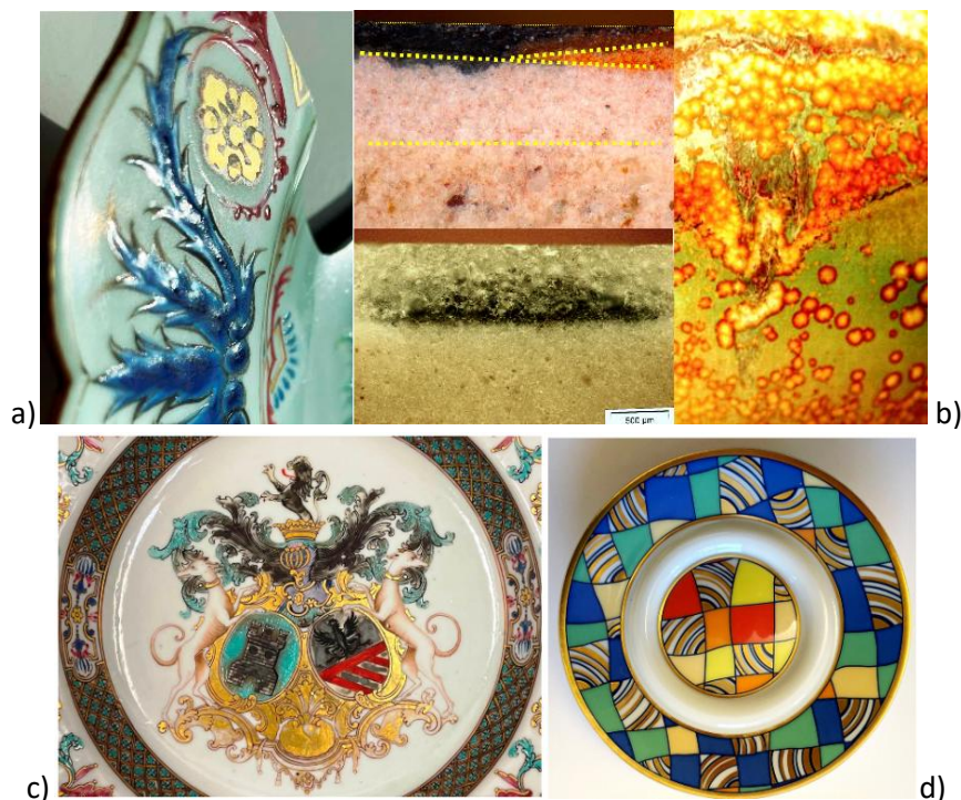
Figure 1. Variété technique des émaux : a) émail sur couverte de style Régence, plat portant les armes de Philibert Orry, réalisé en Chine, 18 e s. ; l'émail bleu est un borosilicate réalisé selon la recette de Jean Hellot ; centre, section d'une céramique d'Iznik (16 e s.) avec plusieurs couches d'émaux colorés en rouge et bleu sur un engobe de grains de quartz, lui-même sur une pâte siliceuse et section d'une porcelaine 'bleu-et-blanc' où le décor bleu est peint sous couverte sur la pâte (Chine, 16 e s., échelle : 500 \mu\text{m} ); b) décor d'une couverte à la cendre de plante où la nucléation de petits cristaux forme le décor (Fr. Daniel de Montmollin) ; c) plat de porcelaine produite en Chine sur commande portant les armes d'une famille hollandaise (18 e s.) ; soucoupe de tasse à café (Rosenthal, 20 e s.) (Collections privées).

Les émaux sont des silicates amorphes, des verres. Comme la silice pure ( \text{SiO}_2 ) fond à très haute température ( >1700^\circ\text{C} ) tout l'art des verriers et émailleurs a été de remplacer un ion silicium formant 4 liaisons covalentes très fortes (l'unité structurale, le tétraèdre \text{SiO}_4 , est conservée à l'état liquide, Figure 2) par 4 ions sodium ou potassium, ou 2 ions calcium ou plomb formant des liaisons ioniques beaucoup plus faibles, et donc abaissant la température de fusion, la viscosité, etc. Ils sont qualifiés de flux. Le calcium a aussi comme l'aluminium et le zirconium un rôle bénéfique pour la tenue à la corrosion.