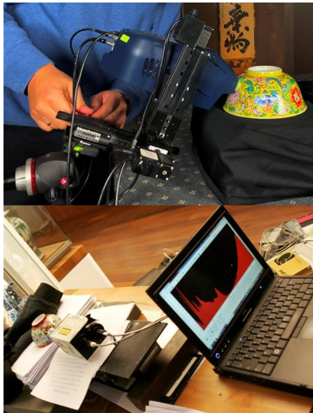
Figure 5. Mesure sur site, non-invasive, sans contact de bols impériaux (Dynastie Qing): haut, analyse par fluorescence des rayons X d'un bol du règne de Daoguang, 19 e s., Fondation Baur Genève) ; bas, analyse par microspectroscopie Raman d'un bol du règne de Yongzheng, 18 e s., Musée national des arts asiatiques-Guimet).

La comparaison des signaux XRF des impuretés caractéristiques de la matrice de l'émail, c'est-à-dire le 'verre' constituant l'émail donne aussi des informations. L'yttrium, le rubidium et le strontium sont des impuretés associées au calcium, sodium et aux argiles utilisés pour faire la matrice de l'émail contenant les agents colorants. Leur examen sépare bien les productions des Dynasties Yuan (1271-1368) et Ming (1368-1644) (Vietnam et Chine, pauvre en Y), les productions de porcelaines françaises des 17 e et 18 e siècles (riche en Y) et entre les deux celles chinoises de la dynastie Qing (1644-1912) réalisées avec un mélange d'ingrédients européens et chinois selon l'enseignement des Jésuites, français mais aussi allemands et italiens, présents à la cour de Chine. Au 18 e siècle, principalement à Canton, les ateliers chinois produisent sur commande, avec des designs prescrits depuis l'Europe, des objets émaillés sur métal ou sur porcelaines avec des recettes en grande partie européennes pour leur exportation vers l'Europe.[8,10,11,14] La Chine était alors l'atelier du monde pour ces productions, comme aujourd'hui pour de nombreux produits.