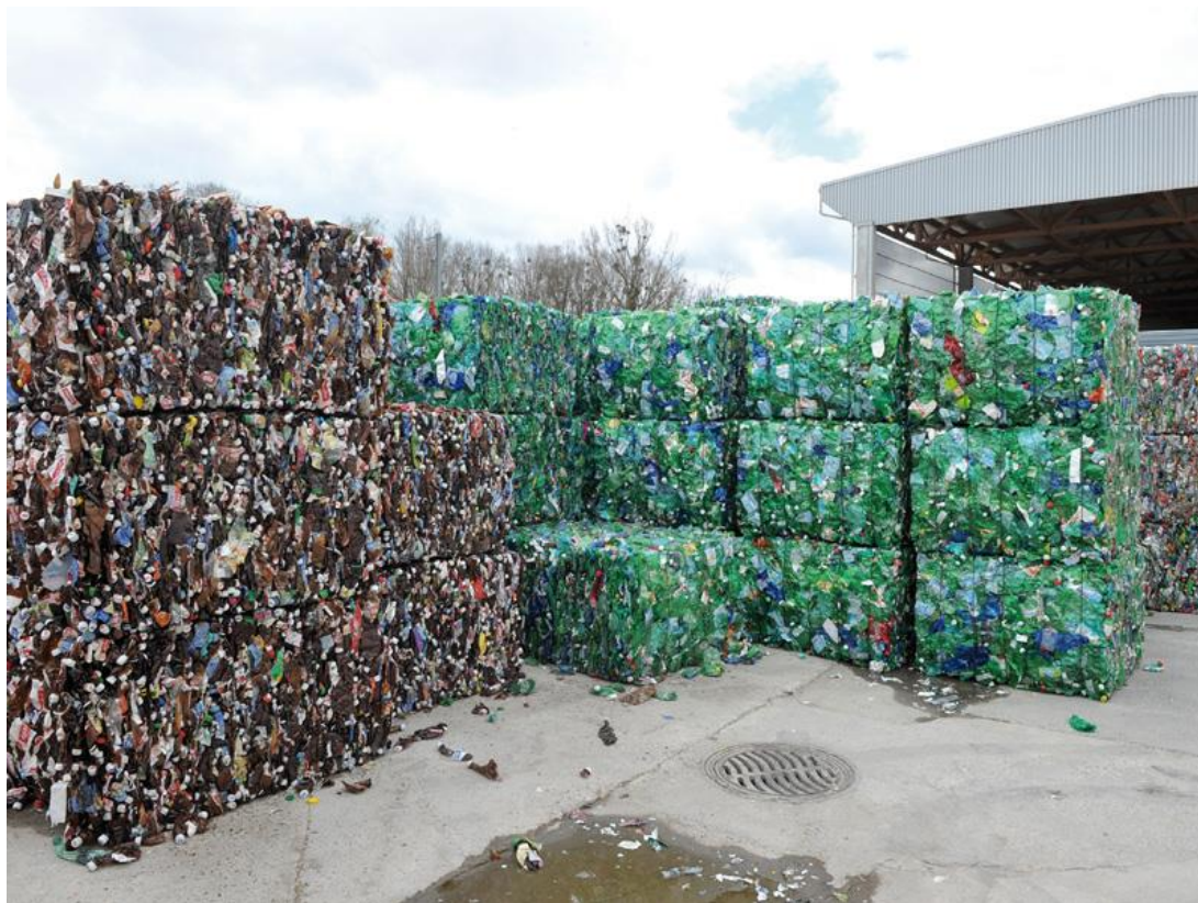
Figure 1 : Balles de PET stockées

En dehors de quelques exceptions 24 , les centres de tri et les usines de régénération sont des espaces différenciés et détenus par des sociétés différentes. À la sortie du centre de tri, les balles sont donc ensuite acheminées vers des centres de régénération spécialisés par type de polymères. En effet, chaque polymères nécessite de constituer sa propre filière de régénération 25 .