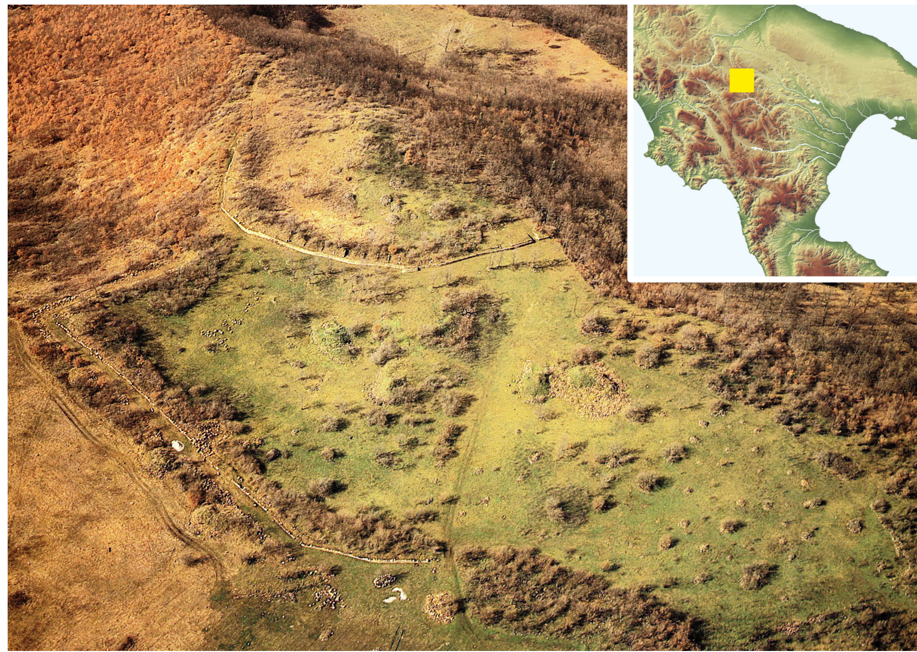
Fig. 1. Il sito di Monte Torretta: foto aerea e localizzazione

Vincenzo Capozzoli, Alain Duploux, Agnes Henning