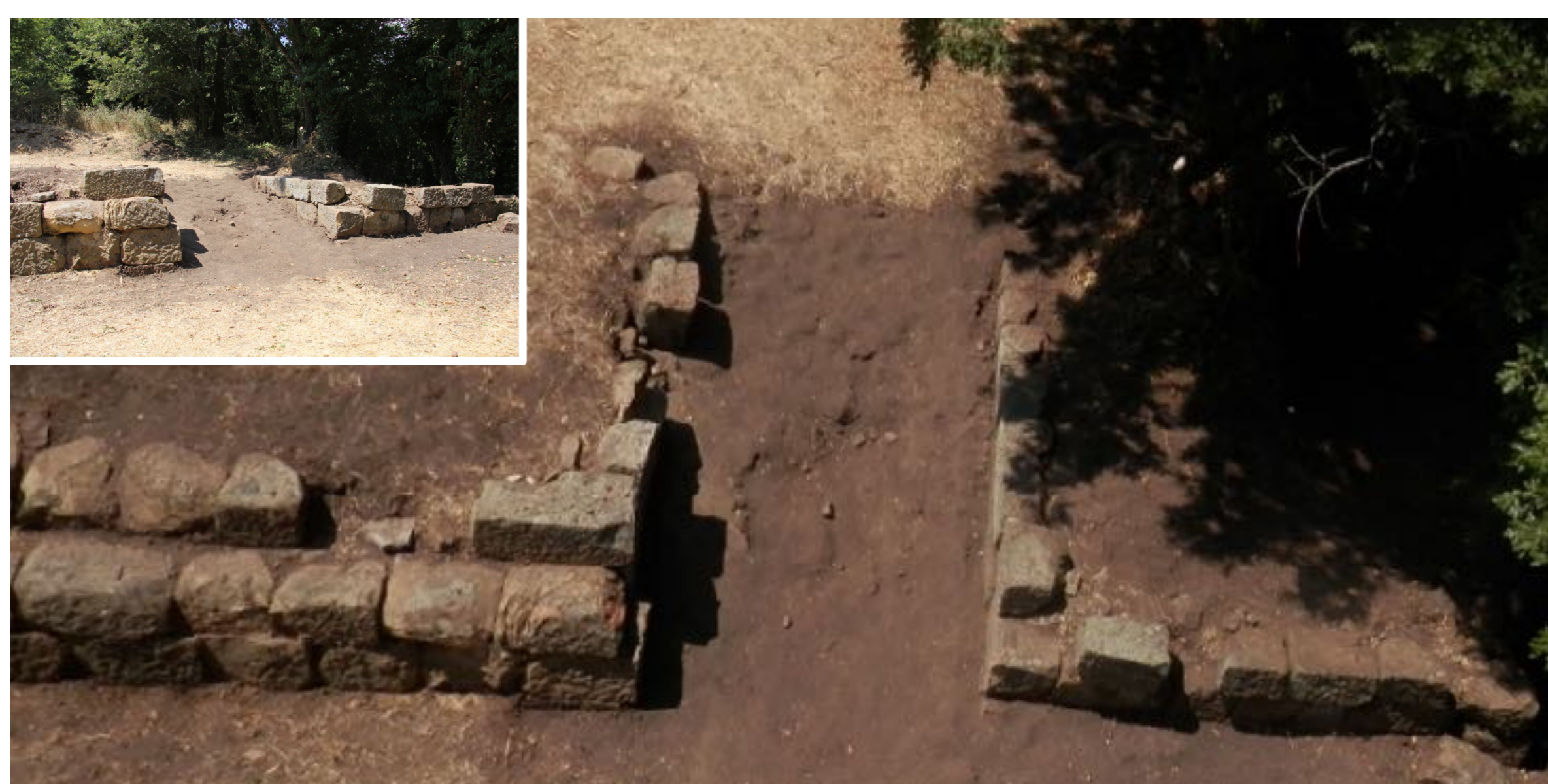
Fig. 3. Foto con asta e vista frontale della « Porta Livia »

L'obiettivo principale della prima missione è stato quello di intercettare i saggi realizzati in passato, procedendo a un nuovo rilievo delle strutture visibili ed elaborando da subito un apposito GIS. Per ragioni di tempo ci si è limitati all'area della c.d. Acropoli. La situazione si è rivelata da subito ricca ed articolata, mostrando come la planimetria finora nota vada corretta in più punti. Da rivedere è, anzitutto, il raccordo della porta della c.d. Acropoli con il restante circuito murario: le nostre indagini subito a nord della porta (c.d. «Porta Livia») suggeriscono infatti una certa prudenza nell'accettare la vecchia ricostruzione planimetrica. Novità di rilievo provengono anche dalle pendici nord dell'Acropoli: qui, in luogo dell'unica linea di fortificazione generalmente ammessa, è stato possibile verificare l'esistenza di un sistema di muri di terrazzamento disposti a quote variabili e realizzati con blocchi irregolari e grossolanamente lavorati in facciavista. Resta dunque in sospeso la questione del tracciato delle mura in questo settore, su cui sarà necessario tornare ad interrogarsi nel corso delle prossime indagini.