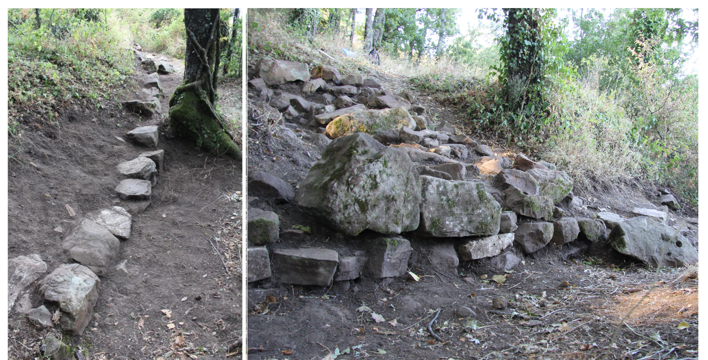
Fig. 4. Muri di terrazzamento sul versante N della c.d. Acropoli