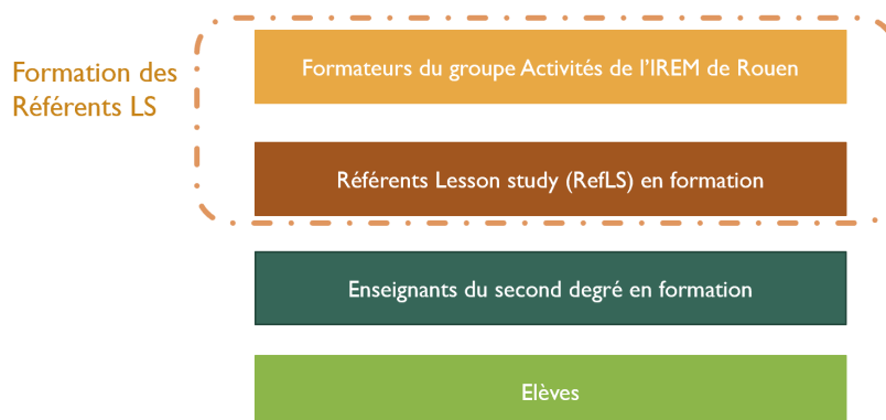
Figure 2. Les différents acteurs impliqués dans notre recherche

« à l'échelle locale [...] entre pairs et en équipe ». Les Lesson Study sont mentionnées dans les Vademecum des dispositifs relatifs à la mise en place de ces mesures (MENJ, 2019). Cet engouement institutionnel pour ce type de dispositif a alors poussé le groupe IREM Activités à former des formateurs du premier et du second degré afin que les collègues puissent à leur tour encadrer ce type de formation. Cela amène donc à considérer de nouveaux acteurs, les Référents Lesson Study (appelés ensuite RefLS), qui sont des enseignants du second degré 6 (dans le contexte qui nous intéresse) ayant vocation à devenir des formateurs académiques de formations de type LSa. Cette formation de formateurs (RefLS) met aussi en jeu les élèves des référents LS.