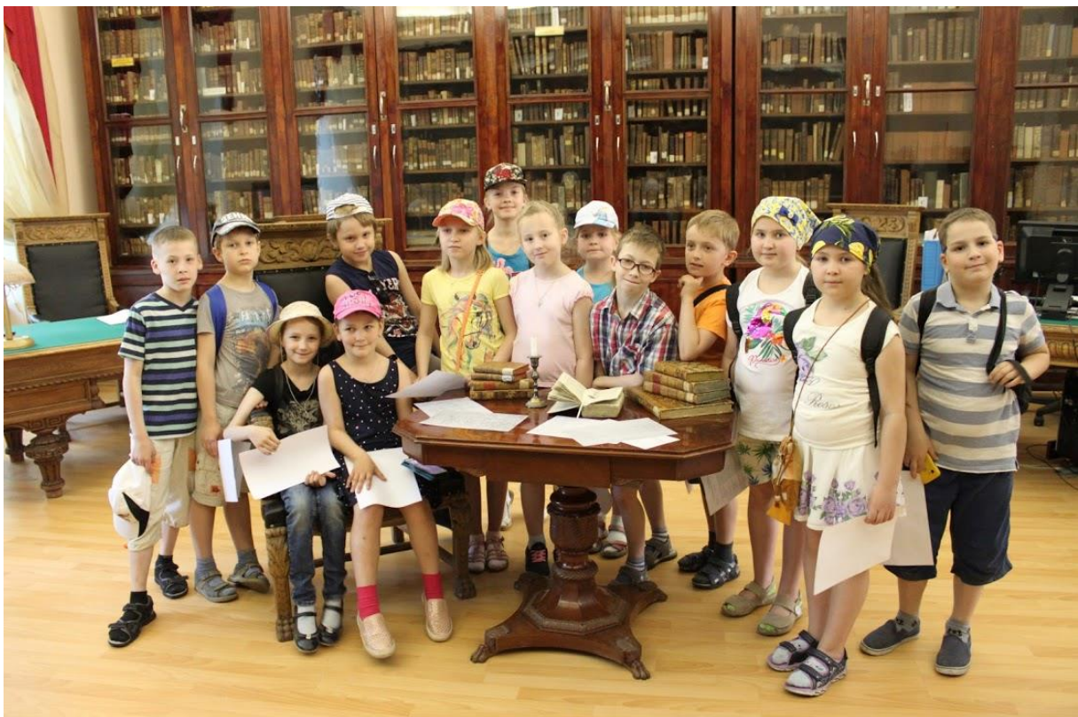
Biblioquest à la BU

Les événements que nous organisons sont consacrés à la littérature, aux livres : ce sont des rencontres avec des écrivains, des conférences, des tables rondes, des jeux, des quiz. Nous organisons également des excursions, des expositions, des biblioquests , des événements que nous appelons "Saisons pédagogiques", et qui sont spécialement conçues pour les écoles de Saint-Petersbourg. Une biblioquest , c'est un événement interactif. Les participants reçoivent un itinéraire avec des questions au sujet d'une œuvre, d'une série de livres ou sur la création d'un écrivain. Pour résoudre les énigmes, ils s'appuient sur des indices qui peuvent être trouvés dans les expositions ou dans les étagères de la bibliothèque. A la fin, les participants composent un mot-clé ou complètent une grille de mots-croisés.