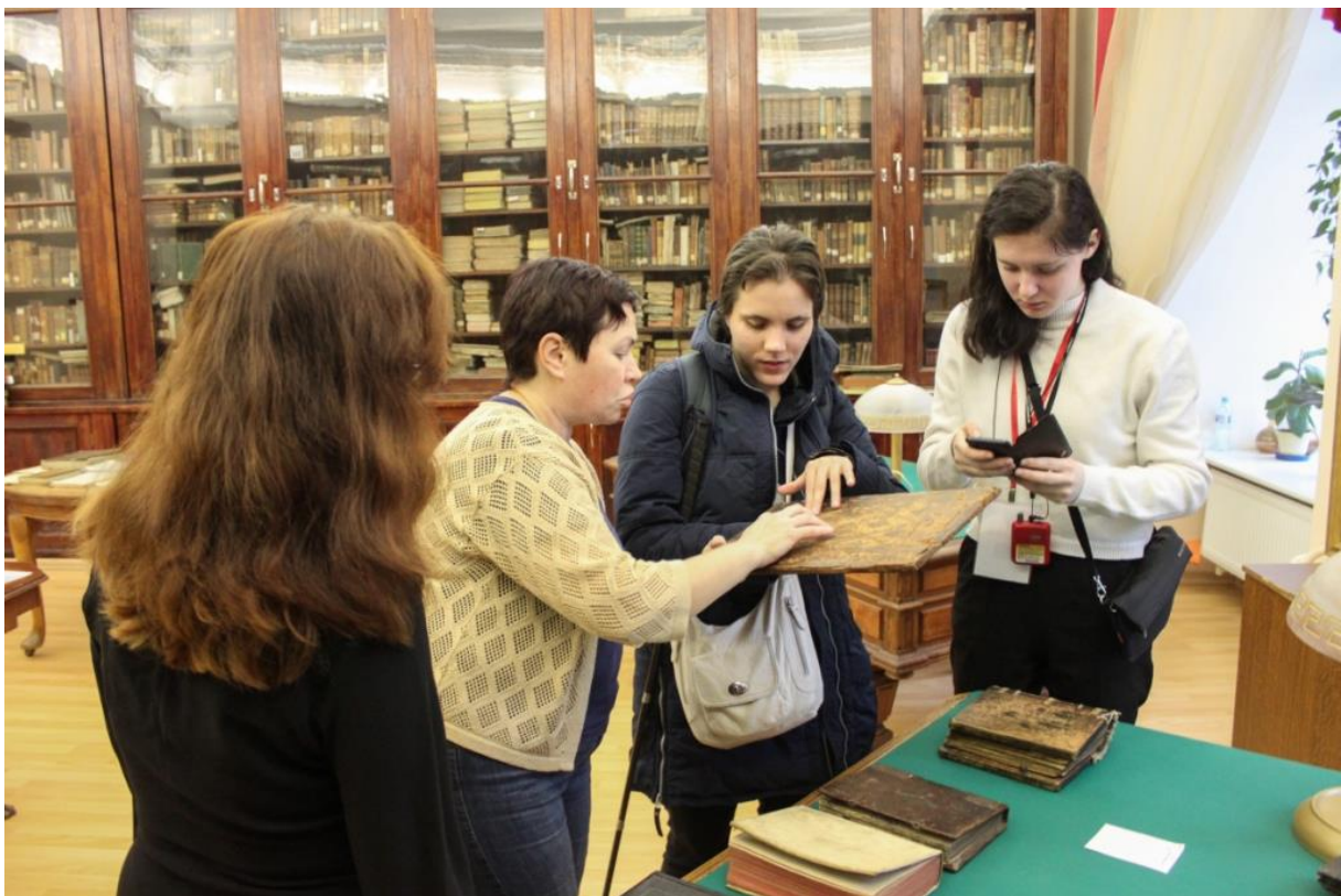
Découverte de vieux livres par le toucher