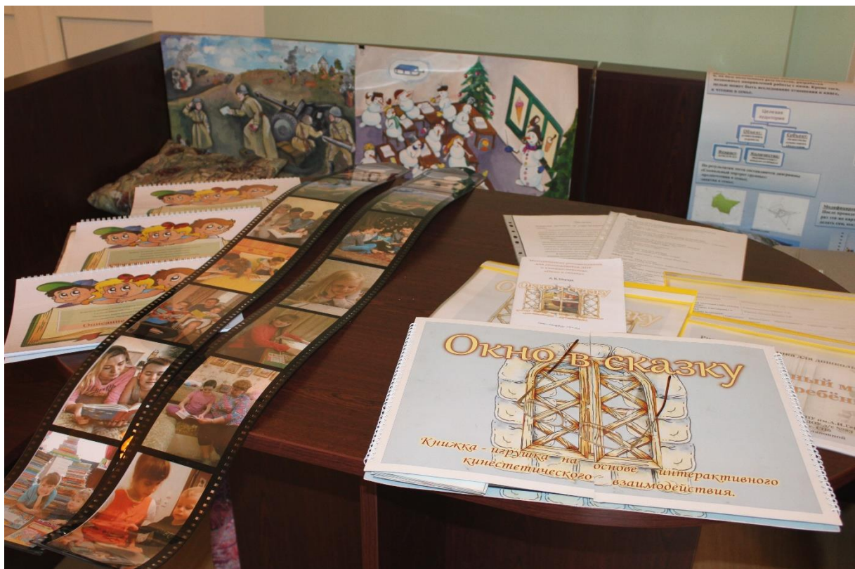
Travaux d'étudiants dans le cadre d'un cours consacré aux technologies socio-pédagogiques pour le développement d'une culture de la lecture.

Un booktrailer est un court-métrage qui parle d'un livre, sous un format artistique choisi librement par les étudiants. Un story-sack , c'est un sac dans lequel se trouve une illustration d'art tirée d'un livre pour la jeunesse avec du matériel complémentaire pour stimuler la lecture enfantine. Cela peut être un jeu, une cassette ou un CD, un jeu linguistique, des indications pour les parents. Les jouets glissés dans le story-sack , ce sont les héros d'un livre de fiction, et les accessoires peuvent être des produits dérivés du livre. (Par exemple : le récit Moydodyr de K. Tchoukovski, c'est un livre, mais aussi un dessin animé, qu'on peut décliner en brosses à dents, savon, serviette, etc.).