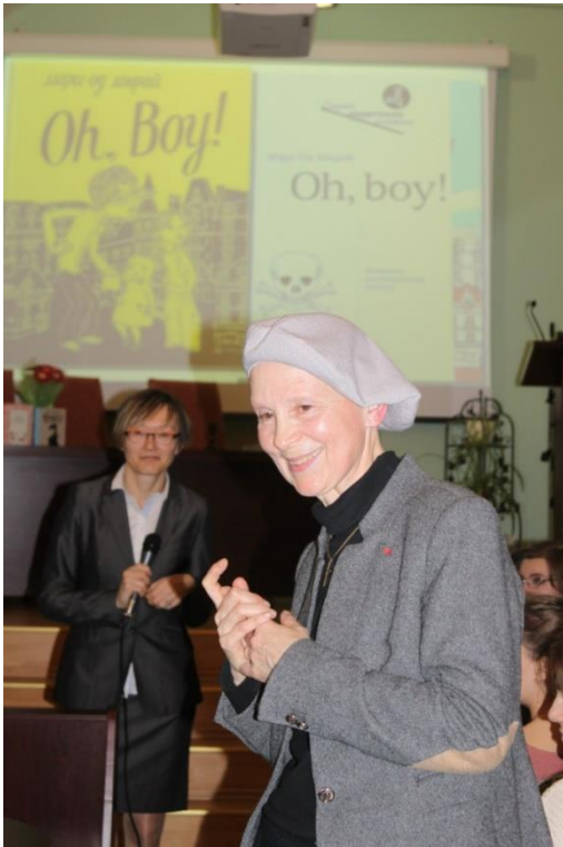
Rencontre avec Marie-Aude Murail

Depuis 10 ans, nous menons un projet culturel et pédagogique que nous avons appelé « Les Rencontres littéraires d'Herzen » : ce sont des rencontres avec des écrivains célèbres, des journalistes, des artistes du livre, des traducteurs, des éditeurs de livres, etc.