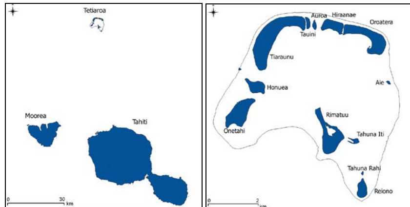
FIGURE 1. Atoll de Tetiaroa – Archipel de la société – Polynésie française

L'île de Tetiaroa est un atoll des îles du vent dans l'archipel de la société en Polynésie française. Cet atoll fermé, situé à 50km au nord de l'île de Tahiti par 17°00' Sud et 149°34'Ouest, comporte 12 « motu » (îlots coralliens) (Figure 1).