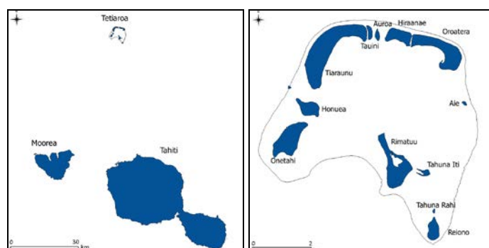
FIGURE 1. Atoll de Tetiaroa – îles du vent (gauche) – Motu de Tetiaroa (droite)

L'île de Tetiaroa est le seul atoll des îles du vent dans l'archipel de la société en Polynésie française, il est situé à 50km au nord de l'île de Tahiti par 17°00' Sud et 149°34'Ouest (Figure 1). Cet atoll fermé possède 12 « motu » ou îlots coralliens, de surface cumulée de 5,5km 2 (Table 2).