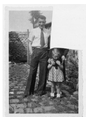
Photo découpée après un divorce, 1942

Pour autant, la vie de ces reliques visuelles est soumise aux aléas de la vie des familles concernées. Elle s'est trouvée compliquée par la proportion croissante des ruptures et des recompositions. Que deviennent les albums en cas de divorce ? Qui les conserve, qui les accapare ? Qui conserve-t-on dans cette légende en images de la famille ? Supprime-t-on, et comment, les membres rejetés ou jugés indignes ? Toutes sortes de meurtres symboliques se jouent entre les pages des albums de famille, des silences s'instaurent que ne dissipent pas les images.