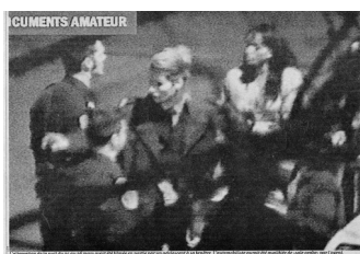
Incident policier filmé par un amateur, AFP, Libération , 11 mai 2000

Le fait qu'il y ait eu un appareil photo dans quasiment chaque foyer et dans les bagages de presque tous les vacanciers a contribué à faire déborder, à l'occasion, la pratique amateur de la photographie de sa logique strictement privée et familiale. Il est arrivé souvent qu'une personne témoin d'un événement public – manifestation, accident, simple altercation, etc. – se soit trouvée en mesure d'en faire des photos, voire de le filmer.