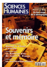
Couverture de la revue Sciences Humaines sur le thème « Souvenirs et mémoires », juillet 2000

Désormais, la photographie de famille est devenue communément synonyme de mémoire et d'évasion.