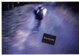
Jean-Marc Biry, Série Non facturé , 2000

D'autres encore se sont intéressés aux chutes des pellicules d'amateurs.