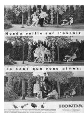
Publicité pour les outils de jardin Honda, 1999

Pour autant, les frontières stylistiques sont mouvantes. Ainsi, à leur tour, les publicitaires puisent dans l'imagerie de la photographie de famille pour vanter le confort domestique, les services téléphoniques, le jardinage, les contrats d'assurance, la gestion du patrimoine, les vacances, la famille et bien sûr le matériel photographique.