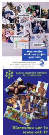
Publicité pour les notaires, 1998