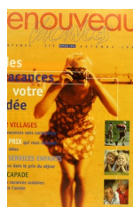
Couverture du catalogue de vacances de Renouveau , 1999

Elle alimente constamment le visuel de supports de communication qui traitent de ces thèmes. Illustrer un article sur la mémoire au moyen de photographies privées est devenu très courant dans la presse. C'est un curieux renversement : initialement dépréciée pour sa banalité, la photographie de famille s'est imposée à son tour comme un lieu commun dans le langage visuel des professionnels de l'image.