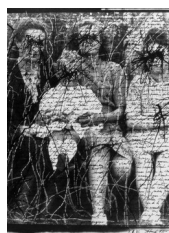
Vincent Cordebar, Sans titre , 1991 : photographie raturée et recouverte de texte

Jochen Gerz disait d'ailleurs apprécier dans la photographie sa capacité à faire rapidement une image ; et il ajoutait : « une image sans plus ». En d'autres termes, un simple matériau visuel réutilisable à loisir. Tous ces artistes qui ont repris des photos de famille perdues, ratées ou trouvées dans les brocantes, appréciaient de disposer ainsi d'images dont ils ne savaient rien, dont ils ne voulaient rien savoir, et qui s'offraient sans résistance à leur imaginaire. Ils se sentaient particulièrement libres d'en user à leur guise. D'autant plus libres même qu'il s'agissait d'images « hors d'usage », puisque rejetées par leurs auteurs inconnus ; disponibles par conséquent pour la sublimation artistique. Les plasticiens les ont retravaillées sans crainte de les voir se rebeller contre leur intention créatrice, même la plus destructrice.