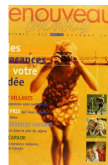
Couverture du catalogue de vacances de Renouveau , 1999

Elle alimente constamment le visuel de supports de communication qui traitent de ces thèmes. Illustrer un article sur la mémoire au moyen de photographies privées est devenu très courant dans la presse. C'est un curieux renversement : initialement dépréciée pour sa banalité, la photographie de famille s'est imposée à son tour comme un lieu commun dans le langage visuel des professionnels de l'image.