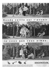
Publicité pour les outils de jardin Honda, 1999

Pour autant, les frontières stylistiques sont mouvantes. Ainsi, à leur tour, les publicitaires puisent dans l'imagerie de la photographie de famille pour vanter le confort domestique, les services téléphoniques, le jardinage, les contrats d'assurance, la gestion du patrimoine, les vacances, la famille et bien sûr le matériel photographique.