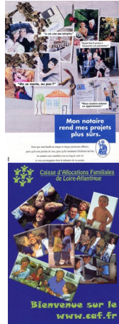
Publicité pour les notaires, 1998