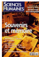
Couverture de la revue Sciences Humaines sur le thème « Souvenirs et mémoires », juillet 2000

Désormais, la photographie de famille est devenue communément synonyme de mémoire et d'évasion.