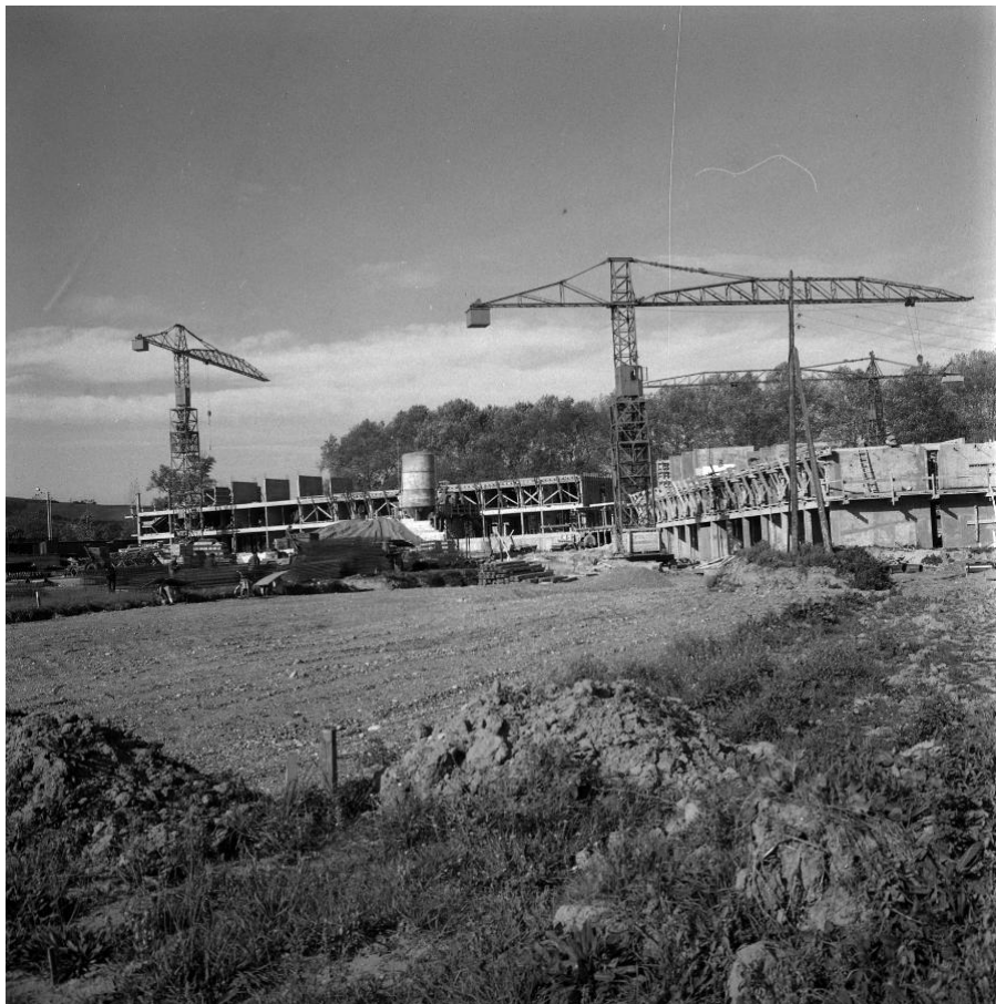
2. Faculté des Sciences de Ranguetil (Cros André - Mairie de Toulouse, Archives municipales, 53 Fi 3150, 1963)

Le chantier commence dès 1961 comme le montre la photo ci-dessous et la nouvelle université est inaugurée en 1966. Le projet du campus de Ranguetil apparaît donc comme un projet pilote, parmi les premiers sur le modèle des campus à l’américaine en France. Impulsé par le doyen et soutenu par l’État, qui voit ainsi se développer son idée de grands campus en périphérie, comportant les installations nécessaires aux étudiants (restauration, hébergement, équipements sportifs et culturels). Ce campus s’est ensuite agrandi avec l’installation des écoles d’ingénieurs.