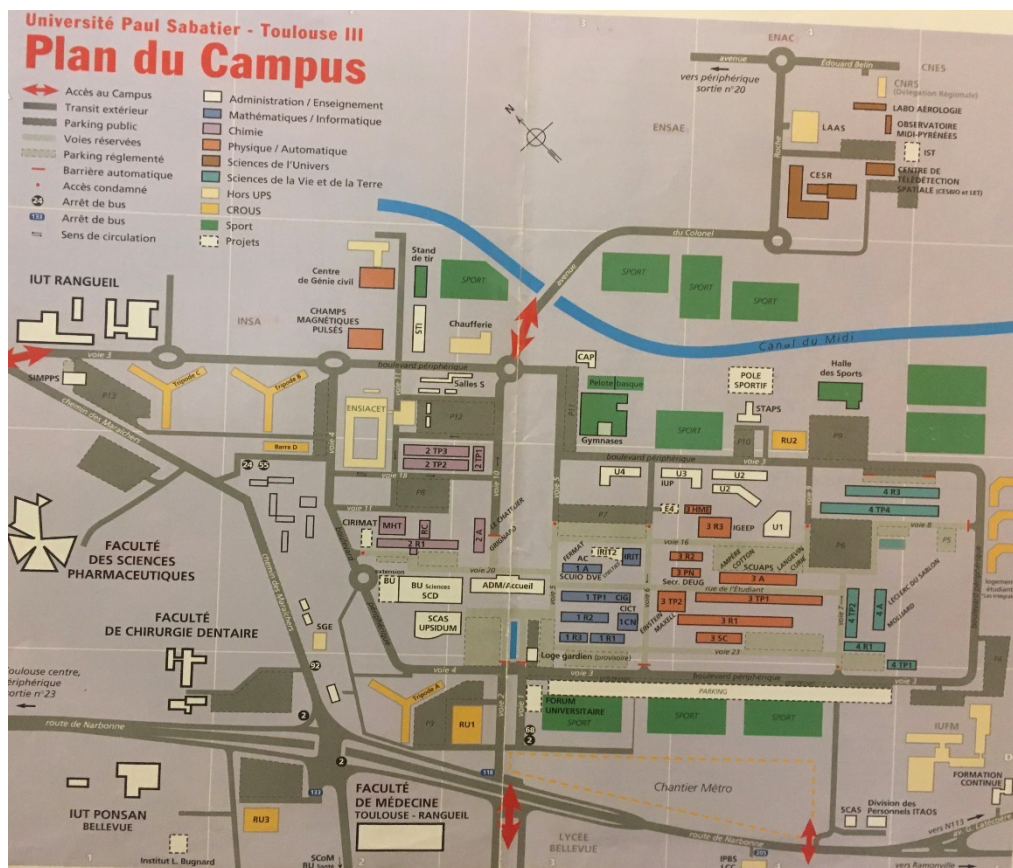
1. Plan du campus de Rangueil