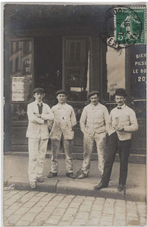
Figure 1 : [Boutiques parisiennes. Café, vins, restaurant, tabac], 1910, carte photographique, 13,8 x 9 cm, Paris, BHVP.