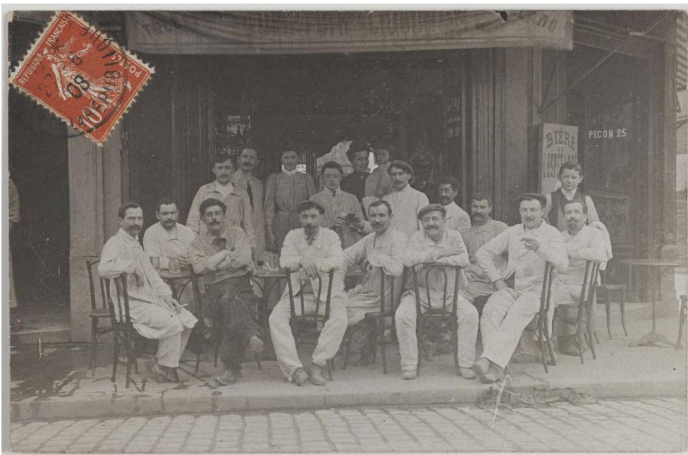
Figure 2 : [Boutiques parisiennes. Comptoir liquoriste (11e arr.)], 1908, carte photographique, 9 x 13,9 cm, Paris, BHVP.