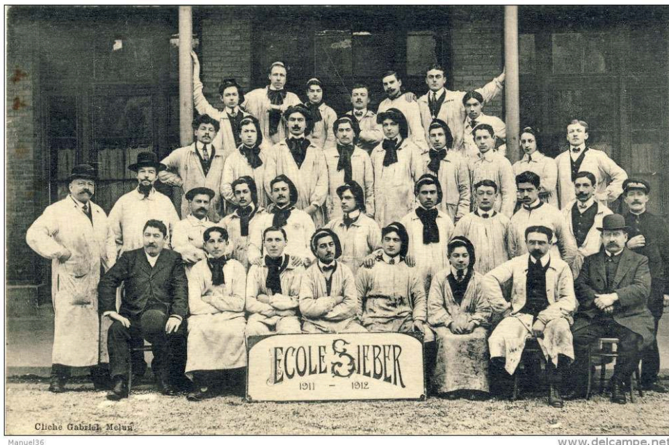
Figure 6 : Étudiants de l'école Sieber, Melun, France, 1911–12, carte postale, Cliché, Gabriel, Melun.