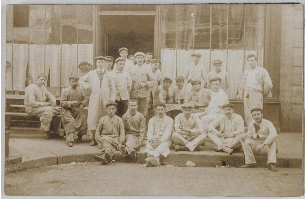
Figure 3 : [Boutiques parisiennes. Peintres en bâtiment], 1905-1920, carte photographique, 9 x 13,9 cm, Paris, BHVP.