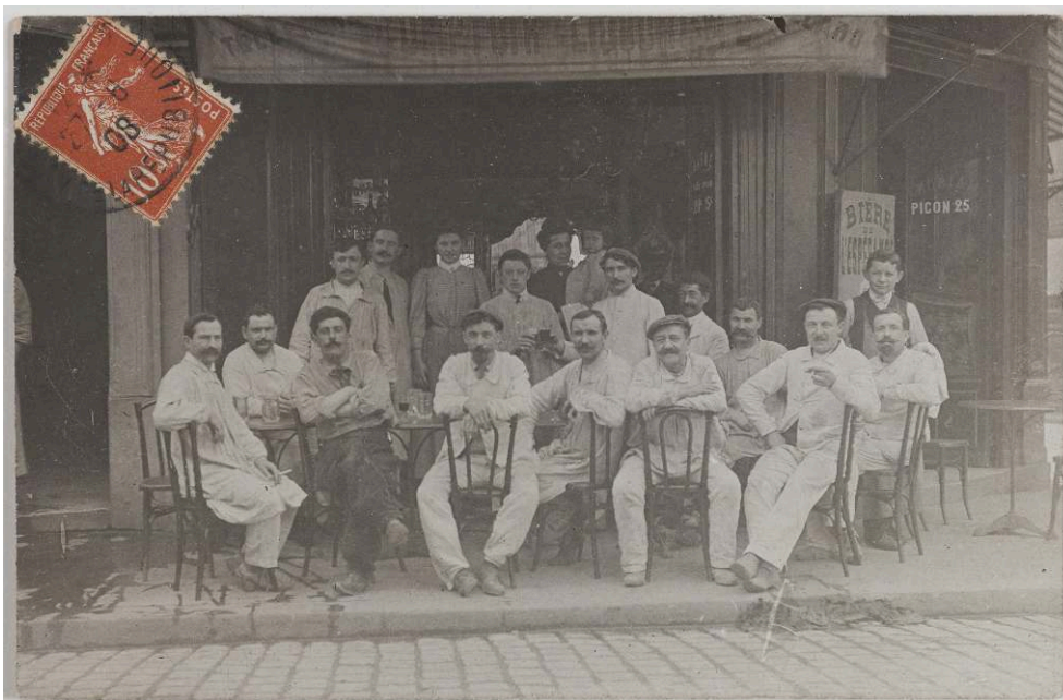
Figure 2 : [Boutiques parisiennes. Comptoir liquoriste (11e arr.)], 1908, carte photographique, 9 x 13,9 cm, Paris, BHVP.