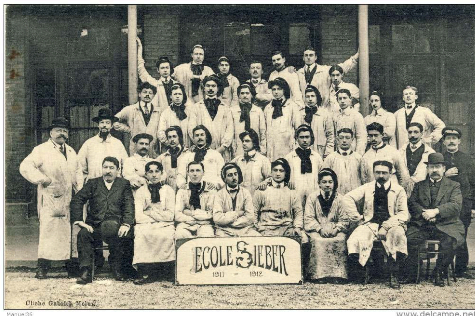
Figure 6 : Étudiants de l'école Sieber, Melun, France, 1911–12, carte postale, Cliché, Gabriel, Melun.