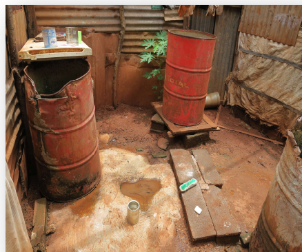
Bidons découverts dans toilettes traditionnelles. 2020

Les différences de protection de l'eau (bidon couvert à l'intérieur des cuisines, et découvert à l'extérieur) traduisent une différenciation dans la perception des besoins nécessaires à la qualité de l'eau en fonction des usages. S'il semble que les usagers sont attentifs à disposer d'une eau qui semble pure pour boire et cuisiner, le critère de la qualité ou de la pureté semble moins important lorsqu'il s'agit de l'eau destinée à la toilette. La question de l'impact des messages de prévention concernant les maladies vectorielles du type dengue ou chikungunya et des précautions pour éviter la nidification de moustique se pose donc avec acuité notamment à l'heure où une épidémie de dengue a sévi simultanément lors de la première phase de propagation de la Covid-19 sur l'île.