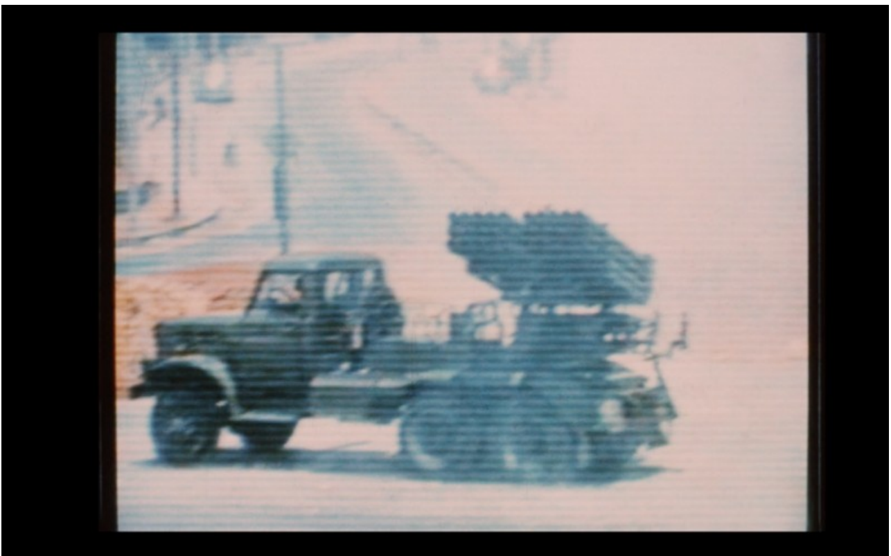
Remploi exogène d'images de la télévision dans Beyrouth ma ville (1982).