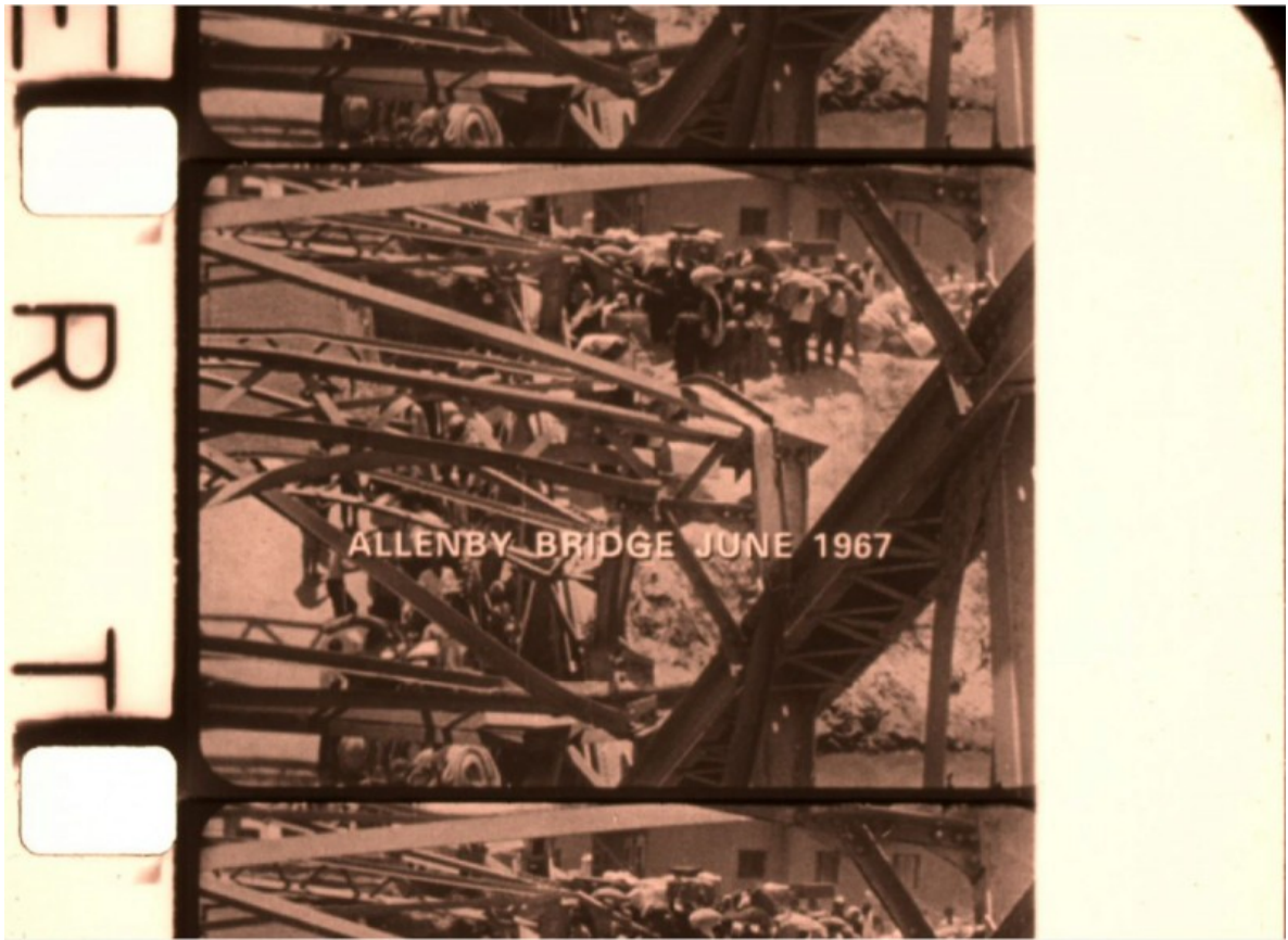
Les Femmes palestiniennes , 1974. L'observation des perforations permet de constater que cette image est une migration à partir d'une archive, très connue, de l'exil des Palestiniens après la Naksa de 1967.