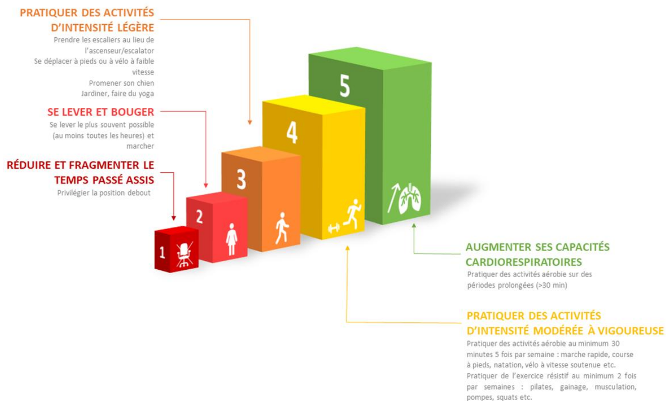
Figure 3 : Réapprendre à bouger. Moins s'asseoir et bouger plus : cette approche implique des étapes de transitions simples en commençant dans un premier temps à se concentrer sur la réduction et la fragmentation du temps passé assis en privilégiant la position debout pour progressivement réintroduire la pratique d'activités légères. Cette augmentation progressive du mouvement dans la vie quotidienne serait alors une préparation vers la pratique d'activités d'intensité plus élevée sur le long terme.