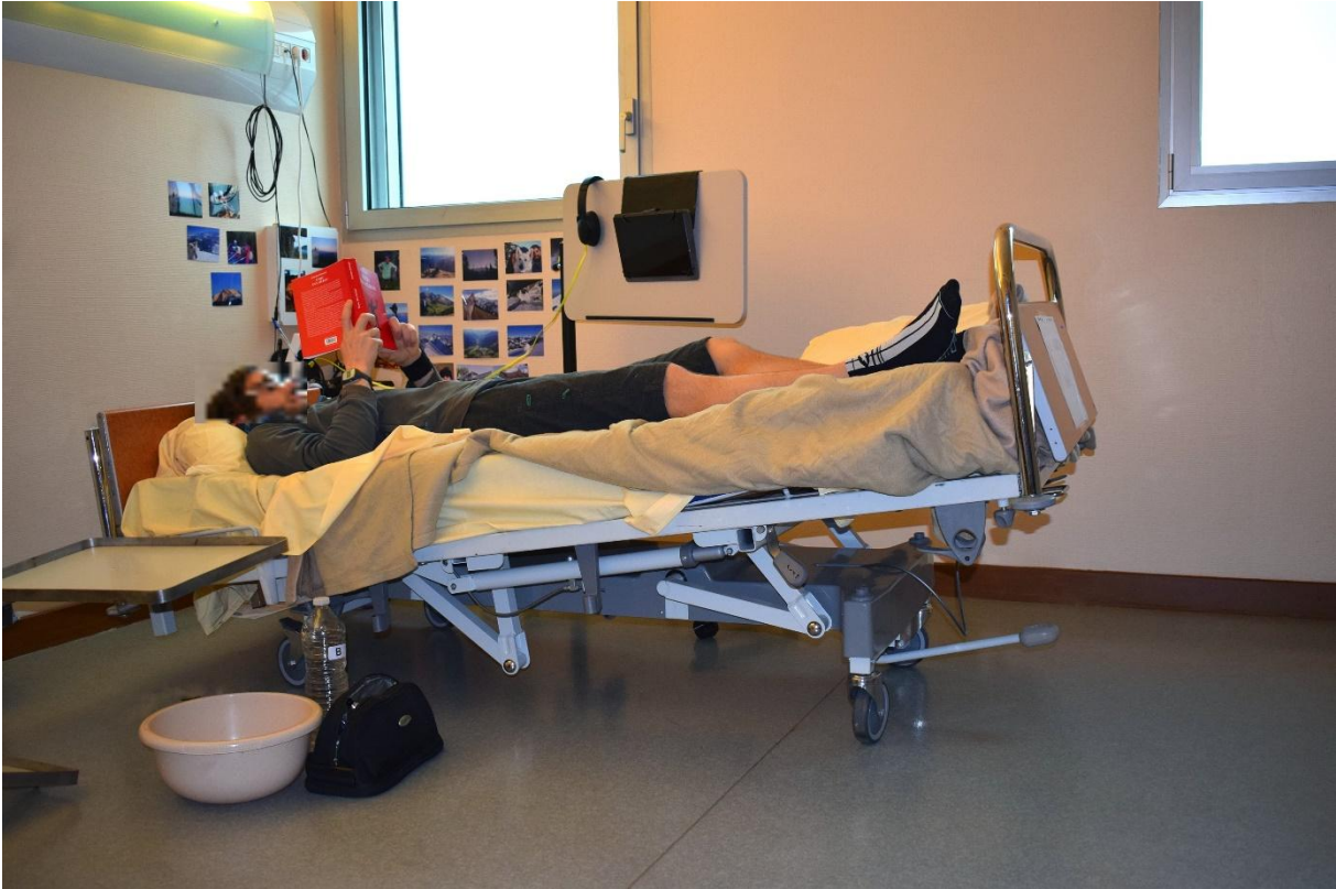
Figure 2 : alitement prolongé.