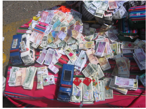
Figuras 7 y 8 – En la fiesta de Alasitas, en enero de cada año, se venden miniaturas de los objetos más necesitados y más deseados