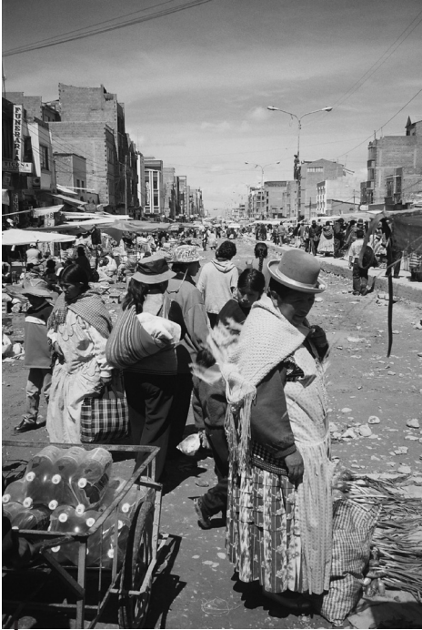
Figura 6 – Un mercado alteño