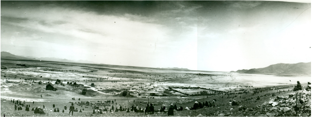
Figura 1 – El Alto a principios del siglo XX: ¿un espacio vacío?