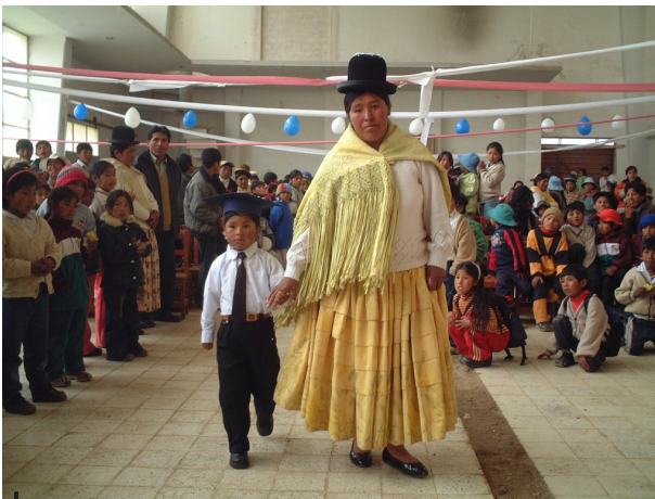
Figura 9 – Un desfile escolar en El Alto, donde se mezclan elementos «nacionales» e «importados»

de comunicación e importan modas extranjeras, pero el elemento determinante sigue siendo la influencia del grupo de pares. Así, la importación de música latina (tecno-rengue, cumbia, rock, etc.) pasa menos por la compra de discos que por conciertos de grupos locales, en discotecas ( chojcheríos ) destinadas a atraer una clientela joven, pero cuya disposición reproduce también la de las fiestas rurales (en particular con sillas alrededor de la pista de baile para ver bailar a unos y otros). El surgimiento de prácticas culturales propias de los jóvenes aymaras en un medio urbano no supone entonces