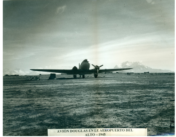
Figuras 3 y 4 – El terreno de aviación en los años 1940