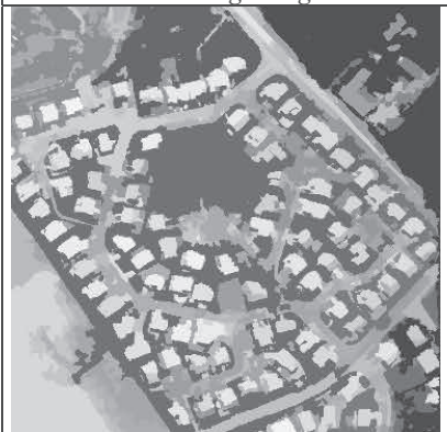
FIG. 5- Image Segmentée