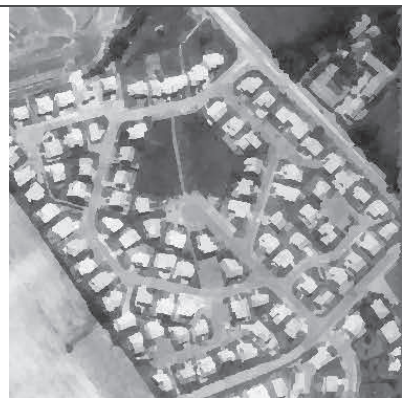
FIG. 4- Régions identifiées