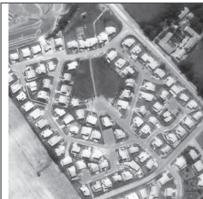
FIG. 3- Image Originale

Vincent, L., Soille, P. (1991) Watersheds in Digital Spaces: An Efficient Algorithm based on Immersion simulations. IEEE Transactions on Pattern Analysis and Machine Intelligence , p. 583-598.