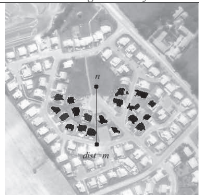
FIG. 6- Extraction des maisons au sud de n situées à moins de m