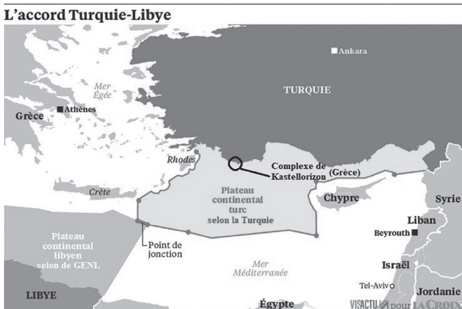
Carte 1 : Le MoU Turquie-GENL de novembre 2019

Cette carte comporte des ajouts de l'auteur.