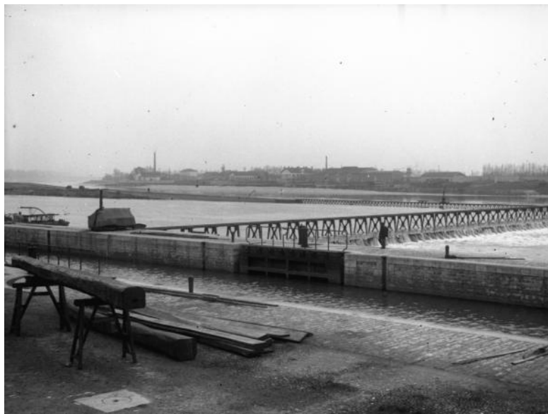
Figure 2. Ancienne écluse.

Il ne fait pas de doute qu'un tel matériau peut être examiné sous plusieurs angles. Il serait possible de l'appréhender sous l'angle communicationnel, en essayant de cerner, par exemple, l'intentionnalité de ces objets discursifs, pour remonter ainsi à l'intention de leurs auteurs. Il serait alors question de savoir quelles finalités et motifs animent les contributeurs de la base Photographes en Rhône-Alpes , de s'intéresser à la manière dont ces intentions se matérialisent et s'expriment dans leurs contributions, d'essayer d'identifier les convergences qui en émergent, d'en esquisser une typologie (par exemple l'intention de compléter une description iconographique fournie par les professionnels de la bibliothèque, de la rectifier, confirmer, démentir, etc.).