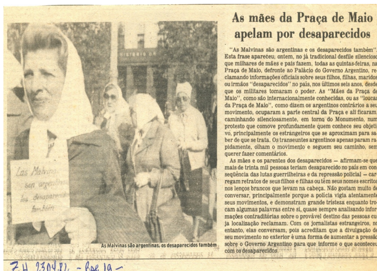
Figura 1. Recorte de jornal sobre atuação das “Mães da Praça de Maio”.

Primeiramente, para a realização do presente estudo foi realizado um levantamento bibliográfico, o qual se encontra na sessão “Movimentos sociais e seus acervos como espaços de memória e testemunho”, a partir desse levantamento definiram-se alguns conceitos a serem trabalhados para melhor fundamentação da pesquisa e que serviram de base para a construção da mesma. Em seguida foram identificados os documentos necessários para o aporte do corpus da pesquisa, sendo então encontrado o quadro de arranjo do MJDH como elemento chave para a próxima etapa da pesquisa. Com a identificação do quadro de arranjo, partiu-se para a análise do mesmo com o intuito de compreender as ações do MJDH e suas atividades até então desempenhadas. A partir dessa análise e compreensão, pode-se traçar a trajetória da instituição. Em seguida a análise, foi possível estabelecer alguns critérios de análise de conteúdo para a construção da memória e identidade a partir da trajetória da instituição. Por análise de conteúdo entende-se, segundo Bardin apud Cavalcante (2014):