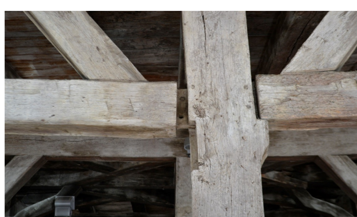
(b) Rupture de chevilles