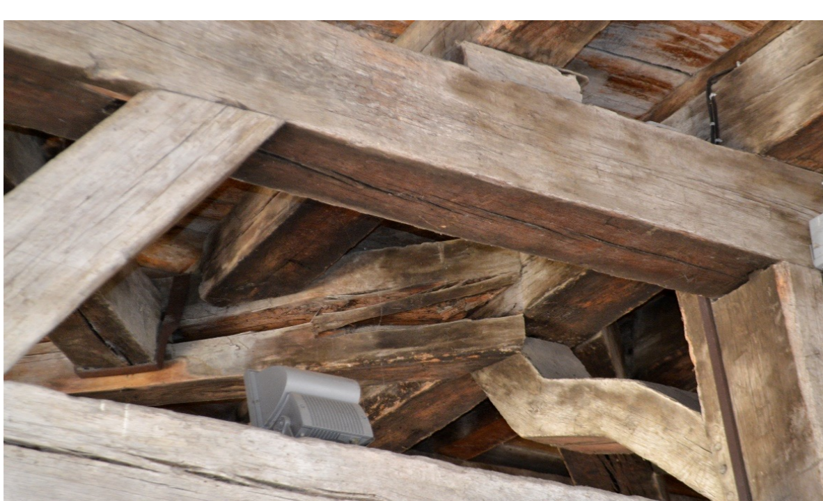
(a) Fente au niveau de l'enrayure

L'examen visuel de la structure de la halle a permis d'observer certains défauts structurels et pathologies dus à la vétusté de la structure, aux attaques biologiques des champignons causées par des infiltrations d'eau. Ces observations doivent être affinées et enrichir le modèle (dégradation des propriétés mécaniques).