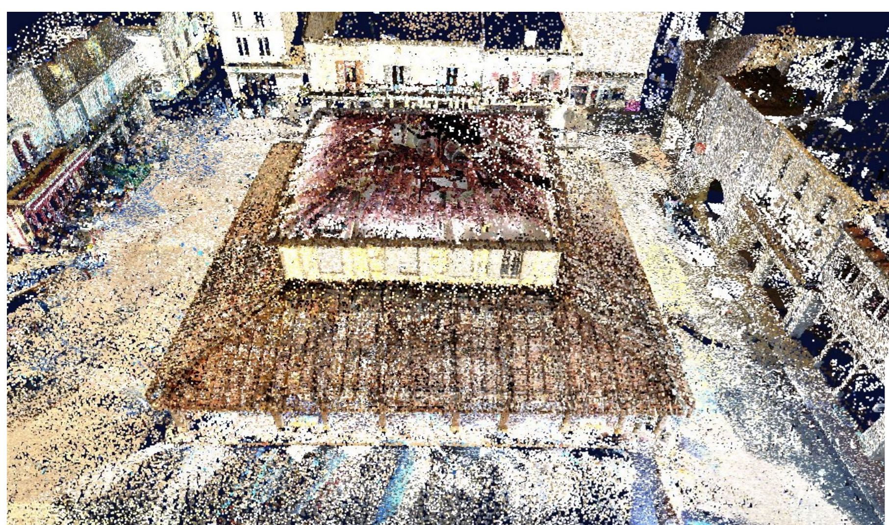
Rendu du relevé 3D effectué