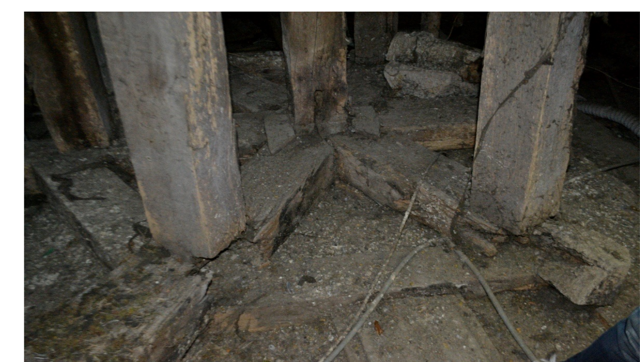
(c) Dégradations biologiques des éléments du chevêtre du clocheton dans les combles