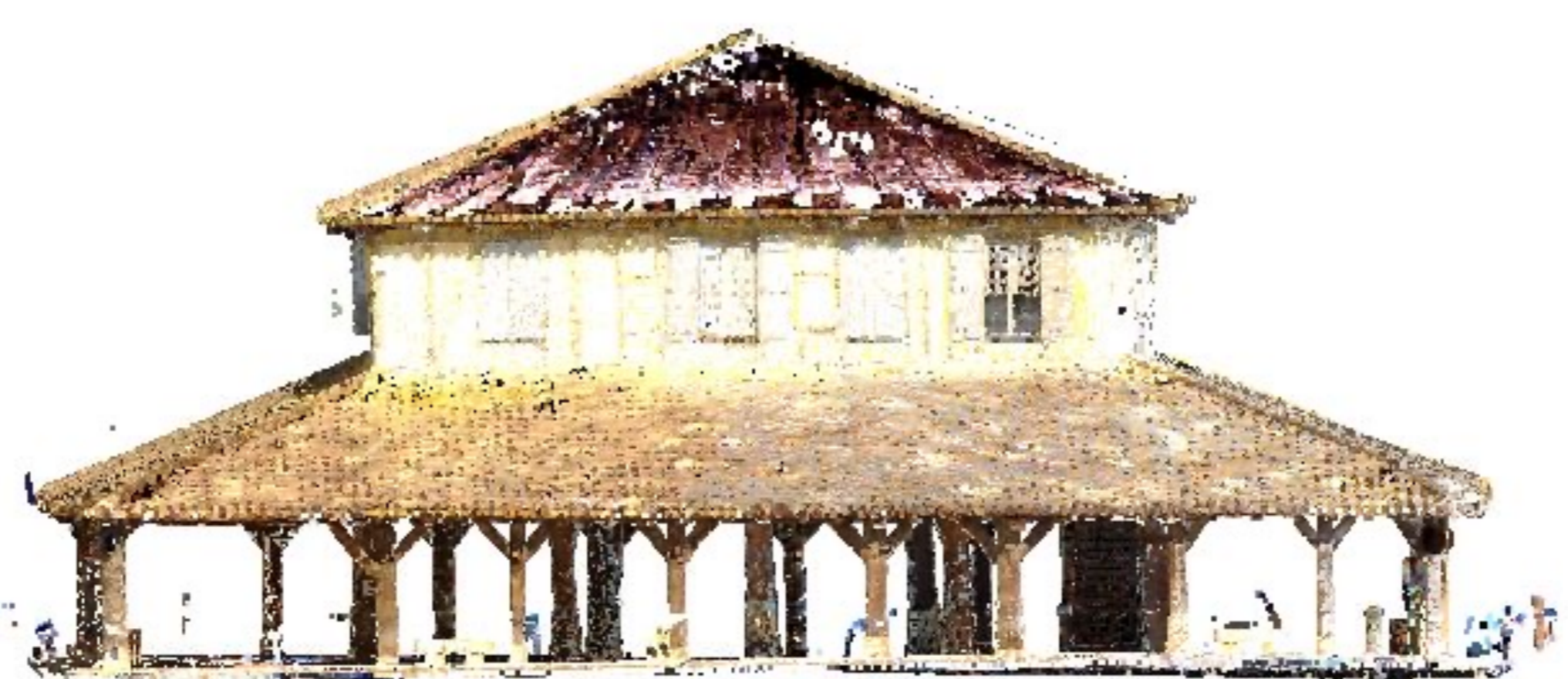
Vue en élévation de la halle