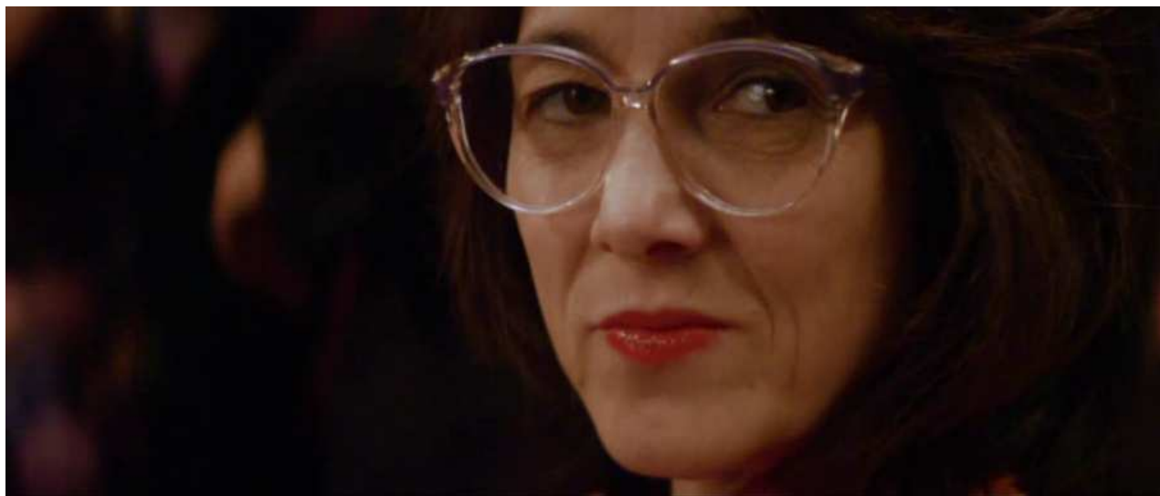
Figura 2. — Primeiríssimo plano que evidencia a composição de traços antagônicos no rosto da protagonista.

Na tentativa de fugir do institucionalizado, o longa Gloria procura arquitetar um olhar sobre o corpo envelhecido que não só faz dialogar corpos e atmosferas cinematográficas tradicionalmente opostos, como também chama a atenção para uma prática estética de fazer e desfazer rostos que Deleuze e Guattari 21 relacionam à (des)construção de subjetividades categorizadas. O rosto em close na tela pode ser aqui compreendido como um muro de significantes em constante (des)integração a partir do qual “traços de rostidades” divergentes se colocam dentro de uma mesma imagem.