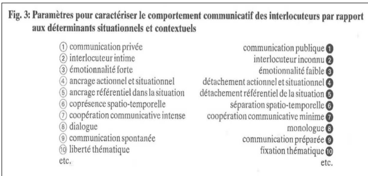
Extrait n° 1 de Koch & Oesterreicher, 2001 : 586

article de 2001. « L'approche communicationnelle de la variation » part de la liste des « Paramètres pour caractériser le comportement communicatif des interlocuteurs par rapport aux déterminants situationnels et contextuels » (extrait n° 1) qui permet l'établissement du continuum qui oppose l'immédiat (ou proximité) communicatif à la distance communicative. Leur démarche permet d'envisager un « relief conceptionnel » (extrait n° 2), c'est-à-dire une visualisation des situations d'interaction mettant ainsi en lumière leur spécificité due à la combinaison des paramètres. Le continuum quant à lui (extrait n° 3) représente l'ensemble infini des situations d'interaction possibles positionnées selon leur « valeur paramétrique » entre l'immédiat (ou proximité) et la distance communicative.