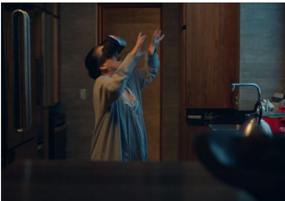
FIG. 11. — De pernas para o ar 3