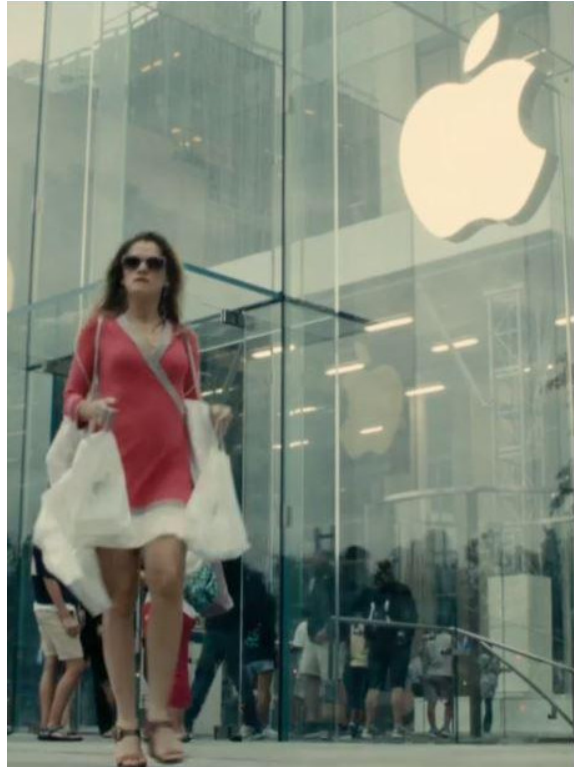
FIG. 10. — De pernas para o ar 2