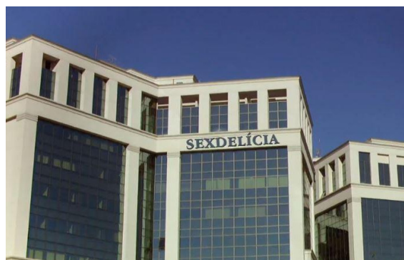
FIG. 8. — De pernas para o ar 1

que celle de leurs salaires, ont été approuvées lorsque Dilma Rouseff était au gouvernement 31 . Ces mesures ont provoqué un mécontentement important chez les employeurs des classes moyenne et supérieure, ce qui a également contribué aux changements politiques survenus depuis 2016.