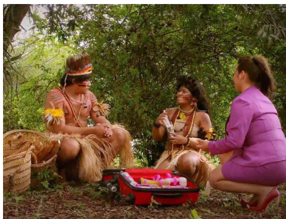
FIG. 2. — De pernas para o ar 1