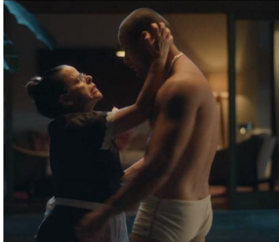
FIG. 12. — De pernas para o ar 3

Si le film cherche à encourager une certaine réalisation féminine conforme au post-féminisme, qui passe par un travail acharné, mais également par le plaisir sexuel, même solitaire, on notera toutefois que dans les images de cette série, il n'y a aucune avancée dans la représentation de l'employée domestique, alors que, depuis 2013, de nouvelles lois régularisaient déjà cette activité et que certains changements sociaux étaient perceptibles, comme le montre le film Une Seconde Mère (2015) d'Ana Muiyaert. Dans ces films, comme dans les aspirations des classes opposées à la