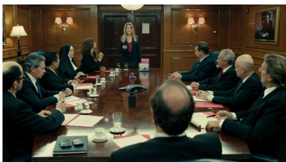
FIG. 3. — De pernas para o ar 2