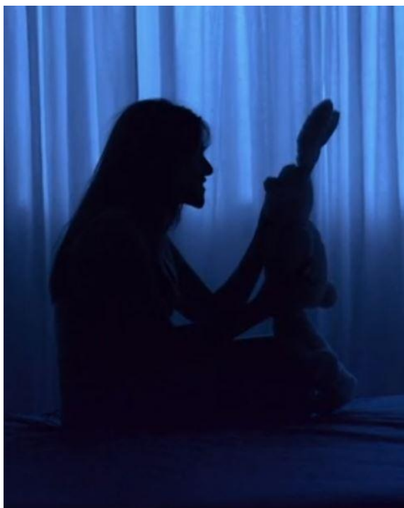
FIG. 1. — De pernas para o ar 1