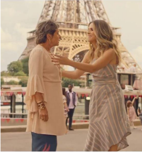
FIG. 5. — De pernas para o ar 3