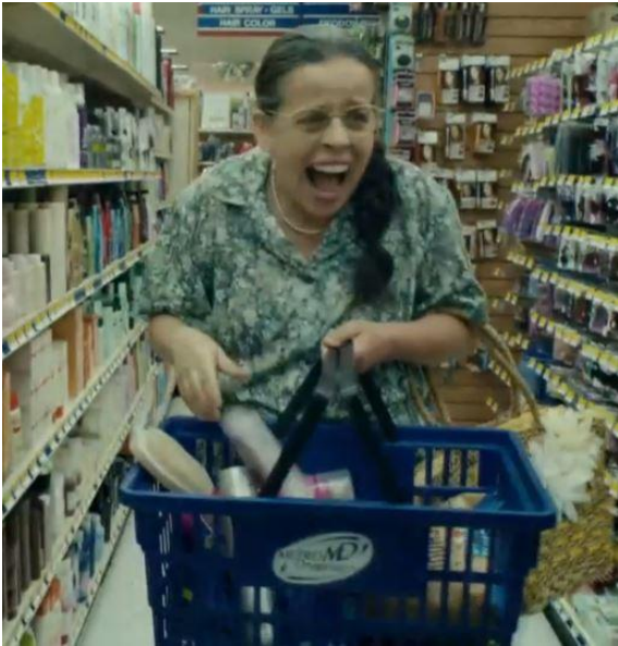
FIG. 9. — De pernas para o ar 2